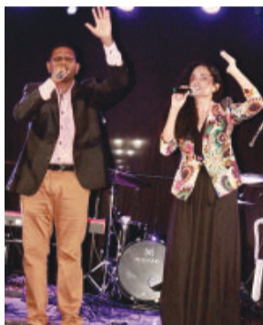
Foram várias participações

O evento teve início na quarta-feira (3), na praça do Rosário, com adoração exclusiva a Jesus, em uma só voz, um