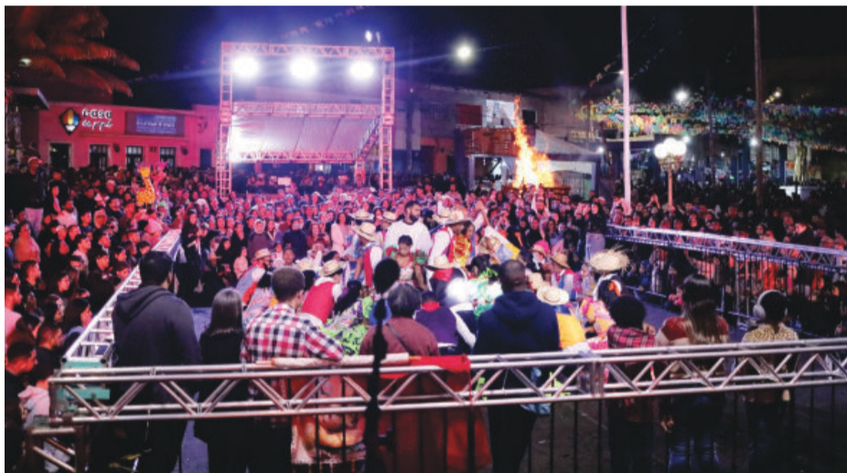
Pagamento será realizado nesta sexta-feira, às vésperas do Jubileu de São João Batista; medida beneficia 1.367 servidores

Para Abade, a antecipação reforça o compromisso da gestão com a valorização dos servidores públicos. “Nosso servidor é parte fundamental de tudo que a Prefeitura realiza. A antecipação do décimo terceiro é uma forma de reconhecer esse trabalho e garantir mais tranquilidade às famílias. Ao mesmo tempo, fortalecemos a eco-