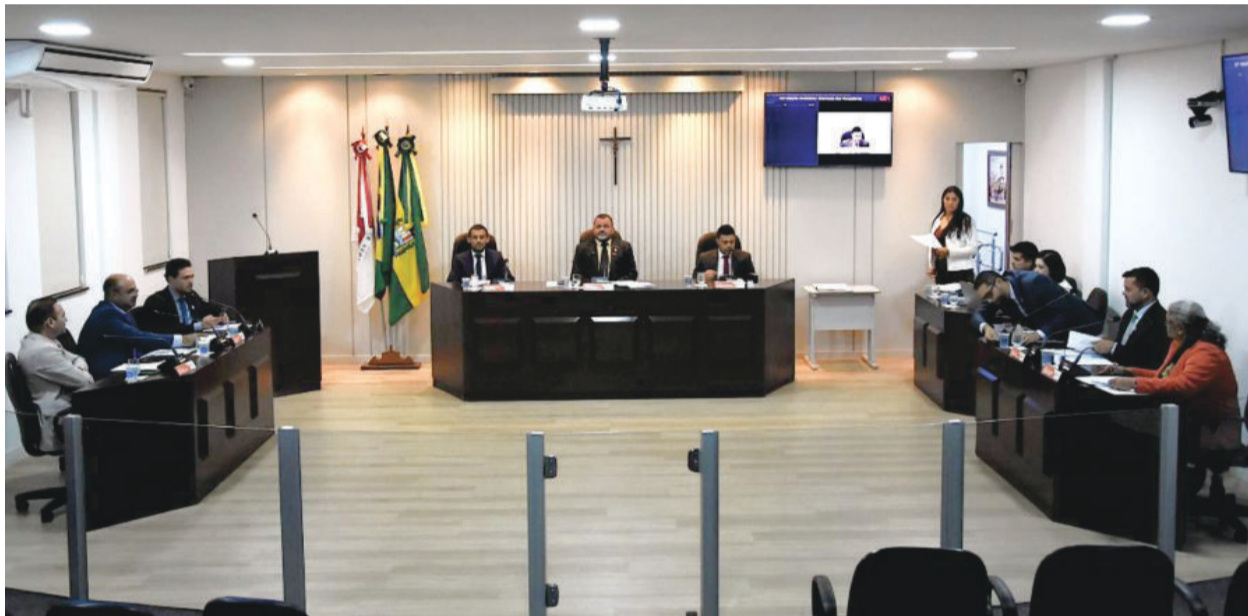
Sessão aconteceu na segunda-feira (8) em virtude do feriado de Corpus Christi

Um dos projetos aprovados busca valorizar os artesãos locais, incentivar a geração de renda, promover capacitações, estimular feiras e exposições e fortalecer a integração do artesanato com o turismo e a cultura do município.