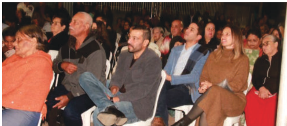
Público participou de momento de louvor e de canções gospel

“O projeto nasceu da união das igrejas evangélicas da cidade para glorificação e honra a Deus. E de muita alegria para nós. Temos um ver-