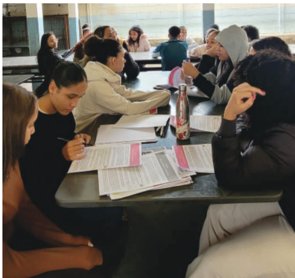
A eleição oficial dos representantes acontecerá no dia 15 de junho

Durante as próximas semanas, os candidatos poderão apresentar suas propostas aos colegas, compartilhar ideias e dialogar sobre temas rela-