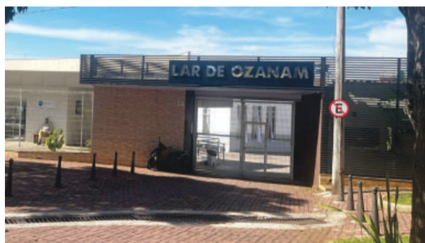
Entidade fica no bairro Campestre e hospeda 58 idosos