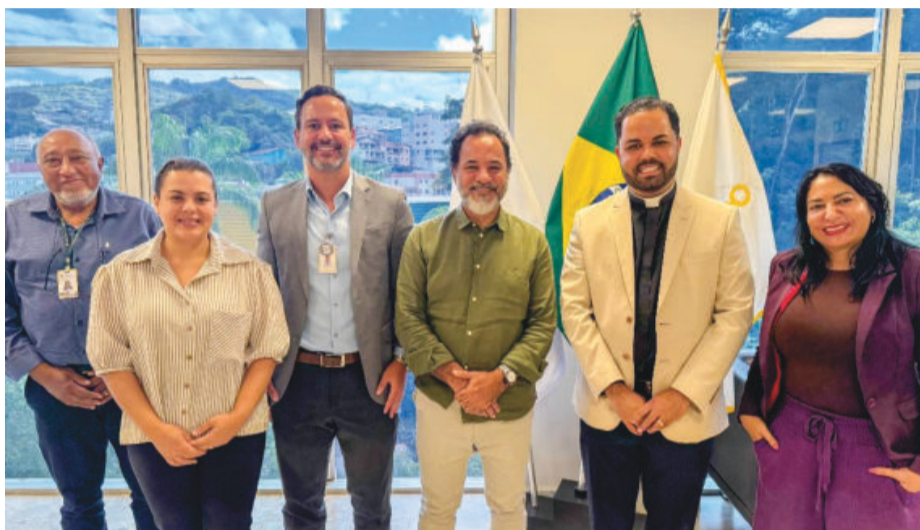
Gestores do HNSD e da Prefeitura logo após o encontro no gabinete

Entre os temas debatidos estiveram os investimentos em andamento no hospital, como a implantação da nova Unidade de Terapia Intensiva (UTI), a ampliação do serviço de hemodiálise e os projetos de expansão estrutural da instituição. As obras e melhorias devem ampliar a capacidade de atendimento da unidade e gerar novos postos de trabalho na área da saúde.