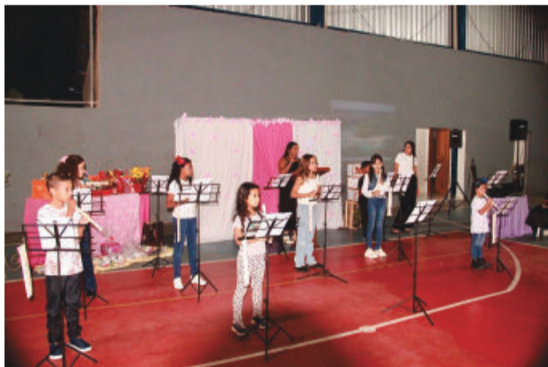
As celebrações foram abrilhantadas por apresentações dos alunos dos serviços ofertados pelo Cras