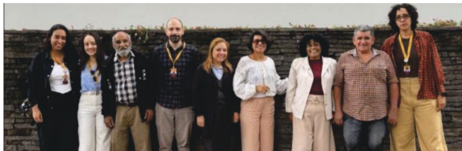
A sessão de julgamento pôde ser acompanhada presencialmente por quatro representantes da Comissão de Atingidos do Sistema Pontal e seis da ATI/FIP