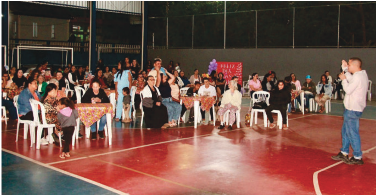
Celebrações aconteceram na quinta-feira (6), na quadra do Centro

O Dia das Mães em São Sebastião do Rio Preto foi abrilhantado por apresentações dos alunos dos serviços ofertados pelo Centro de Referência de Assistência Social (Cras), e