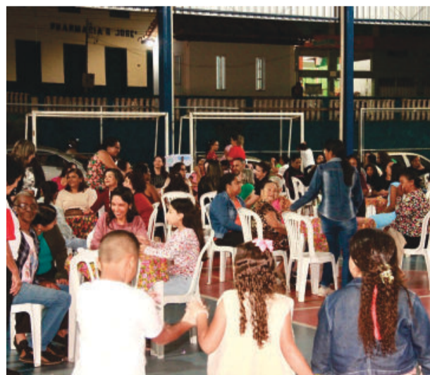
Após as apresentações, foi servido jantar acompanhado de muita descontração