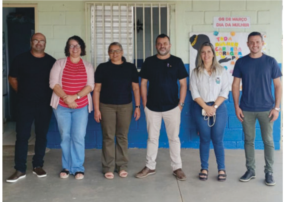
Desta vez os vereadores cumpriram agenda na Escola Municipal do Una. Esta foi a sétima unidade de ensino visitada pelos parlamentares

A Câmara Municipal de São Gonçalo do Rio Abaixo realizou mais uma visita a instituições de ensino do município.