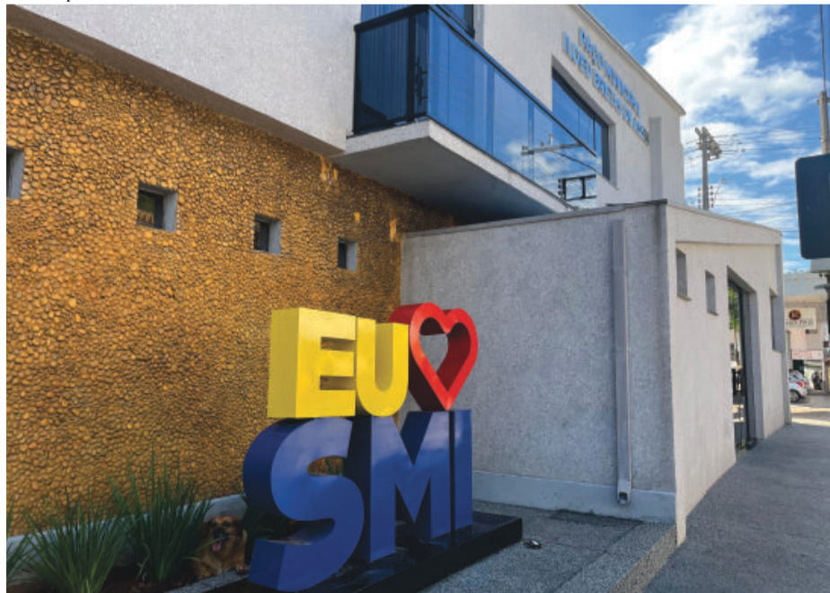
Encontro com dirigentes sindicais aconteceu no Paço Municipal

ponsabilidade fiscal e diálogo, buscando conciliar a valorização dos servidores com o equilíbrio das contas públicas e a manutenção dos serviços prestados à população.