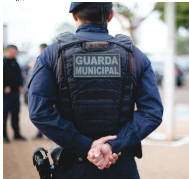
O concurso oferece 48 vagas para o cargo

ção por prova discursiva, teste de capacidade física e avaliação de altura, investigação social, avaliação psicológica, avaliação clínica e, por fim, curso de formação.