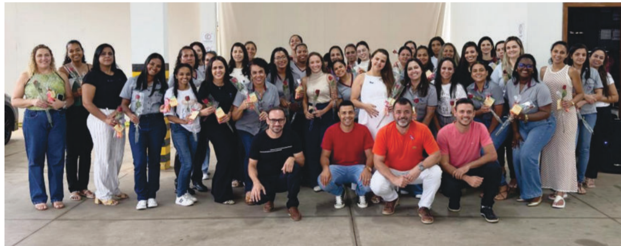
Os vereadores, agachados, destacaram a importância da mulher em todos os espaços da sociedade

dora recebeu um brinde simbólico preparado pela Câmara em agradecimento ao trabalho, de-