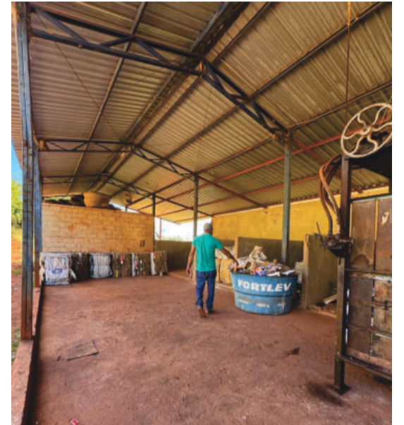
Usina de triagem do município

A Prefeitura de Santo Antônio do Rio Abaixo está implantando o Programa Municipal de Educação Ambiental e o Programa Municipal de Coleta Seletiva, iniciativas que visam fortalecer a consciência ambiental e melhorar a gestão de resíduos no município.