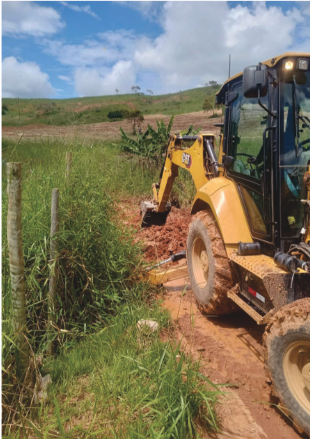
Serviço de drenagem em Medeiros vai garantir mais segurança aos moradores

A Secretaria Municipal de Obras de São Sebastião do Rio Preto segue o compromisso de levar mais qualidade de vida para a população.