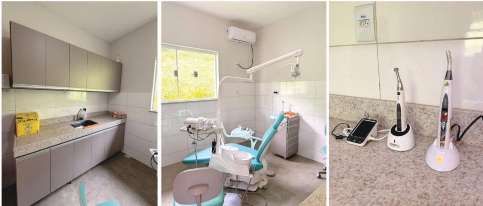
O espaço foi totalmente renovado com a aquisição de novos equipamentos odontológicos e mobiliários

Segundo o prefeito Alexandre Rodrigues, investir na saúde é ga-