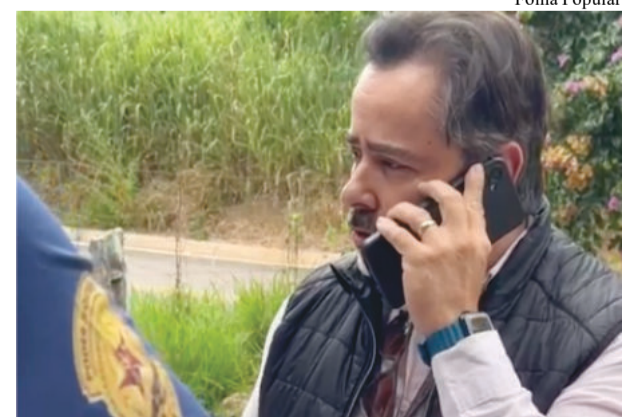
Oficial de Justiça atendeu ligação do vereador Carlos Henrique antes de cumprir a ação

vir áudio do vereador Carlos Henrique de Oliveira (PDT) de que ninguém seria despejado, que a Prefeitura estava acompanhando o caso e que daria todo apoio. Espantados, os oficiais de Justiça disseram que o parlamentar cometeu um grave erro, passivo até mesmo de prisão caso estivesse no local,