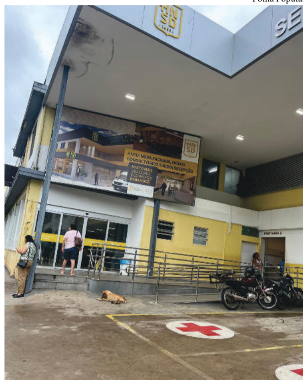
Mesmo com depoimentos de pacientes, hospital nega denúncia