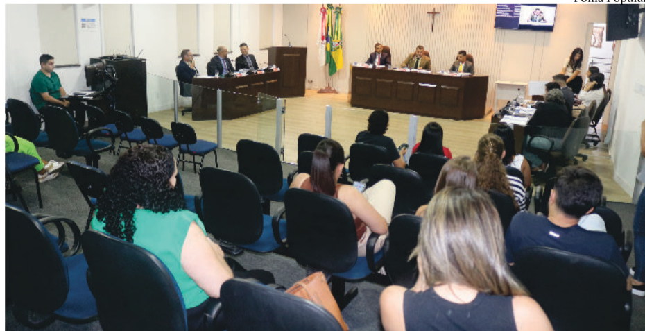
Público no auditório durante sessão ordinária no plenário

"Posso falar que este é outro grande projeto que temos orgulho de participar. Estive na Assembleia Legislativa dia 21 de março e conheci como é a adesão das cidades ao programa, que tem o objetivo de trazer o jovem para as discussões políticas. Estou muito feliz em ver os jovens de nossa cidade neste projeto, que segue sendo mantido pela nossa gestão. No mais, quero dizer que seguimos trabalhando para proporcionar mais qualidade de vida para o povo de São Gonçalo.