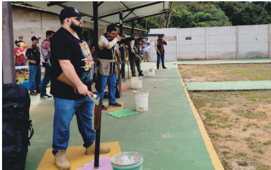
A nova modalidade oferecida pelo clube promete agregar ainda mais para o esporte de tiro esportivo em toda a região

participante. A próxima será realizada no Clube Caça Dragões da Prata, em São Domingos do Prata, no dia 3 de maio.