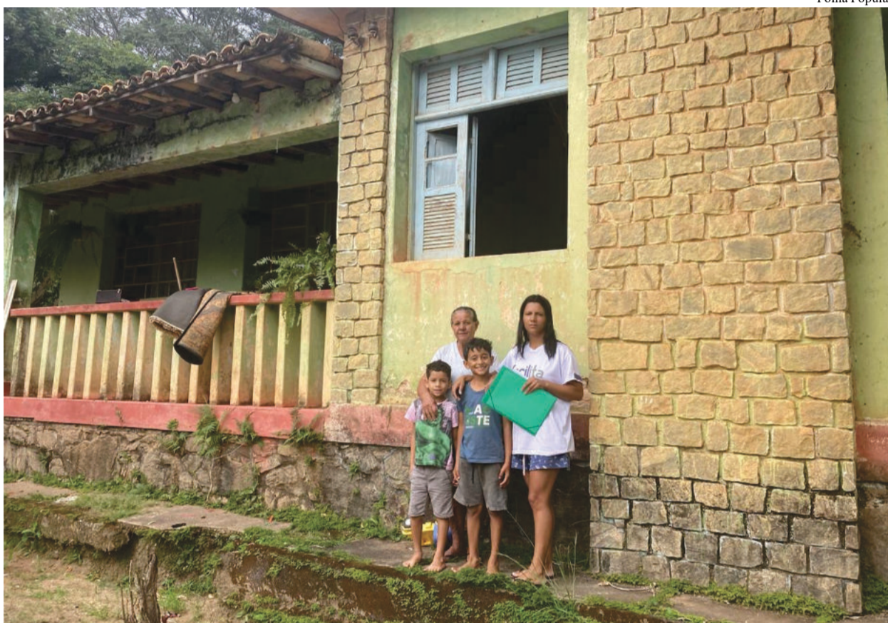
Família residia no local há quase 40 anos e ação de reintegração não teve acompanhamento social

Após ser intimada, em 8 de março deste ano, de que deveria deixar o imóvel em 30 dias, a família deu início a uma corrida contra o tempo, acionando advogados e a Assistência Social da