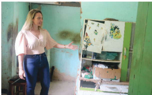
Da velha casa para uma nova residência; momento foi comemorado com feijoada