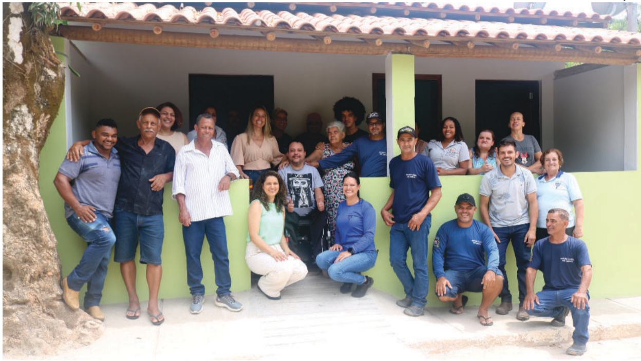
Beneficiário ao lado da família, prefeita, assistentes sociais e equipe do setor de obras habitacionais

“No dia 6 de janeiro, eu chamei o encarregado de obras sociais e fechamos um acordo de