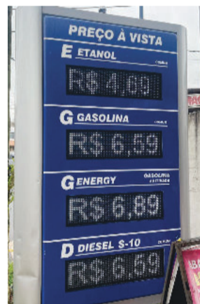
Itabira G: R$ 6,59 - D: 6,59