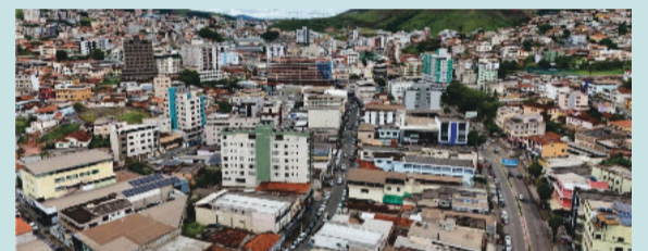
Vista panorâmica da cidade

SOLICITAÇÃO DEVE SER FEITA DE 3 DE FEVEREIRO A 31 DE MARÇO