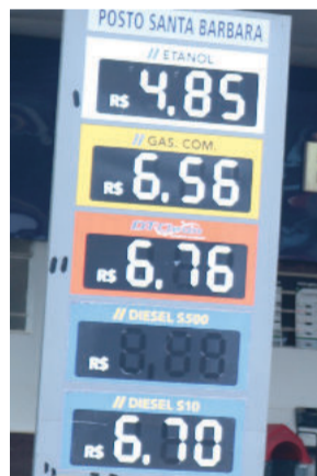
Santa Bárbara G: R$ 6,56 - D: 6,70