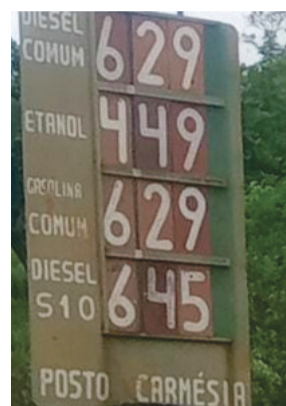
Carmésia G: R$ 6,29 - D: 6,45