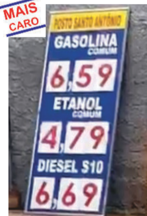
Santo Antônio R. A. G: R$ 6,59 - D: 6,69