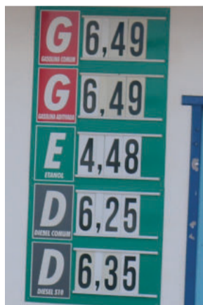
Catas Altas G: R$ 6,49 - D: 6,35