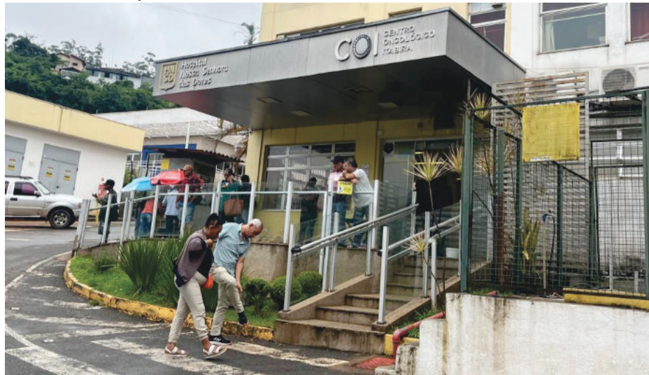
Centro Oncológico do Hospital Nossa Senhora das Dores

segunda-feira (27) anunciando o afastamento do médico, além de outras medidas.