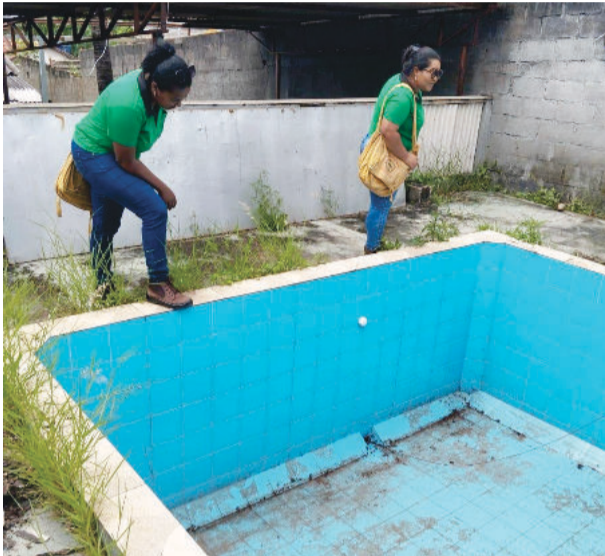
A ação envolveu 12 agentes de endemias e dois supervisores de endemias

te, Nova Monlevade, Metalúrgico, Cidade Nova, Boa Vista e Nova Aclimação também foram visita-