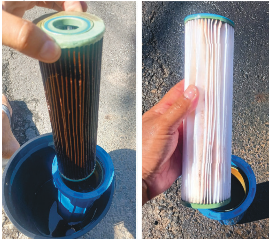
Morador envia para o Folha Popular fotos de vela de filtro usada para reduzir a sujeira da água que chega em sua casa

bairros Gabiroba, Jardim dos Ipês e outros localizados na mesma região, estão reclamando da qualidade da água vendida pelo Serviço Autônomo de Água e Esgoto (Saae). Eles dizem que a água que está saindo da torneira é suja e com cor amarelada e não dá para ser usada nas atividades domésticas. Eles relatam que o problema nunca foi resolvido.