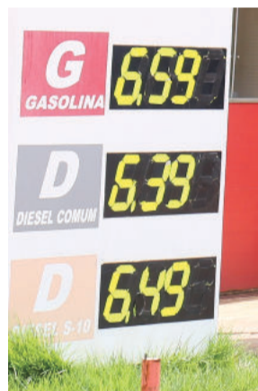
Itambé M. Dentro G: R$ 6,59 - D: 6,49