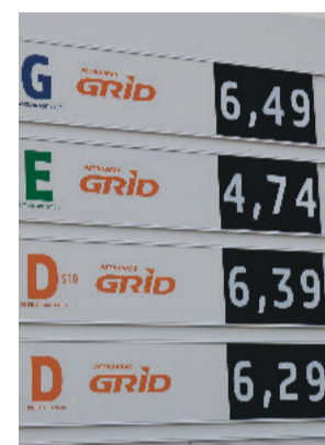
Barão de Cocais G: R$ 6,49 - D: 6,39