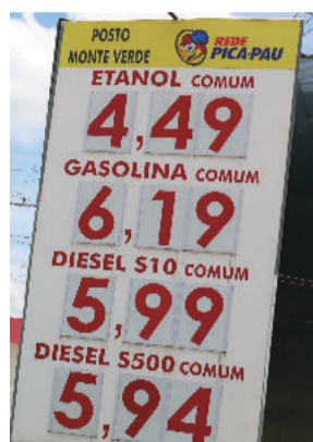
São Gonçalo do R. A. G: R$ 6,19 - D: 5,99