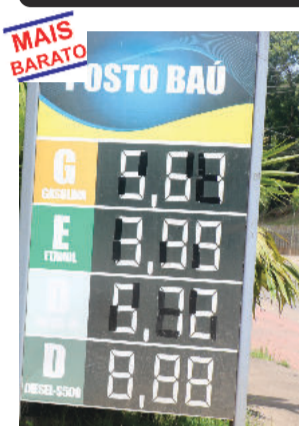
João Monlevade G: R$ 5,67 - D: 5,72