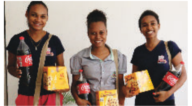
Todos os servidores receberam o benefício

Seguindo leis específicas, a Prefeitura de Passabém entregou na quinta-feira (5) um kit de Natal para todos os servidores, incluindo os da Fundação de Saúde, Hospital São José.