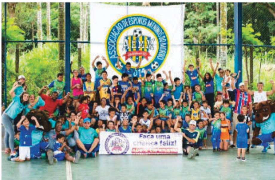
O projeto social Meninos do Morro (foto) e o programa Bem-Estar Aqua Señor também serão reconhecidos

A premiação abrangerá diversas modalidades esportivas, como futebol, futsal feminino e masculino, muay thai, taekwondo, karatê, motocross, mountain bike, ciclismo de estrada, fisiculturismo feminino, beach tennis (masculino e feminino), basquete, corrida de rua, atleta escolar (módulos I e II, masculino e feminino), melhor técnico e técnica, atleta revelação e superação, destacando tanto