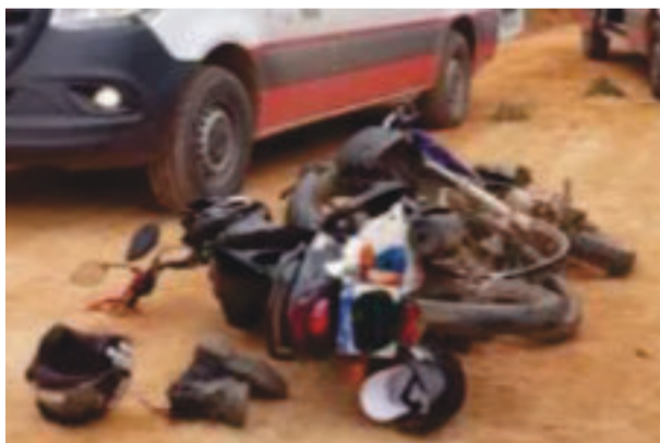
Acidente aconteceu no dia 4