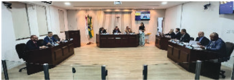
Vereadores durante sessão de quinta-feira (6)

Outro projeto, aprovado em segundo turno, determina a criação de campanha educativa sobre o uso de dispositivos eletrônicos para fumar