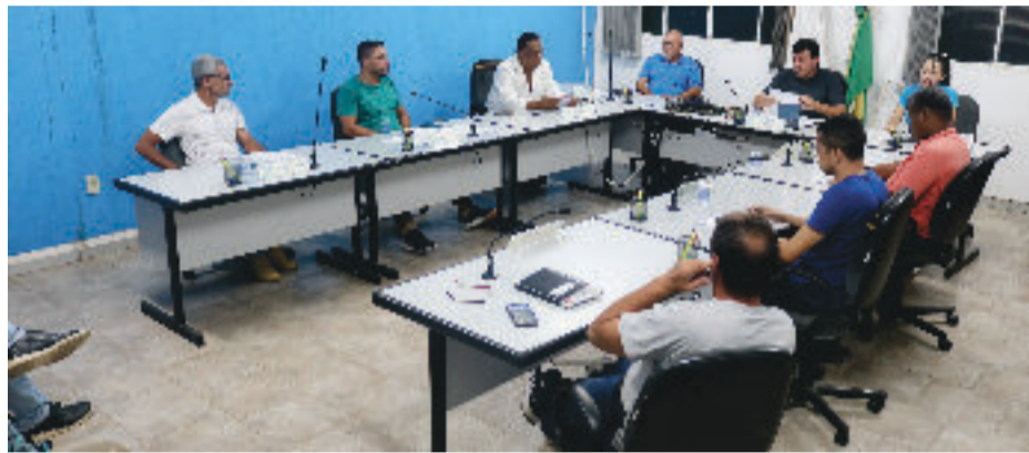
Presidente Jair Lino destacou que indicações são resultados da economia

Outra indicação, feita também neste ano, está possibilitando o calçamento do morro do Quito, de acesso ao distrito de Itauninha. O valor devolvido para a Pre-