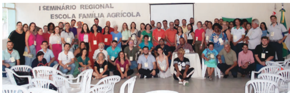
Projeto ganhou força após seminário em novembro de 2023

A instalação da EFA já se encontra em estágio avançado e a expectativa é de que a nova escola esteja funcionando até meados de 2025.