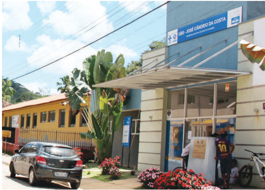
Atendimentos serão realizados mediante agendamento prévio na UBS

O câncer de próstata é o mais frequente entre os homens e o segundo maior, depois do câncer de pulmão, por morte em homens. Segundo informações publicadas no site do Ministério da Saúde, em 2023, foram notificadas 17.093 mortes por câncer de próstata no Brasil, o que corresponde a 47 óbi-