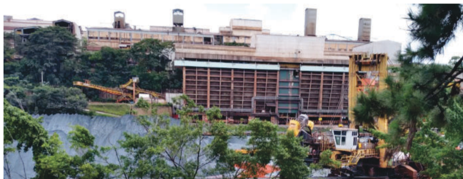
Usina do Cauê, em Itabira

Caso seja aprovada, os trabalhadores receberão um reajuste de 5%, cerca de meio por cento a mais em relação à inflação oficial divulgada pelo Índice Nacional de Preços ao Consumidor Amplo (IPCA), de 4,62%. O piso salarial base praticado pela empresa subirá para R$ 2.120. O cartão-alimen-