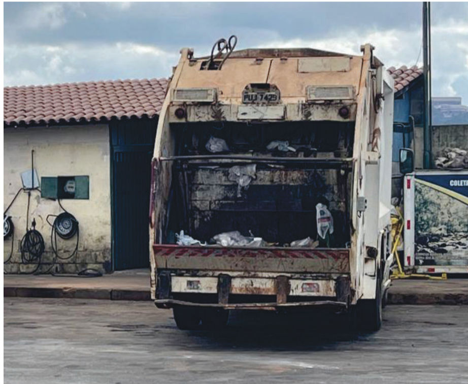
É visível o sucateamento da frota da Itaurb, conforme registro na manhã do dia 3 de julho no pátio de manutenção da autarquia da Prefeitura

regularidades no período entre 2019 e 2023. Diante da resistência enfrentada na solicitação dos documentos, a comissão buscou informações no Portal da Transparência, em especial, dados acerca das demonstrações contábeis do período, documentos esses, como dito, correspondem a uma obrigação acessória perante ao Fisco federal, com base nos livros contábeis, hoje digitalmente escriturados.