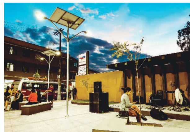
No pacote de inaugurações estão ainda a reforma da praça do Povo, no Centro

Outra obra que entrou neste calendário de inaugurações foi a construção da Via do Minério, entregue para a população no dia 27 de junho.