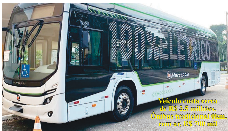
Veículo custa cerca de R$ 3,5 milhões. Ônibus tradicional 0km, com ar, R$ 700 mil

Conforme informações apuradas pela reportagem, o veículo elétrico