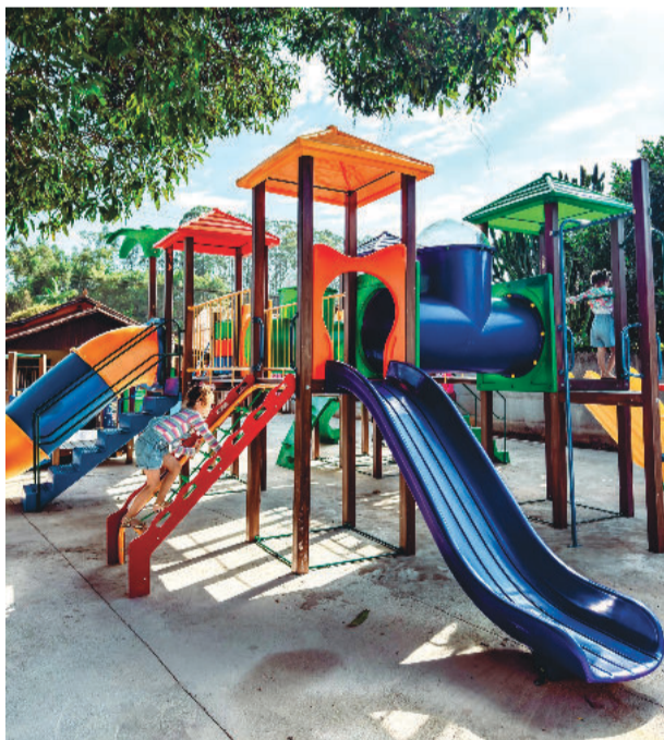
Depois de anos de abandono, voltou a funcionar, no sábado (29), o Parquinho Infantil Inclusivo Eduarda Aparecida Dias Ferreira

O espaço passou por completa revitalização e ganhou brinquedos novos, adaptados para cri-