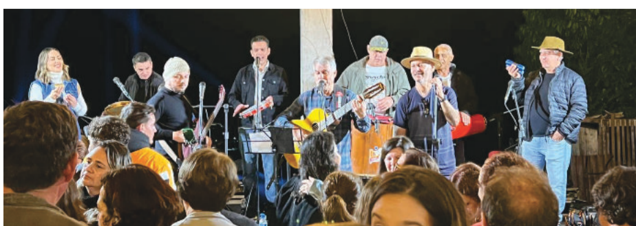
Festival teve início na sexta-feira (28), com show de Los Bandidos (foto) e segue neste fim de semana na Vila e extensão da avenida Israel Pinheiro

Festival de Inverno itinerante segue neste fim de semana em Santa Maria