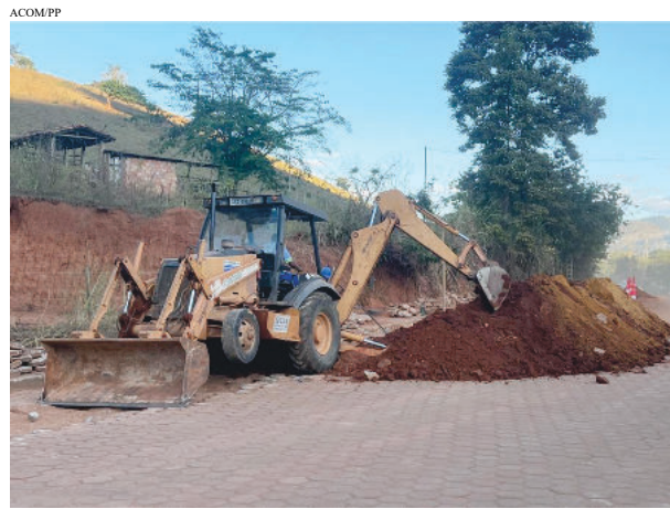
Redes de esgoto também estão sendo trocadas

Além das pontes, estradas vicinais também estão sendo recuperadas, como também o rebaixa-