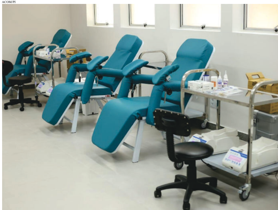
A partir do dia 6 de junho, uma quinta-feira, unidade deve iniciar coleta de sangue

Para doar, será necessário fazer agendamento prévio, por telefone ou WhatsApp. Os números serão divulgados em breve nos canais FSFX, administradora da HMCC. Os agendamentos também poderão ser feitos presencialmente, por or-