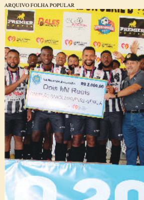
No ano passado, além de troféu, o campeão faturou R$ 2 mil

No Estádio do Smec, o time do Sparta carimbou a vaga ao vencer a equipe do Barro Preto Futebol por 5 x 3 nos pênaltis, em jogo que acon-