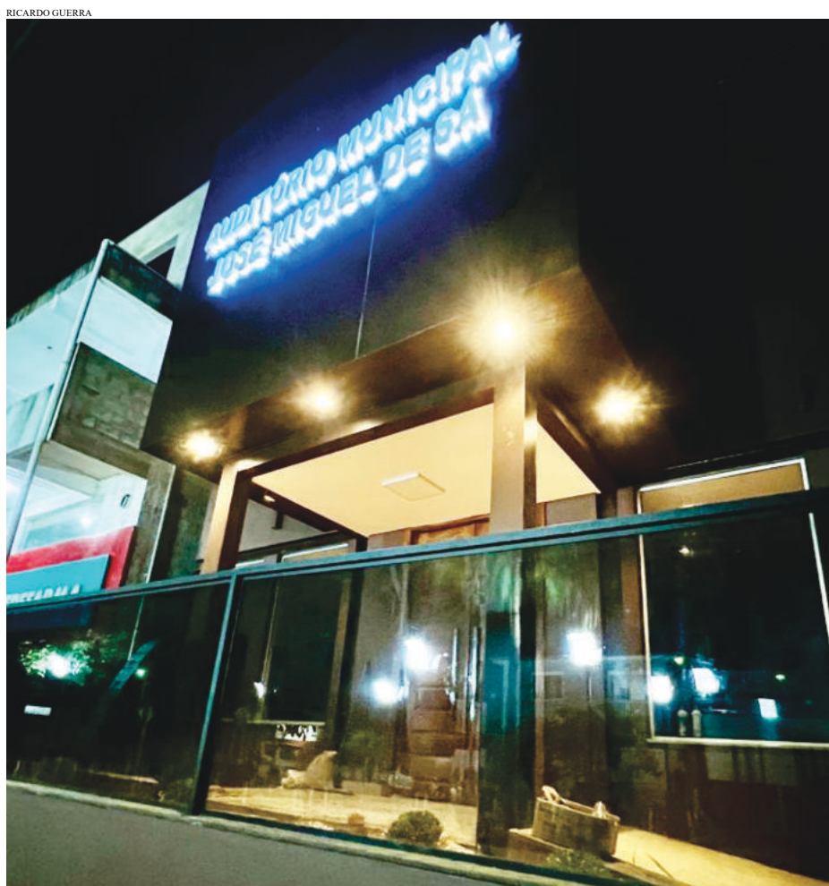
Conforme o projeto, são 467,84 metros quadrados de área construída

vai atender toda a comunidade de Passabém por meio de atividades como