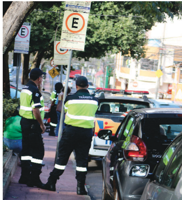
Agentes na região bancária da cidade

estacionar em vagas para deficientes, dirigir com o braço do lado de fora, estacionar em posição diferente da indicada em placa, volume alto, parar sobre faixa de pedestre, em ponto de embarque, estacionar fora da guia, conduzir com a placa contendo símbolos meio apagados, convergir em local errado, transportar passageiros em local de cargas e outras.