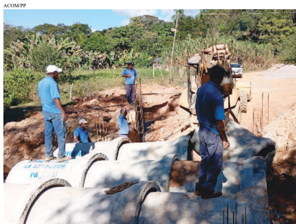
Obras da nova ponte já foram iniciadas

Esta ponte em Macacos, como várias outras, foi destruída pelas fortes chuvas.