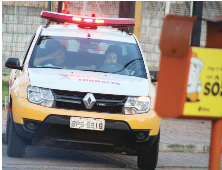
Avenida Mauro Ribeiro é outro ponto bastante vigiado