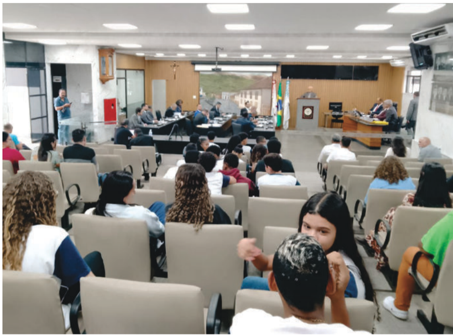
A revisão geral nos vencimentos é estendida a todos os servidores municipais

“Nós temos a nossa data-base. Nós temos o direito de fazer um acordo coletivo. Nós fizemos a nossa assembleia e o prefeito um dia depois da nossa assembleia, en-