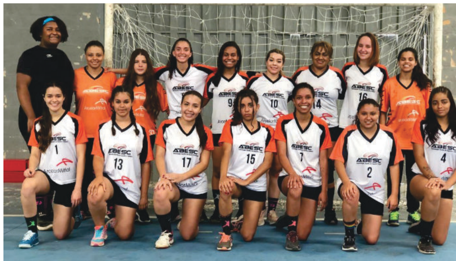
Equipe feminina de handebol