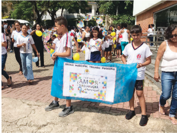
Passeata de conscientização com alunos e professores da escola Trajano Procópio