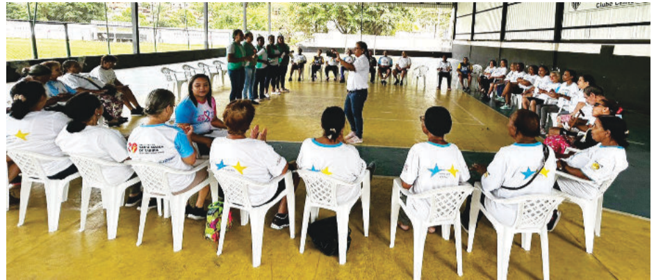
Grupo Felicidade abordou Cuidados com a Memória

As comunidades do Barro Preto e do Chaves, receberam no período da manhã da quarta-feira (3) e quinta-feira (4), a palestra “Saúde da mu-