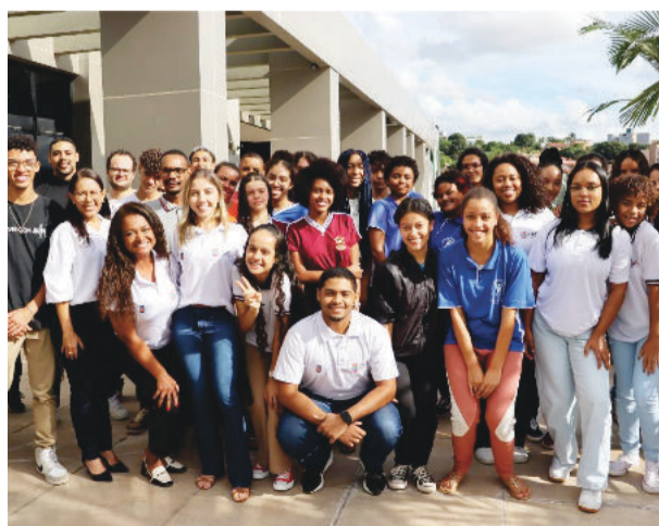
O Parlamento Jovem tem como objetivo promover a formação política e cidadã entre os estudantes do ensino médio