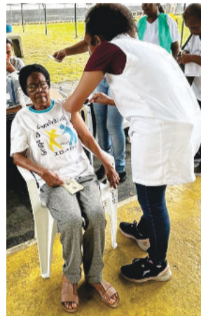
Programação conta também com atualização de vacinas

No PSF Agenor a palestra “Saúde da mulher/benefícios da atividade física, também apresentada para as comunidades do São Pedro e do Florença, pela manhã no dia 3.