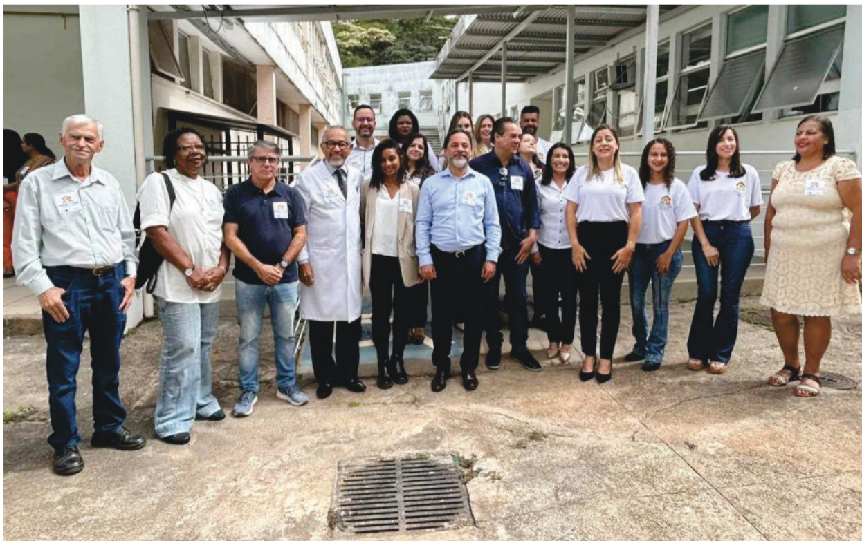
Equipe do programa Melhor em Casa, prefeito e vice durante a inauguração, em abril de 2023

Mais informações “ ofolhapopular.com.br ”