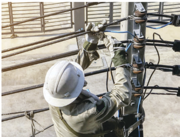
Moradores cobram o fim das constantes quedas de energia nas zonas urbana e rural

“Essas obras vão ajudar a evitar desligamentos na cidade de Santa Maria de Itabira, porque se trata de substituição por cabos mais robustos e protegidos, o que torna a rede mais estável e menos suscetível às condições atmosféricas. Por exemplo, o toque acidental de um galho ou um pássaro que poderia afetar a rede anterior ou poderia até mesmo partir o antigo cabo, com a nova rede já não vão ocorrer mais”, diz a Cemig em nota enviada ao Folha Popular , em resposta a