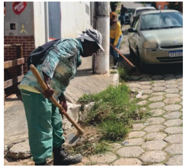
Entre as ações, estão a limpeza de ruas, capina, roçada e recolhimento de entulhos e objetos que possam acumular água parada

Em se tratando de casos suspeitos, após uma reunião realizada na segunda-feira (22), a Secretaria de Saúde ampliou os horários de