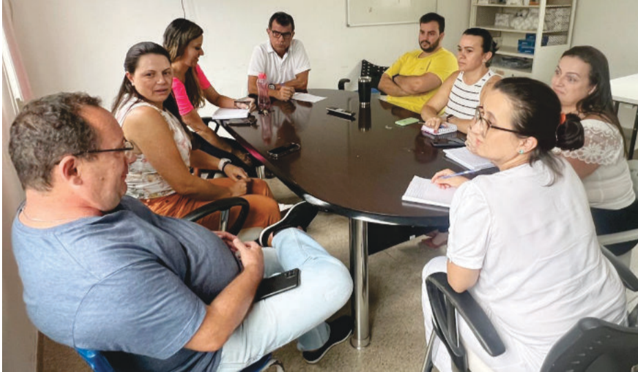
Durante encontro, secretários e agentes de obras da Prefeitura traçaram metas a serem cumpridas

O verão e, sobretudo, as chuvas de início de ano trazem velhos problemas aos municípios e à população: o aumento no número de casos de doenças causadas pelo mosquito Aedes aegypti . Em Santa Maria de Itabira não é diferente. No levantamento da última semana epidemiológica de 2023, foram 58 casos notificados. Já na primeira semana epidemiológica