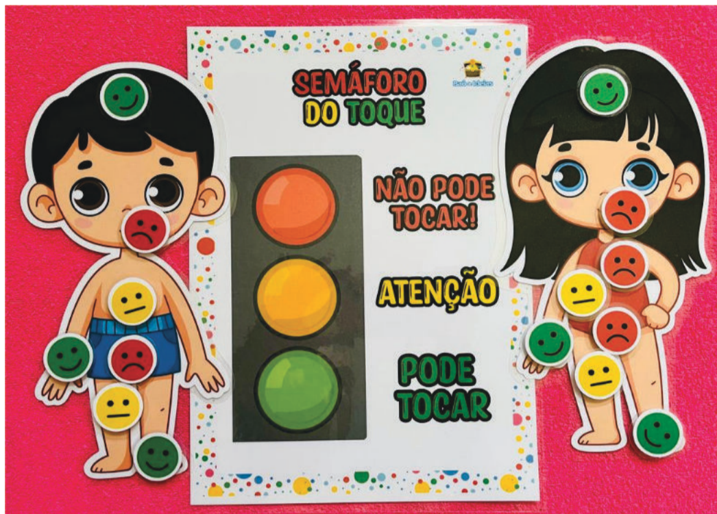
O Semáforo do Toque é uma forma descontraída de ensinar as crianças sobre partes de seu corpo onde elas podem e não podem ser tocadas por outras pessoas