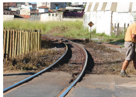
Linha férrea entre a vila São Joaquim e bairro Areão dará lugar a nova avenida