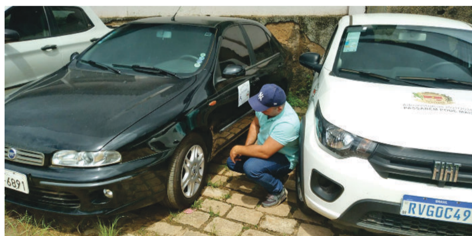
Empenho do vice-prefeito resultou na conquista de um Fiat Marea, um Renault Fluence, uma Nissan Frontier 4x4 e um Ford Ecosport

Segundo o vice-prefeito, ele descobriu, recentemente, que esses órgãos todo ano colocam veículos e bens móveis do Estado e da União para doação a municípios interessados. Assim que tomou conhecimento, ele entrou em contato e deu início ao processo, candidatando a Prefeitura de Passabém para ser beneficiada. Ele mes-