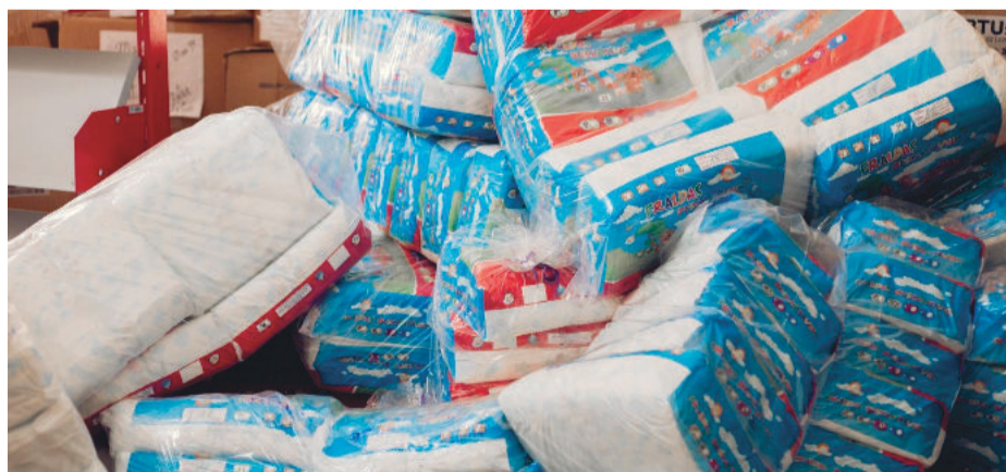
Pelas informações, cerca de 2 mil crianças serão beneficiadas

A fabricação de fraldas e absorventes higiênicos é um projeto do PEM, que tem a parceria da Prefeitura de Itabira, por meio do termo de fomento com a Secretaria de Desenvolvimento Econômico. A fábrica Maria Cassemira, instalada no bairro