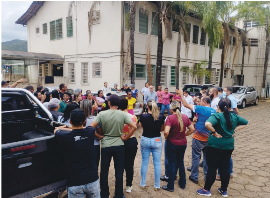
No mês passado, servidores promoveram um movimento na porta do hospital com presença de vereadores e membros do Mais Saúde

O contrato entre a Prefeitura e o Instituto Mais Saúde, que administrou o hospital durante os últimos sete anos,