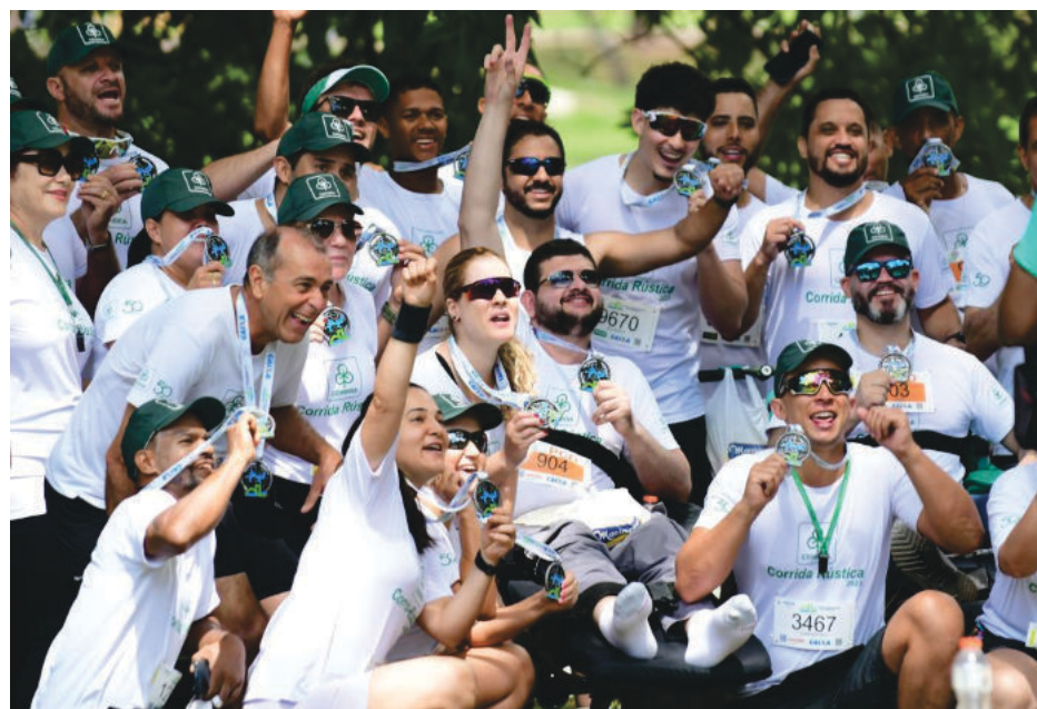
Colaboradores da Cenibra em foto com medalhas da corrida

calizada no leste de Minas Gerais, a Celulose Nipo-Brasileira S.A. (Cenibra) opera com uma unidade industrial em Belo Oriente, com duas linhas de produção de celulose branqueada de fibra curta de eucalipto e capacidade instalada de 1,2 milhão de toneladas/ano. A empresa está presente em mais de 80 municípios mineiros, com cerca de sete mil empregos diretos.