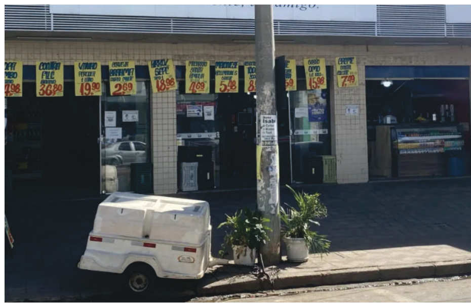
O kit não estava disponível no dia 10 em supermercado no Centro

Conforme a Prefeitura, o benefício estará disponível para todos os alunos matriculados na