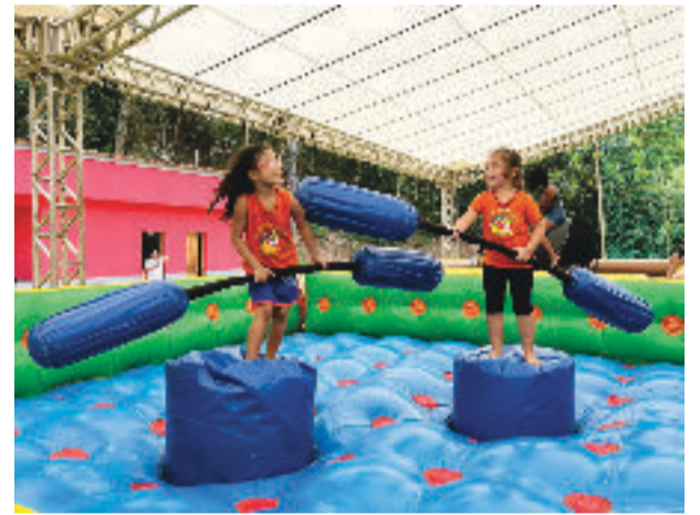
Vários brinquedos infláveis, como o cotonete gigante, e guloseimas fizeram a alegria de todos

As comemorações da Semana da Criança nas escolas municipais seguem durante a semana.