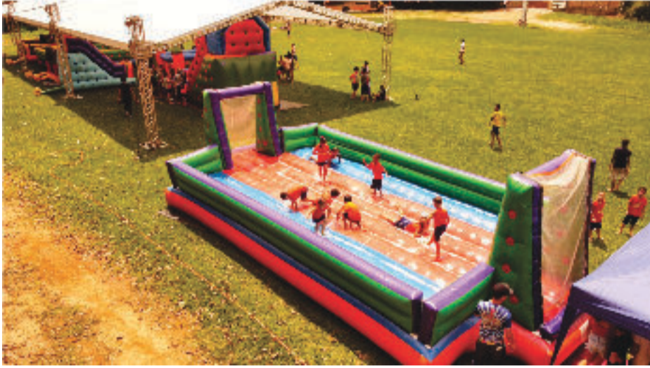
Calor e muita diversão na disputada quadra de sabão

Municipal de Educação Infantil (Cmei) da Mônica e do ensino fundamental da Escola Municipal Euclides Ferreira de Sá.