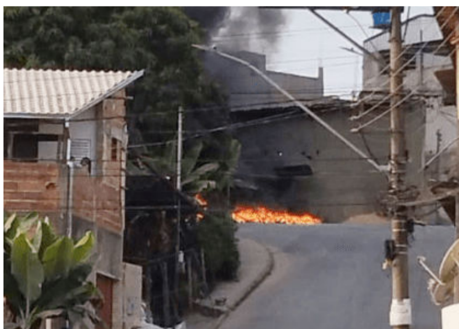
Moradores fecham a rua Ouro Preto em protesto pela falta d'água

PLR 2023/2024 - COMO É QUE É? Vale alega despesas extras e 'frouxidão' para reduzir benefícios aos trabalhadores