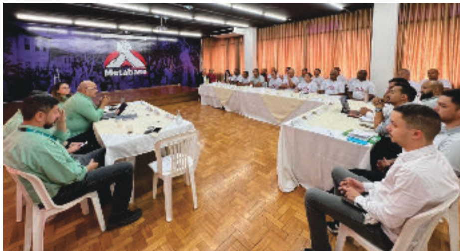
Primeira reunião entre Vale e sindicato para ajustar proposta azedou