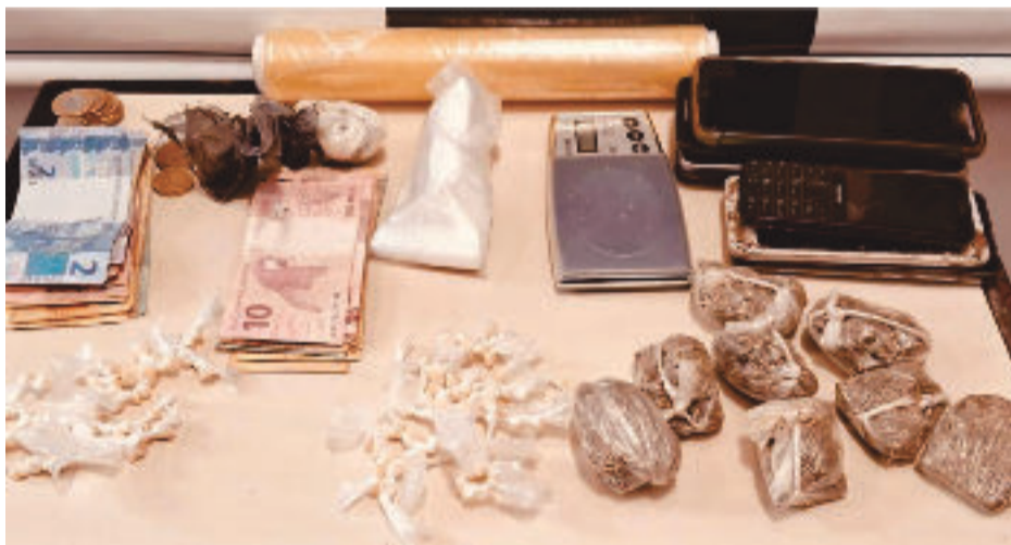
Com os investigados, foram encontrados réplica de arma de fogo, espingarda calibre 36 e cartuchos intactos

nas residências dos envolvidos, inclusive uma balança de precisão, possivelmente utilizada para pesagem de drogas. Os policiais apreenderam mais de R$ 4 mil, que foram encontrados em posse dos investigados, em notas trocadas.