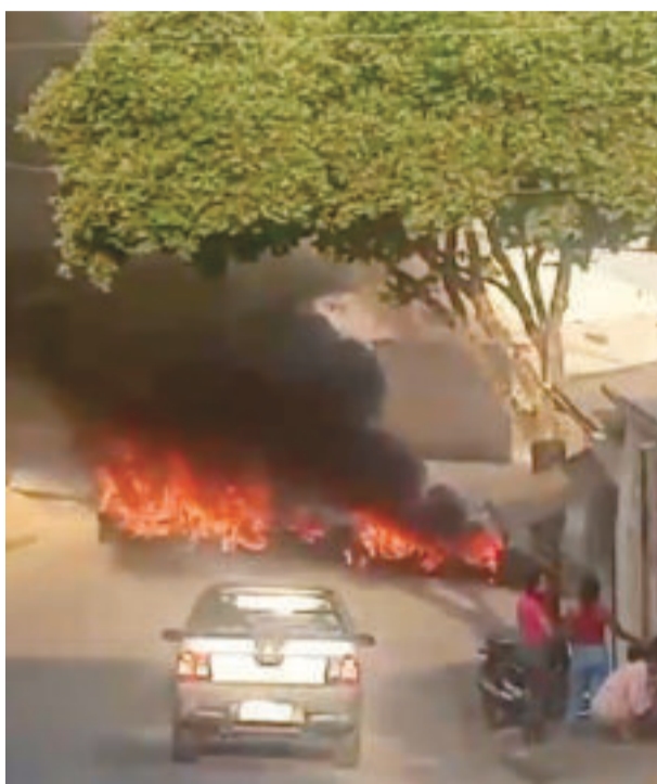
Em protesto pela falta d'água, moradores do Nova Vista fecharam rua no fim do último mês

No município, onde as reservas naturais são motivos de grande preocupação e crítica junto ao empresariado, o Saae, por meio de sua assessoria, informa ainda que para garantir o abastecimento, a rede hídrica está passando por obras de modernização. Redes construídas com materiais antiquados e muitas das vezes enferrujadas, estão sendo substituídas. São obras que, segundo anuncia o governo, eliminam vazamentos e reduzem drasticamente o desperdício. Um exemplo citado é a obra realizada na avenida Carlos Drummond de Andrade, Penha, onde foram substituídos cerca de 56 metros de rede de água. “No