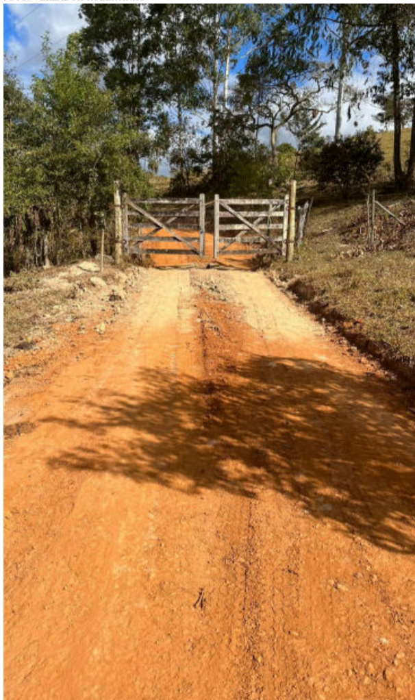
Estrada recuperada seria exclusiva para acesso ao sítio de sobrinho do prefeito

Diante da desconfiância, o vereador ficou de ir comprovar as denúncias pessoalmente para tomar as devidas providências, as quais ele disse entender que estão