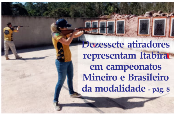
Dezessete atiradores representam Itabira em campeonatos Mineiro e Brasileiro da modalidade - pág. 8