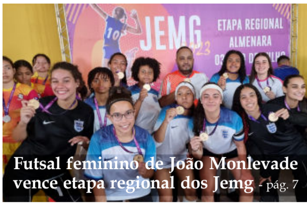
Futsal feminino de João Monlevade vence etapa regional dos Jemg - pág. 7