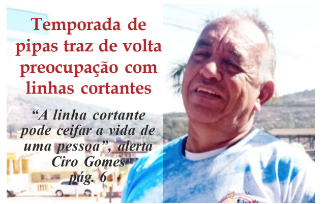
Temporada de pipas traz de volta preocupação com linhas cortantes