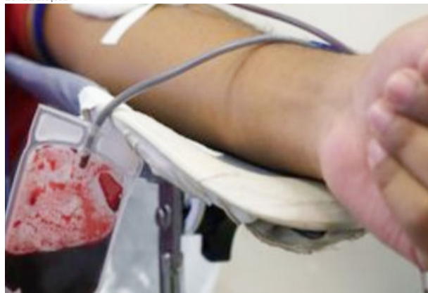
O serviço contará com a cooperação da Hemominas

cadastrados pela a ONG Doe Vida, que atualmente proporciona a coleta de sangue em Belo Horizonte. Além da segurança e melhoria das condições para os doadores voluntários do município e das cidades próximas, a expectativa é de que com a instalação de um posto de coleta de sangue em Itabira aumente a oferta não só de sangue, mas também