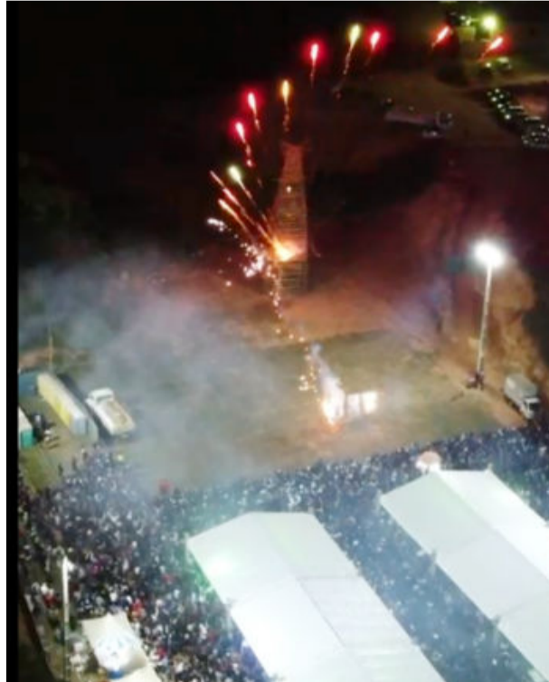
Além dos festejos religiosos, haverá a tradicional festa social e queima da fogueira no campo

festividades começam às 15h, com a alvorada e repiques do sino, queima de fogos e procissão com a imagem da santa. As festividades religiosas encerram o dia com marujada.