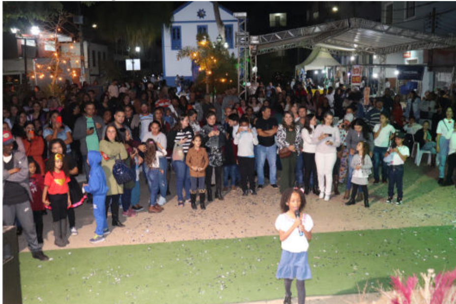
Mais de 200 alunos arrancaram sorrisos e aplausos do público