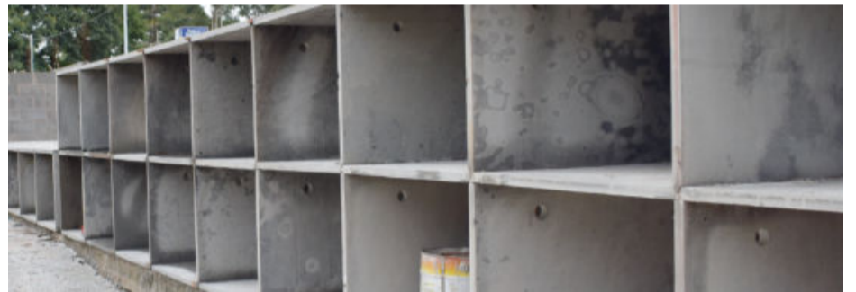
Itabira teria pago R$ 3 mil a mais por cada urna. Além de pagar mais caro, o contrato incluiu alguns acessórios desnecessários, aponta denúncia

Mais informações: “ ofolhapopular.com.br ”