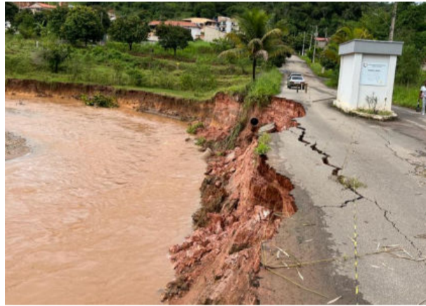
Tubos da mineradora passam próximo a erosão já recuperada pela Prefeitura no União