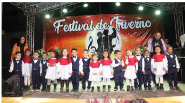
Alunos do Centro Municipal de Educação Infantil (Cmei Turma da Mônica) após bela apresentação