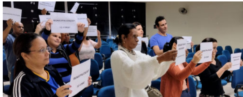
Impactos da municipalização serão discutidos em audiência pública

A Câmara Municipal de Barão de Cocais irá realizar no dia 15 de agosto, às 18h, audiência pública com o objetivo de discutir os impactos do processo de municipalização das escolas estaduais na cidade. A iniciativa foi viabilizada por meio do projeto de resolução nº 07/2023, aprovado por unanimidade na reunião ordinária, realizada no dia 13 deste mês.