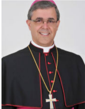
Dom Marco Aurélio estará na cidade dia 18