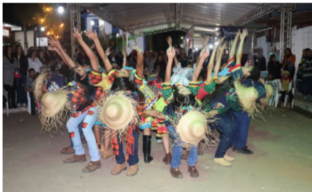
Show de coreografia e sincronismo dos alunos da Escola Estadual Luiza dos Santos Ferreira

sentações. “Eu fico torcendo para que cada apresentação seja um sucesso. Nos dedicamos muito estes dias para que nossos estudantes brilhassem e estou radiante com o resultado”, disse.