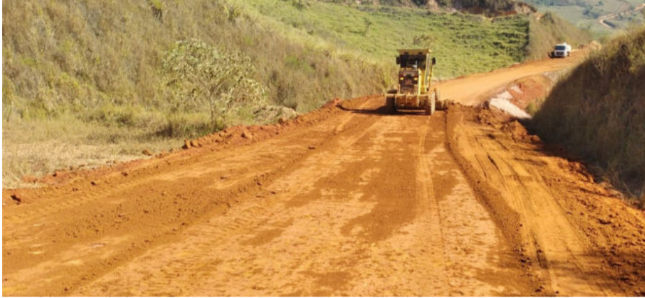
Estrada de acesso à comunidade do Quebra sendo recuperada pela Prefeitura, mesmo a contra-gosto da Anglo American

trução de vias de minerodutos. Com o último período chuvoso, as estradas sofreram com grandes erosões que bloquearam a passagem de acesso. Ele disse que a Prefeitura comunicou o problema à mineradora e como não teve retorno, iniciou uma obra por conta própria.