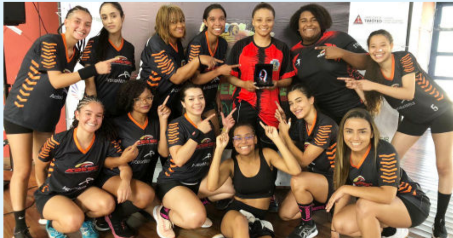
Equipes de handebol feminino de João Monlevade

de Handebol Masculino e Feminino, que pela primeira vez será realizado na cidade, e o Campeonato Mineiro de Handebol Adulto, a maior competição de handebol do Estado. Também será a primeira vez que Monlevade disputará esse torneio.