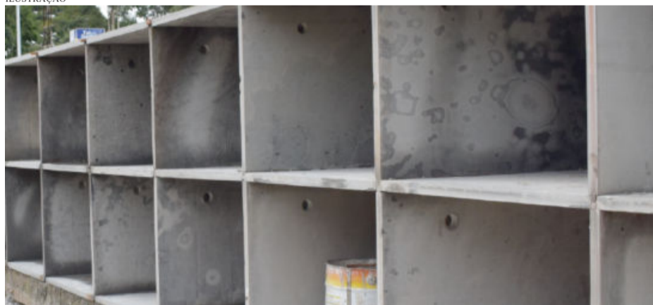
Conforme denúncia, Itabira teria pago R$ 3 mil a mais por cada urna