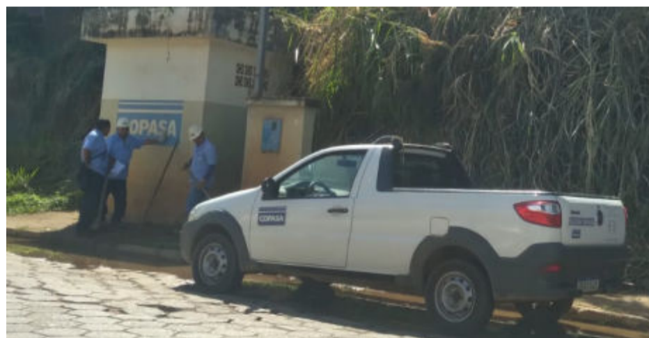
Servidores da Copasa em Santa Maria: nas duas cidades o contrato de concessão está vencido desde 2015

Mais informações no “ ofolhapopular.com.br ”.