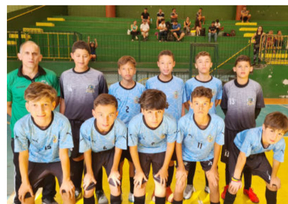
A partida de sábado é a segunda da equipe na competição

A equipe de futsal masculino sub-13 da Prefeitura de João Monlevade, em parceria com o Real Esporte Clube, vai receber o time do Minas Tênis Clube, de Belo Horizonte, neste sábado (13). O jogo, válido pelo Campeonato Metropolitano de Futsal 2023, acontece às 15h no Real Esporte Clube.