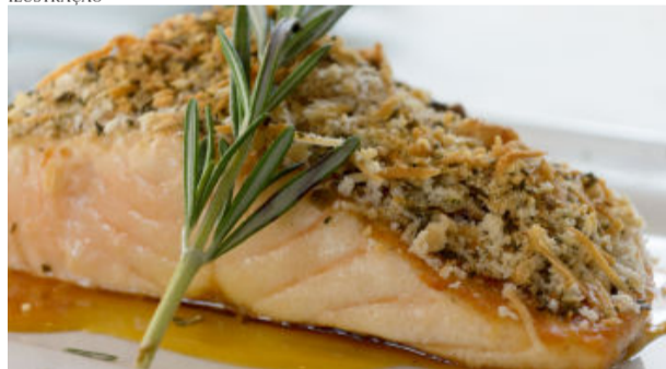
Dois tipos de salmão; com cheddar e em crosta compõem os jantares lançados por verba pública

a Prefeitura maquiou e omitiu informações, divulgando que o valor da licitação é de R$ 1,4 milhão e que “no credenciamento, apenas 2,6% são para refeições especiais e 97,4% de lanches e marmitex”. Na verdade, foram licitados para compra de marmitex cerca de R$ 45 mil e para lanches, R$ 558.667,00, contendo salgados variados (folheados, coxinhas, pastéis, barquetes, empadas, sanduíches naturais (atum, frango),