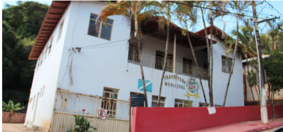
Prefeitura de São Sebastião do Rio Preto: morador irá formalizar denúncia

o controle de ponto de todos os servidores e todos cumprem a carga horária definida por lei. Esse tipo de denunciamento sem fundamento perpetrado pela oposição ao