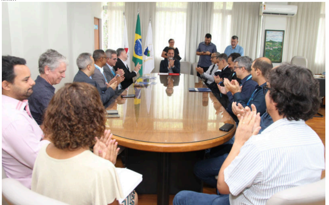
Financiamento foi assinado durante cerimônia na manhã de sexta-feira (10) em Itabira

Os recursos do Finisa só podem ser usados para os investimentos apontados na proposta entregue pela Prefeitura à Caixa. O dinheiro será usado para infraestrutura de vias urbanas e rurais; expansão e melhoria da iluminação pública; ampliação e construção de equipamentos e unidades esportivas e de lazer; e a remodelação e asfaltamento da estrada que interliga os distritos de Ipoema e Senhora do Carmo, cuja licitação foi publicada no início deste mês. O prazo para execução dos projetos é de 24 meses, com prazo de 120 meses para pagamento do financiamento, incluindo 24 meses de carência.