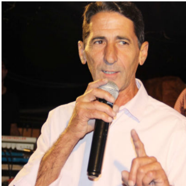
Prefeito Ronaldo Sá destaca que uma de suas metas é o avanço do ensino no município

Agapito de Sá (PL), conta que a educação de qualidade segue sendo sua principal meta de governo. “Quando assumimos a Prefeitura, há seis anos, traçamos metas para transformar o ensino de nossa cidade. E graças ao empenho da equipe e total apoio da gestão municipal, estamos tendo bons resultados, principalmente quando se trata da base, com mais atenção aos anos iniciais pois, entendendo que as primeiras séries escolares dizem muito sobre a evolução dos alunos nas etapas seguintes”, avalia Ronaldo Sá.