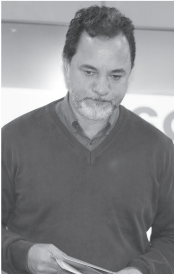
Governo do prefeito Marco Antônio Lage não acredita que houve decréscimo de população

Fazenda e Procuradoria Jurídica, protocolou junto ao TCU documento solicitando cumprimento da lei complementar 165/2019, mantendo o coeficiente do município