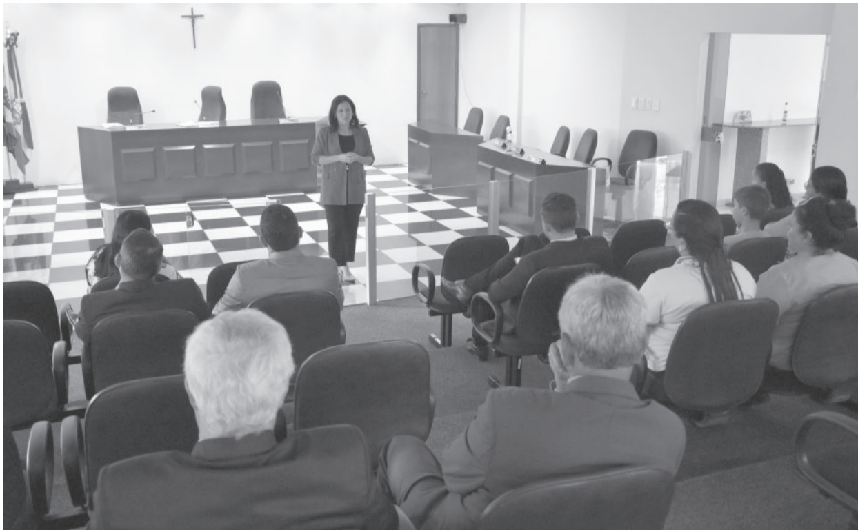
Após apresentação, o projeto foi aprovado por unanimidade em primeira votação

rantir o acesso e a permanência dele na escola. A formação dos profissionais e a educação inclusiva vão romper com esse modelo de exclusão e segregação”, disse o vereador.