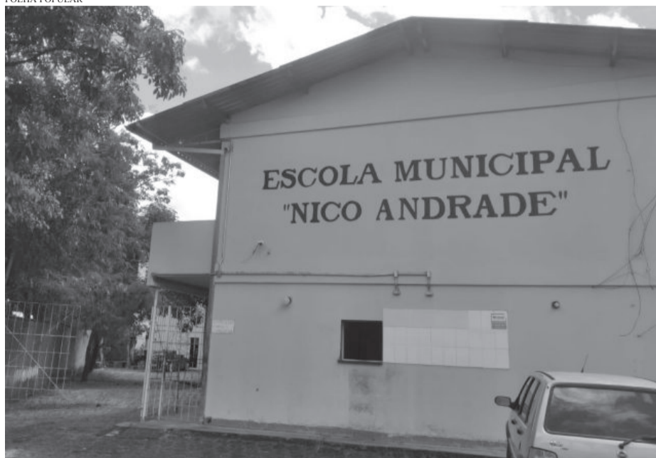
No bairro João XXIII a Escola Municipal Nico Andrade, e anexo Niquinho, estão aguardando reforma geral

toner, cartuchos, álcool e outros que favorecem todos na sala de aula. Esses itens fazem parte do custo da operação das escolas. Se alguma lista apresentar desconformidades, os pais devem pedir esclarecimentos à escola e essa deve oferecer justificativa adequada ou retirar o item da lista.