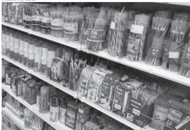
Antes de sair às compras, verifique quais os itens que restaram do período letivo anterior

de marca específica ou determinar a loja ou livraria onde o material deve ser comprado”, destaca Rosa Barros.