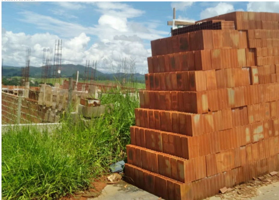
OBRA PARADA: A Construção civil foi a que mais demitiu entre janeiro e novembro de 2022