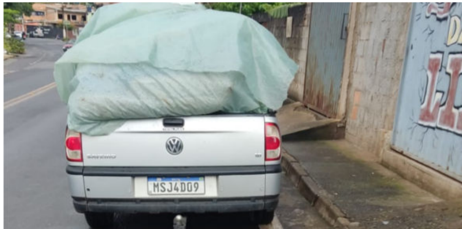
Um veículo auxilia na busca de móveis, basta ligar no 98610-6994

tenso de trabalho para ajudar as possíveis vítimas das chuvas.