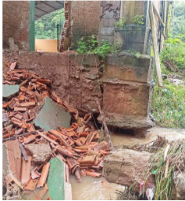
Piso da quadra coberta

As regiões rurais foram as mais atingidas, deixando a população com dificuldade de locomoção. A Prefeitura registrou pelo menos queda de três pontes de acesso à zona rural.