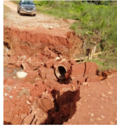
Acesso ao Água Fria

trada de acesso à localidade de Água Fria. A forte enxurrada levou a ponte que completa o acesso sobre o córrego na localidade. O acesso ao