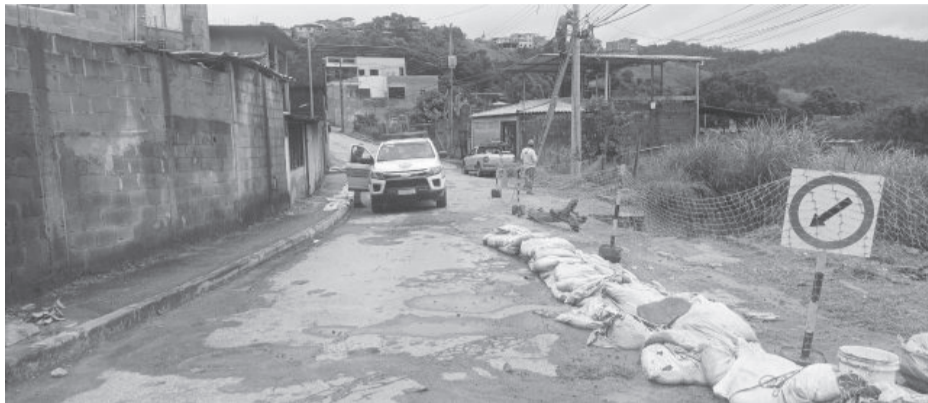
Rua Geraldo de Paula, no bairro Laranjeiras, segue em meia pista

A Prefeitura de João Monlevade, juntamente com a Defesa Civil Municipal, trabalha dia e noite para atender e dar assistência à população mediante os estragos causados pelas fortes chuvas que caíram nos últimos dias em toda a região.