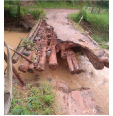
Acesso ao Santana

córrego das Rosas também foi comprometido com a queda da ponte. As chuvas ainda derrubaram a ponte que dá acesso ao Santana.