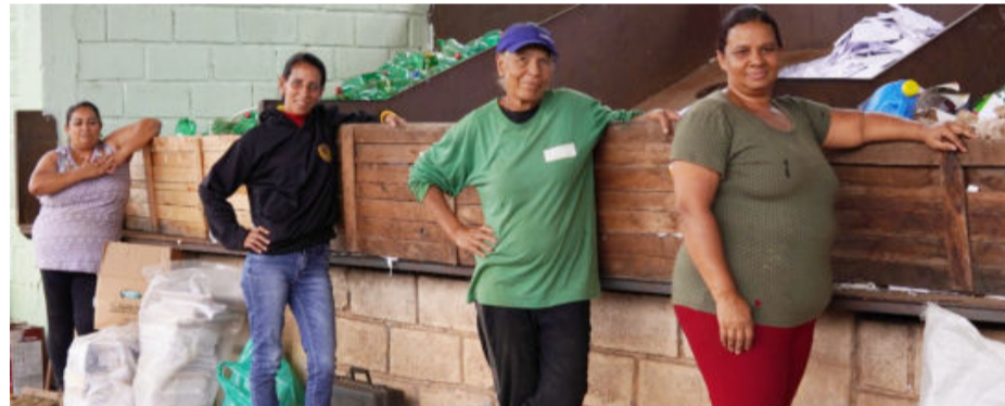
A Aserbac conta com seis associadas e funciona desde 2007 em Barão