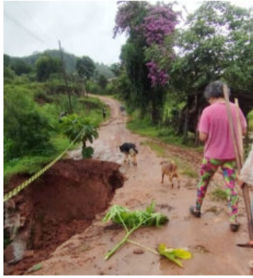
Ponte Córrego das Rosas