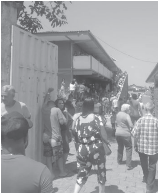
Fila para votar no antigo prédio de escola no Bela Vista. Cerca de 40 mil votos foram dados a deputados federais de outras cidades

tor vota em um determinado candidato, mesmo se o escolhido não for eleito, aquele voto vai contar para eleger outro candidato daquele partido ou da coligação.