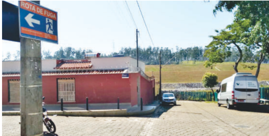
Número de casas a serem desabitadas continua a subir

continuam depois dessa definição, aumentando a quantidade de remoções residenciais para 13.