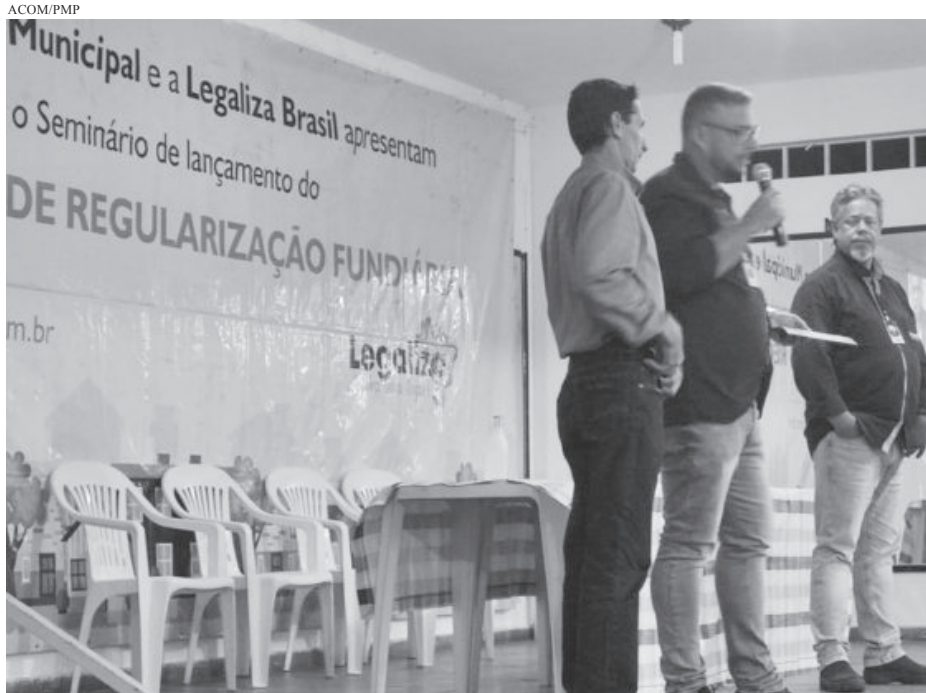
O processo de regularização fundiária no Município teve início com a realização de um seminário

O processo de regularização fundiária no Município teve início