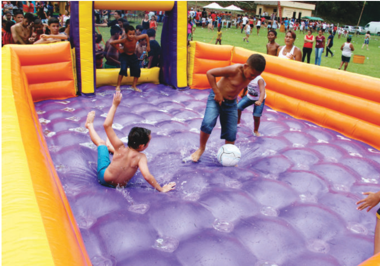
Evento em 2019, antes da pandemia, contou com quadra de futebol de sabão, diversos brinquedos infláveis e guloseimas

no Ronaldo Agapito de Sá é promover um momento de lazer e diversão para as crianças, em companhia da família e amigos.