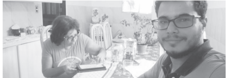
Agente da Legaliza Brasil durante visita domiciliar e cadastro de imóvel

trados”, esclareceram a Prefeitura e a Legaliza Brasil, por meio de nota à imprensa.