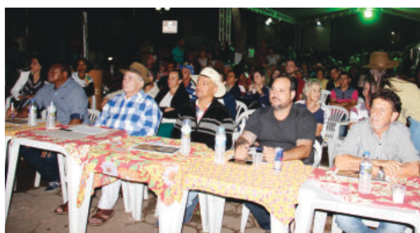
Disputa acirrada na última edição: Jurados observam e julgam as apresentações dos violeiros

promovidas pela Prefeitura, visando o restabelecimento da normalidade no pós-pandemia. “Passabém está promovendo vários eventos com o objetivo de proporcionar momentos de lazer e diversão para a comunidade, principalmente depois da pandemia, algo que mexeu muito com o emocional das pessoas”, disse.