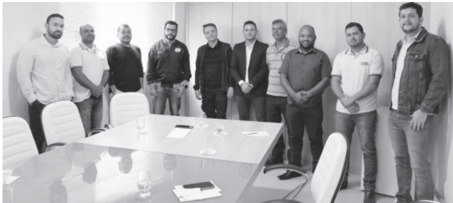
Encontro aconteceu na Câmara de Vereadores e expôs assuntos delicados

blema que atinge todo o estado de Minas Gerais, mas que ainda não tem sido uma preocupação das mineradoras.