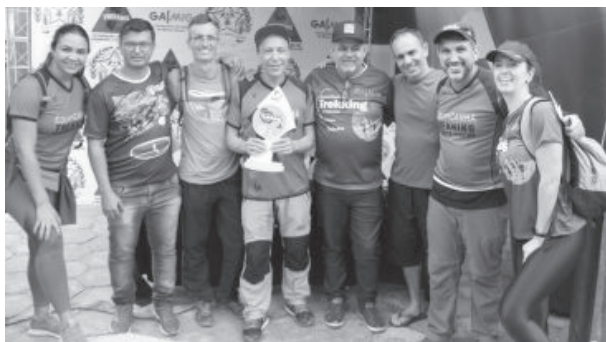
Na mais pesada das provas, a elite, a Equipicana ficou com troféu de primeiro lugar

moradores e visitantes para a prova. Por outro lado, hoje nós tivemos um encontro de gerações, com crianças, adolescentes, jovens, adultos e pessoas da melhor idade, o que nos motiva ainda mais, sabendo que estamos no caminho certo, trazendo todos para participar dos eventos esportivos, atividades que indicam o caminho do bem. Só tenho que agradecer, a única palavra agora é de gratidão por conseguirmos fazer tudo isso, proporcionar para cada um, seja morador ou visitante, um fim de semana de atividades de lazer e esporte. Espero receber todos novamente no trekking do próximo ano”, disse.