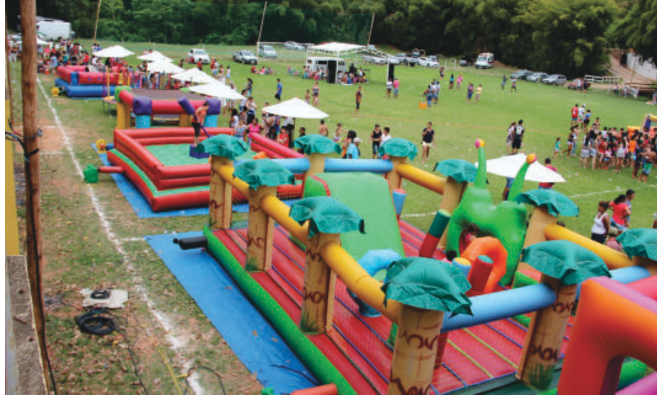
Evento em 2019, antes da pandemia, contou com quadra de sabão, diversos brinquedos infláveis e guloseimas

cho do edital de contratação da empresa organizadora do evento.