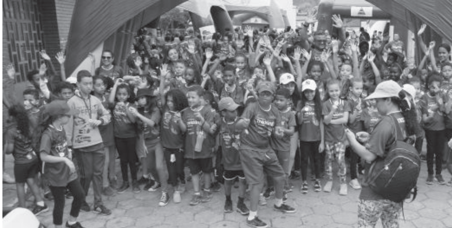
Categoria infantil após receber medalhas da Federação Mineira