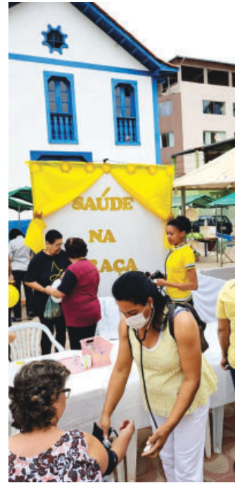
Ações de promoção de saúde e prevenção

Na oportunidade, com presença de profissionais de saúde, foram realizadas ações de promoção de saúde e prevenção de doenças como: aferição de pressão arterial, orientação nutricional, glicemia capilar, blitz educativa e promoção de atividade física. Tudo com o propósito de alertar a comunidade.