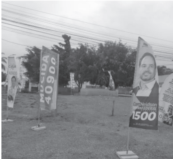
O volume de gastos divulgado pelos candidatos até agora é considerado baixo devido à amplitude estadual da campanha