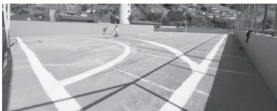
Pintura da quadra e reforma do Centro Municipal de Educação Infantil (Cmei)