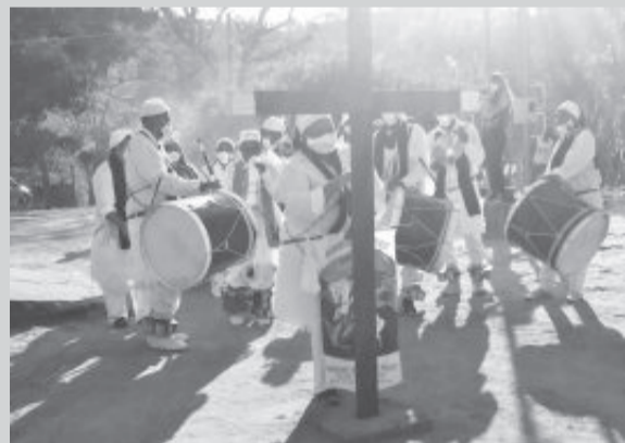
Os ritos são tradição em comunidade de São Gonçalo do Rio Abaixo

Tradição religiosa anima comunidade de Fernandes até domingo