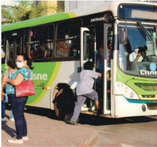
Com a medida, tarifa que poderia chegar a R$ 5,8, baixa de R$ 4,40 para R$ 4