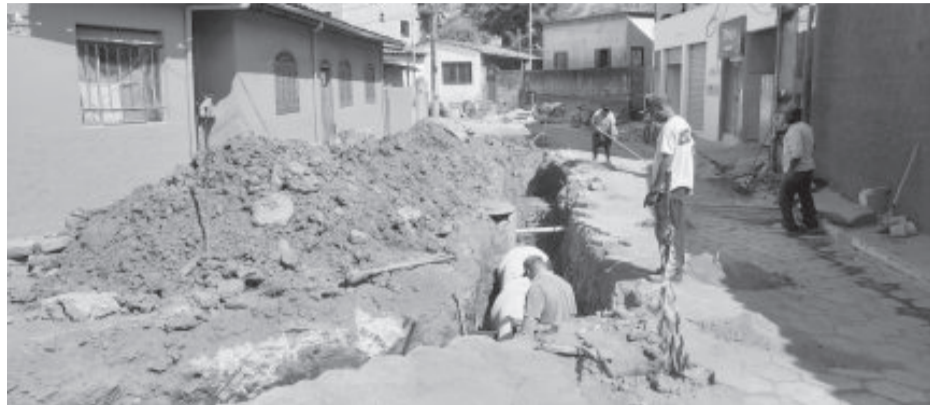
Drenagem pluvial na rua Antônio Dias, no bairro Poção