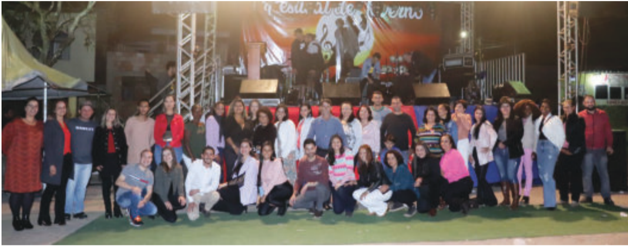
Comunidade escolar de Passabém, prefeito Ronaldo Sá e o vice Kléber Batista. Além de espectadores, montagem do evento mobilizou cerca de 300 pessoas entre educadores e alunos

A comunidade escolar de Passabém e a Prefeitura realizaram no último fim de semana, na praça São José, mais uma edição da didática Feira do Empreendedorismo e o divertido Festival de Inverno.