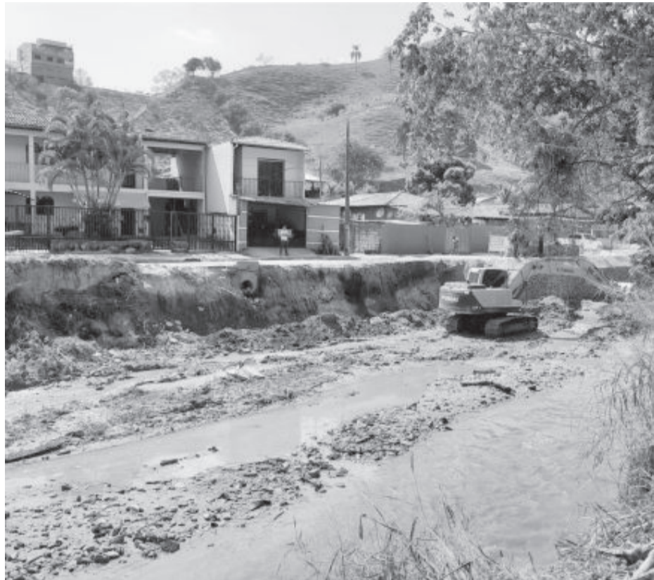
Complemento de contenção em gabião na Israel Pinheiro e limpeza do rio

A Prefeitura de Santa Maria de Itabira segue com obras de grande porte em bairros e região central da cidade.