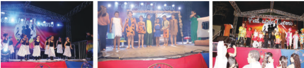
Apresentações artísticas e circenses dos alunos encantaram o público