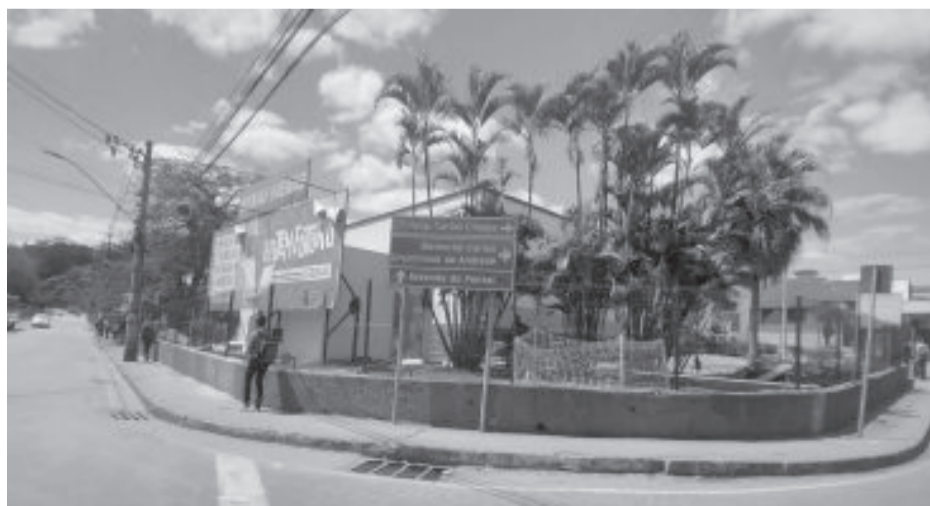
Unidade do Senai de Itabira no bairro Campestre

As vagas são para os cursos de “aperfeiçoamento profissional no atendimento ao cliente”, com 40 vagas e 20 horas de aula; “qualificação: mecânico de manutenção industrial”, com 20