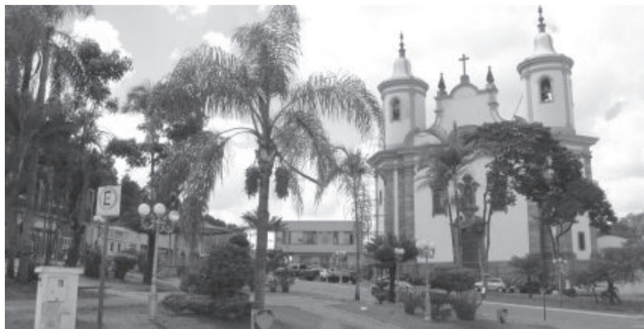
Santuário São João e ao fundo, a Prefeitura, que vai exigir da empresa vencedora R$ 186 milhões em investimentos em 30 anos

Além do contrato da atual concessionária estar vencido, a má qualidade da água e a cobrança de tarifas altas são os principais motivos para a decisão por uma nova empresa de prestação do serviço. Os moradores apresentam constantes