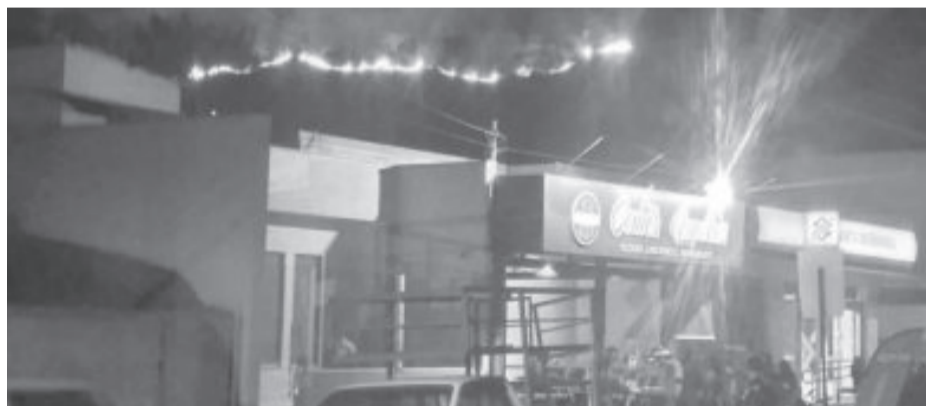
É fogo - Além de Itabira, em Santa Maria um incêndio de grandes proporções em mata na noite de sábado (27) assustou moradores

Segundo o bombeiro, já ficou comprovado que a maior incidência dos incêndios em áreas públicas e privadas é resultado de ações criminosas. De acordo com ele, as chances de um incêndio natural, mesmo em meio à seca e baixa umidade do ar, são quase zero. “Muitas vezes, esses focos começam como uma atitude irresponsável e se transformam em labaredas que matam a vegetação e animais, ameaçam ou atingem pessoas e imóveis, poluem o ar e ainda põem em ris-