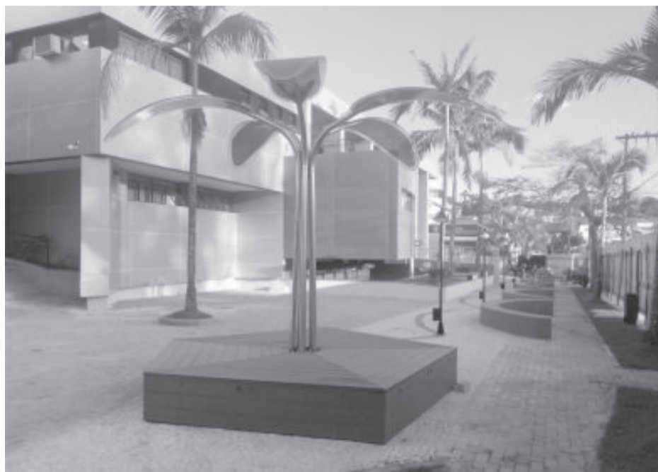
Revitalização da Câmara saltou de R$ 1,6 milhão para R$ 2,185 milhões

Segundo o texto publicado pelo portal, o denunciante afirma ter encaminhado o documento para todos os vereadores, com cópia para o Tribunal de Contas do Estado de Minas