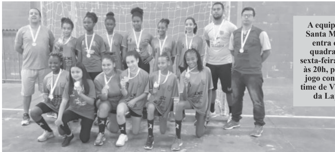
A equipe de Santa Maria entra em quadra na sexta-feira (26), às 20h, para o jogo contra o time de Virgem da Lapa

ta Maria recebe neste caso, a zonal C e a etapa final da mesma zonal.