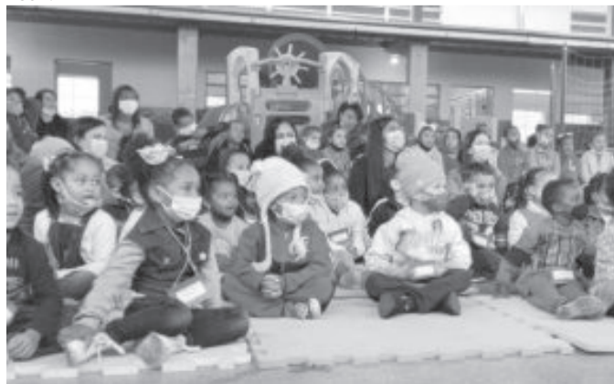
Alunos da Escola Municipal Maria Tôrres Horta