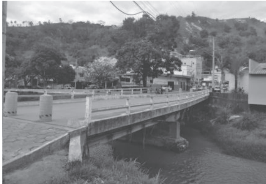
Ponte teve a estrutura condenada após enchente deste ano. Obra passou a ser a mais esperada pelos santa-marienses