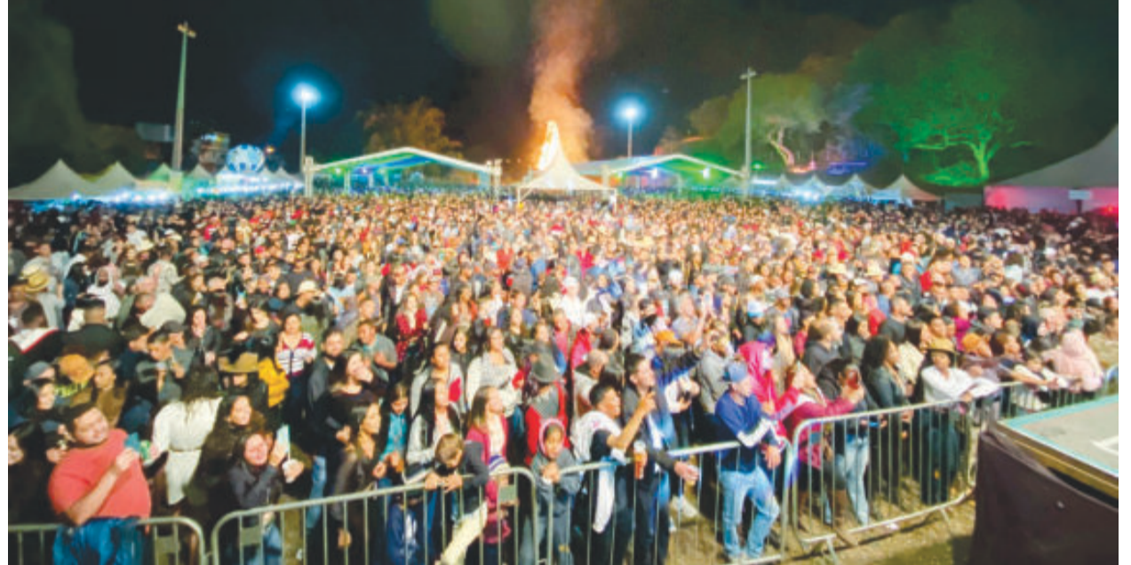
Tradicional fogueira e shows de alta qualidade atraíram público de toda a região

Veja vídeos e fotos no site ofolhapopular.com.br e facebook.com/ofolha