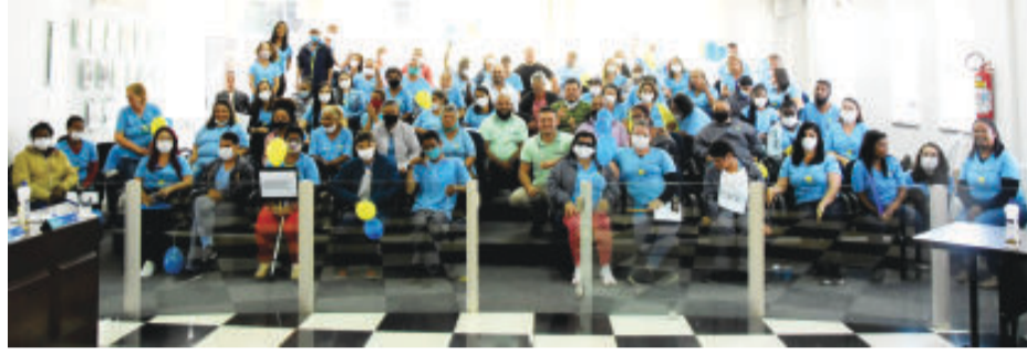
Dirigentes da entidade cobraram mais iniciativas da Prefeitura de São Gonçalo que promovam a inclusão social de pessoas com deficiência

ônibus coletivos com elevador e vans adaptadas para os usuários. Também mencionou que os vereadores irão cobrar para que as empresas localizadas no município ofereçam as mesmas oportunidades às pessoas com deficiência.