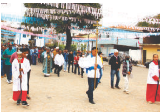
Celebrações religiosas foram encerradas no domingo (21) com procissão