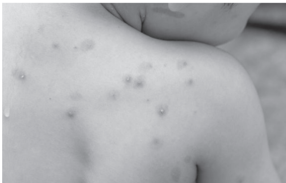
Os sintomas da varíola dos macacos são gripais. As lesões (bolhas) surgem simultaneamente

No fim de semana, a comissão teve o objetivo de tratar sobre as es-