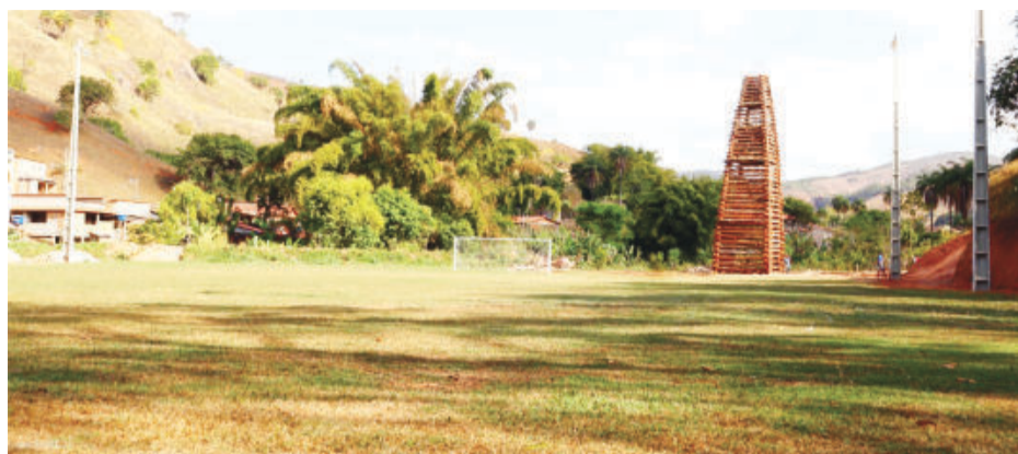
Campo foi totalmente revitalizado e ganhou iluminação

A travessia ainda recebeu novas bases, plataforma e guarda-corpos, além de instalação de