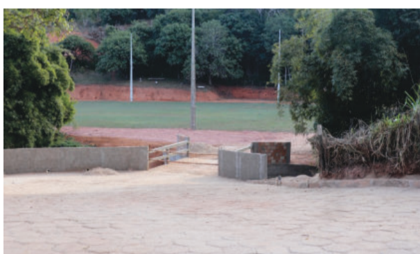
Ponte levada pela enxurrada foi reconstruída

Também em obra desde o ano passado, a reconstrução do campo de futebol da cidade está