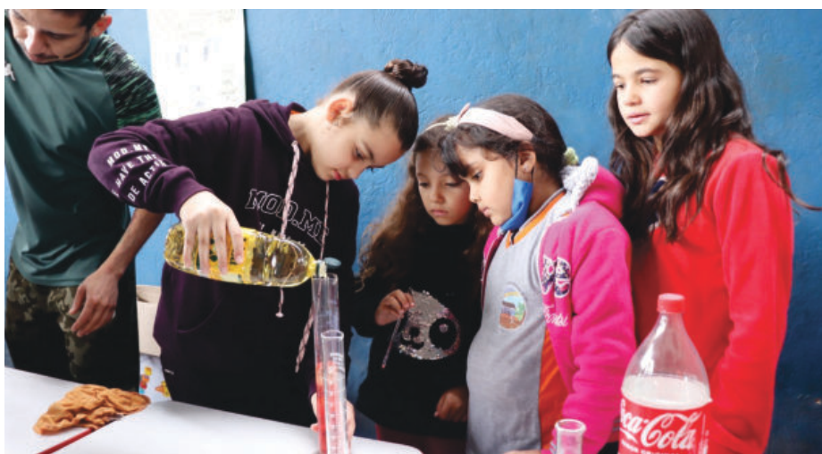
As atividades foram apresentadas pelos alunos por série das escolas Euclides Ferreira de Sá e Luzia dos Santos Ferreira

a temática a ser apresentada, busca informações científicas sobre o processo, interpreta e replica as atividades experi-