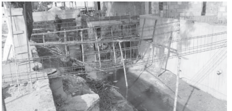
Conforme o projeto, laje terá 128 metros quadrados

As obras foram iniciadas após a construção do novo muro de contenção no córrego que passa pela região central, derrubado pelas fortes corrente-