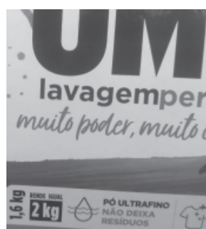
Sabão em pó reduziu 400g na embalagem, não mudou o preço e, pasmem, anuncia que rende igual a 2kg

A prática tem sido observada em alimentos, guloseimas, iogurtes, carnes processadas e produtos de higiene e limpeza, de diversos fabricantes. Entre os exemplos, o biscoito Nesfit com aveia teve redução de peso de 20%;