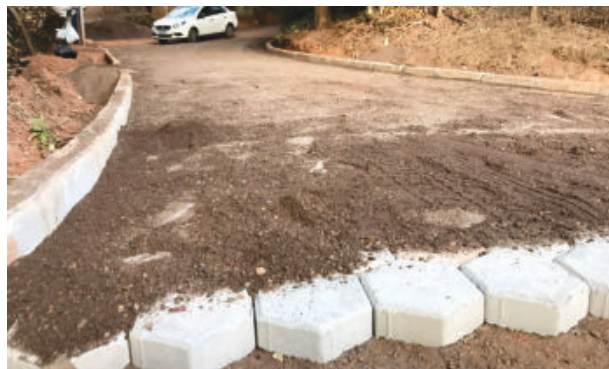
Calçamento na comunidade Flor do Vale

Zonas urbana e rural estão recebendo diversas obras da Prefeitura