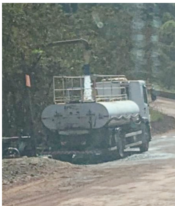
Caminhão-pipa coletando água imprópria para o consumo

Oportunidade: Itabira abre edital público para cadastrar empresas parceiras - pág. 6