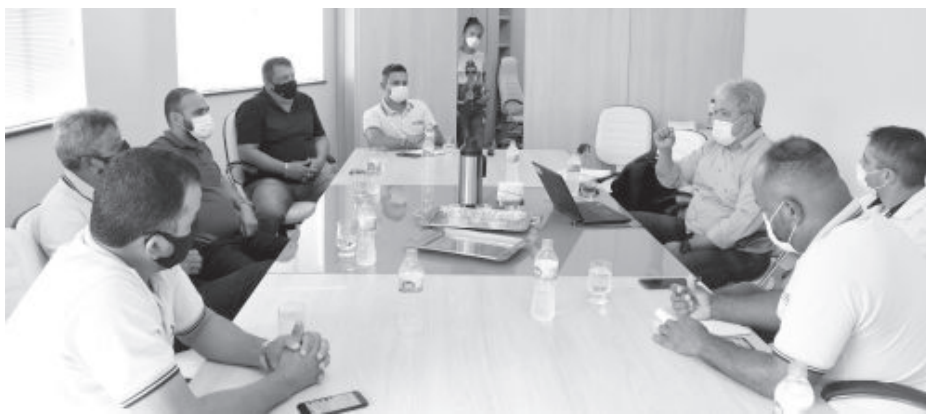
Além de criticar postura da empresa, os vereadores pediram mais oportunidades de primeiro emprego para jovens são-gonçalenses

Ele também esclareceu que a Consórcio Mina Fábrica e as demais terceirizadas foram aciona-