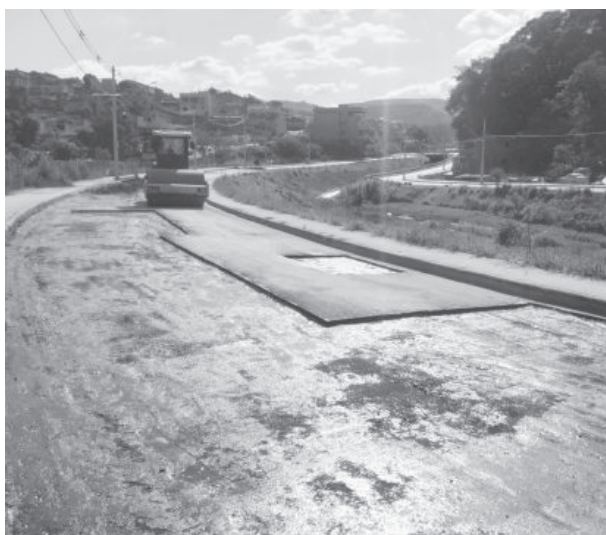
Obra de quase R$ 40 milhões: a parte que cabe à Terramil, a empresa está refazendo

Os opositores cobram comprometimento do prefeito Marco Antônio Lage (PSB) com a correção das degradações ocorridas desde que a obra foi entregue ao Município e manutenção da qualidade da via. Segundo argumentam, cabe ao prefeito do momento zelar pela cidade e tomar as providências cabíveis e garantir o funcionamen-