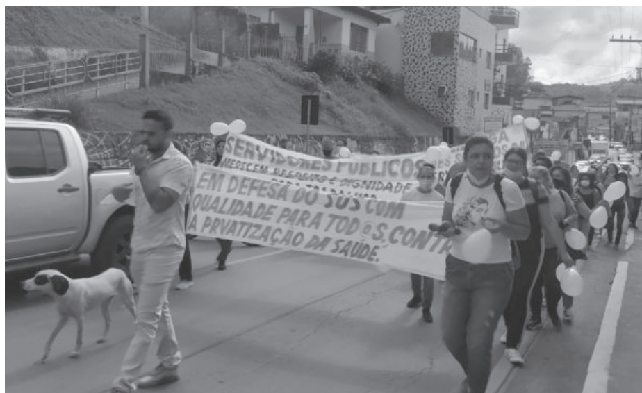
No dia 6 de abril os servidores fizeram passeata com destino à Prefeitura

Em ofício protocolado na quinta-feira (14), a Câmara Municipal explica que a realização de