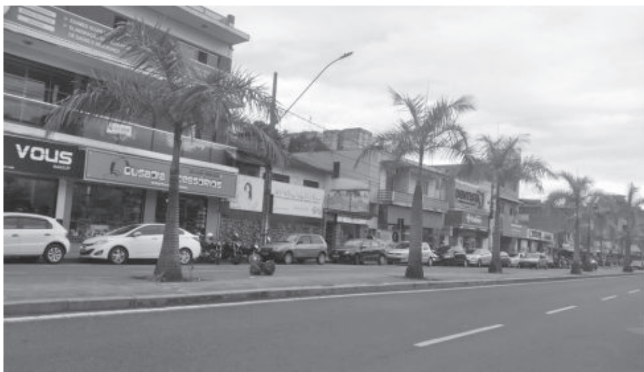
Avenida João Pinheiro, um dos principais corredores comerciais da cidade. Conforme a Serasa, o débito do itabirano chega a R$ 101 milhões