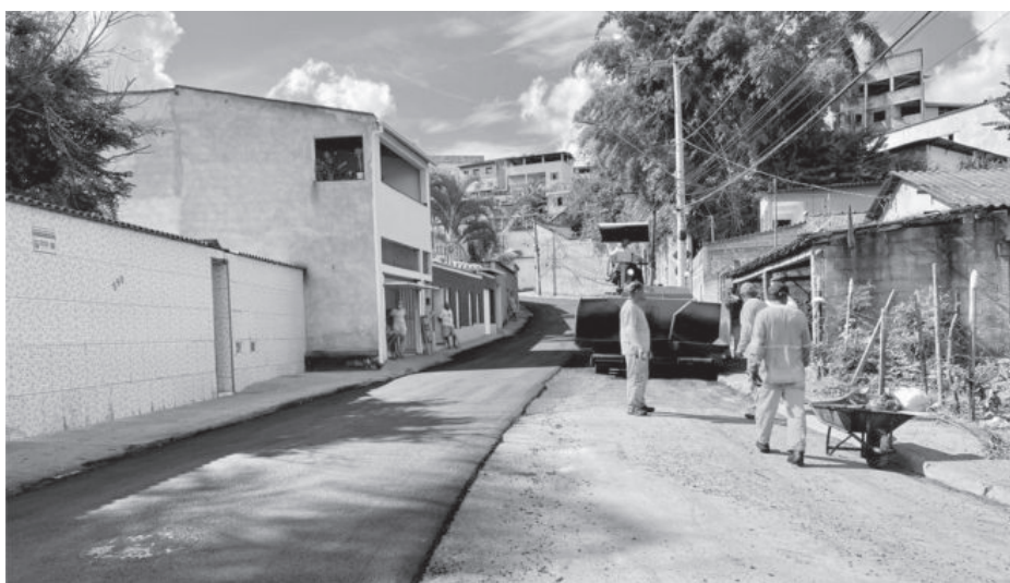
Obras tiveram início em novembro de 2021. Chuvas e minas de água atrasaram a conclusão dos serviços