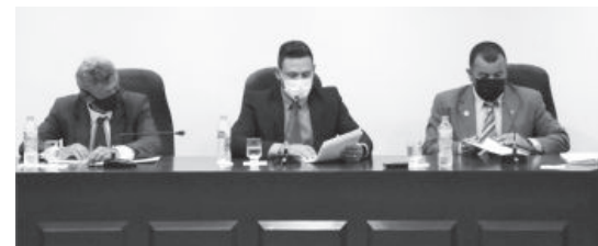
Membros da Mesa Diretora

Na quinta-feira (17), foi realizada a quinta reunião ordinária da Câmara Municipal de São Gonçalo do Rio Abaixo, na qual foram aprovadas 25 indicações em única discussão e votação. O extrato completo das indicações pode ser visto acessando o site do Legislativo são-gonçalense: