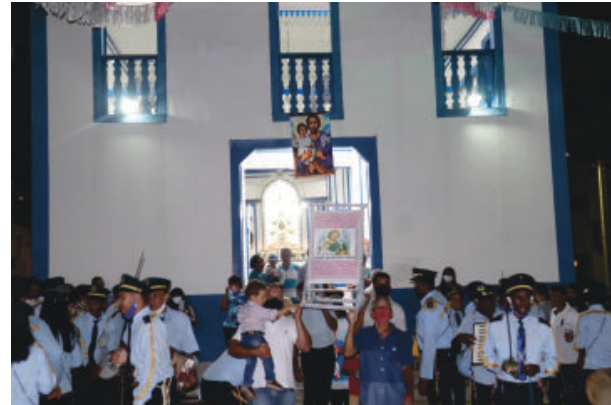
Apresentação da Marujada Nossa Senhora do Rosário, da comunidade da Bolívia

A hospitaleira e carismática cidade de Passabém recebeu no feriado do dia 19 de março grande público para festejar o padroeiro, São José, e o aniversário de 59 anos de emancipação política.