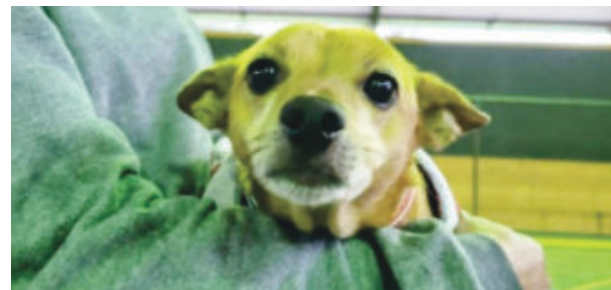
O veículo que atende os pets foi reformado com recurso do Ministério Público de Minas Gerais

O veículo foi doado pela Associação Regional de Proteção Ambiental de Divinópolis (Arpaii) e reformado com recurso