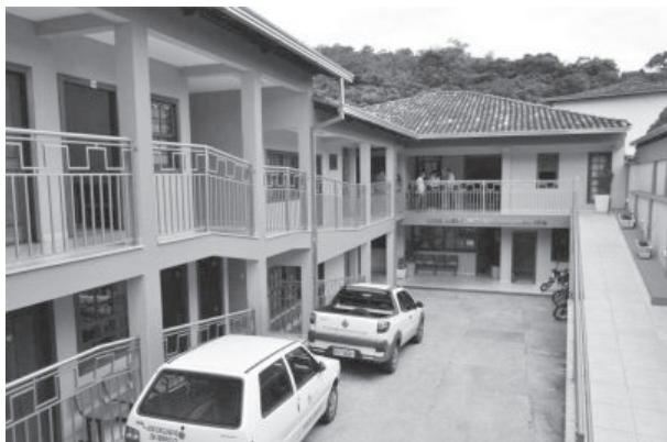
Anexo da Prefeitura: “falta diálogo”, diz sindicato

De acordo com a sindicalista, a secretária de Educação não aceita diálogo nem com a comunidade escolar e nem com o sindicato. O único jeito do sindicato conseguir alguma informação é através de mandado de segurança judicial, o que também é feito