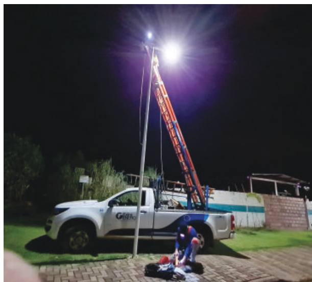
Serviço pode ser solicitado pelo 08006662001 ou via WhatsApp (31) 99750 8166