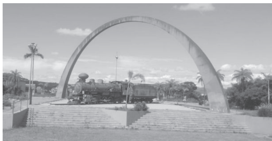
A desconfiança em relação ao arco ganhou as redes sociais após morador fazer um vídeo mostrando a base da estrutura tomada por ferrugem

tombado pelo Patrimônio Histórico, a Prefeitura já iniciou os trâmites para o processo de restauração, que precisará ser feito por uma empresa especializada. A ação está em andamento sob os cuidados da Secretaria Municipal de Desenvolvimento Urbano, por meio da Diretoria de Patrimônio Histórico, e envolverá também a reforma da locomotiva e a construção de uma guarita no local.