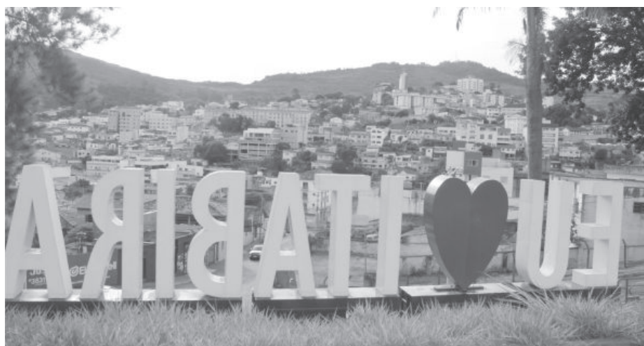
Custo de vida em Itabira segue sendo o mais caro da microrregião

A nota dizia ainda que “as alterações nas alíquotas do Imposto Predial e Territorial Urbano (IPTU), cumprem uma determinação do Tribunal de Contas do Estado de Minas Gerais (TCE/MG). Foi assinado um Termo de Ajustamento de Gestão (TAG) ainda em 2019 e a nova tabela deveria ser apre-