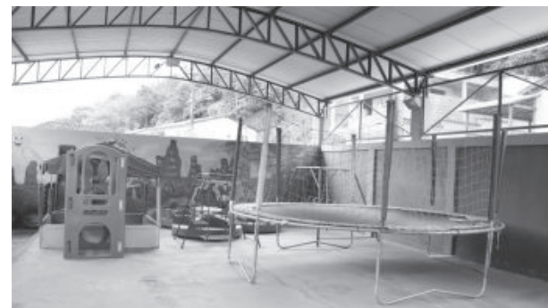
Espaço coberto para atividades e recreação dos alunos do ensino infantil