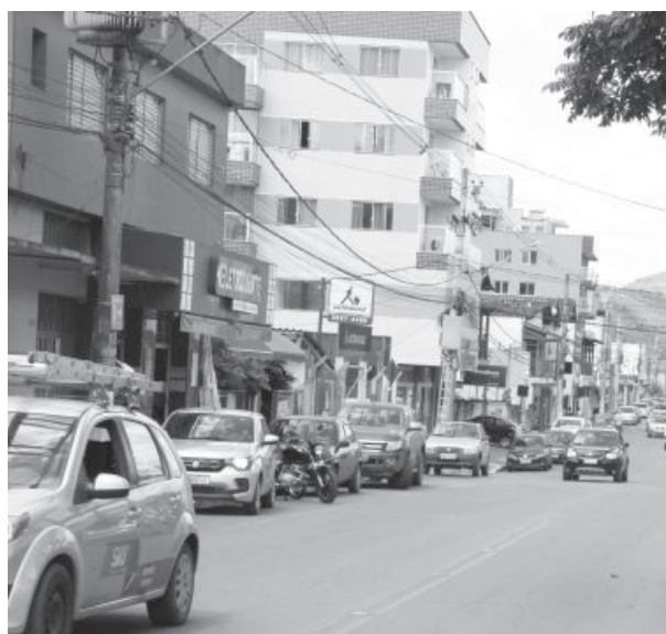
Em 2022, donos de imóveis ou inquilinos pagarão o tributo com 10% de reajuste