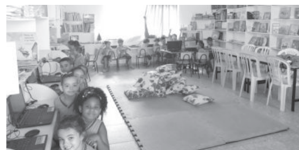
Crianças na biblioteca do Cmei da Mônica

Os resultados da avaliação externa da aprendizagem dos alunos ainda não foram mensurados devido à pandemia, contudo, as avaliações internas da escola apontam avanços significativos, podendo afirmar que todos os alunos do 3º ano do ciclo da alfabetização estão alfabetizados e letrados.