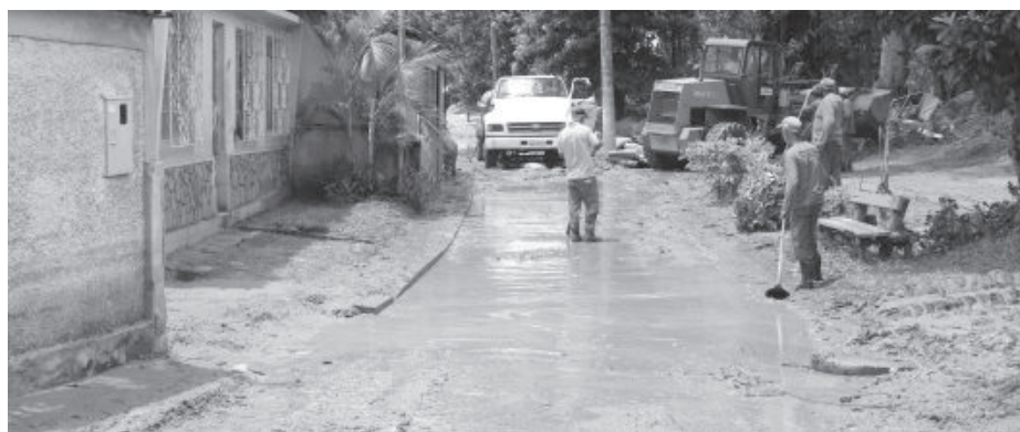
Chuvas de janeiro deixaram rastro de destruição em bairros de Monlevade

Para ter acesso ao benefício, os proprietários de imóveis atingidos por enchentes ou alagamentos deverão protocolar seus requerimentos, pleiteando a isenção, no prazo máximo de 60 dias, a contar do ocorrido. As situações serão le-