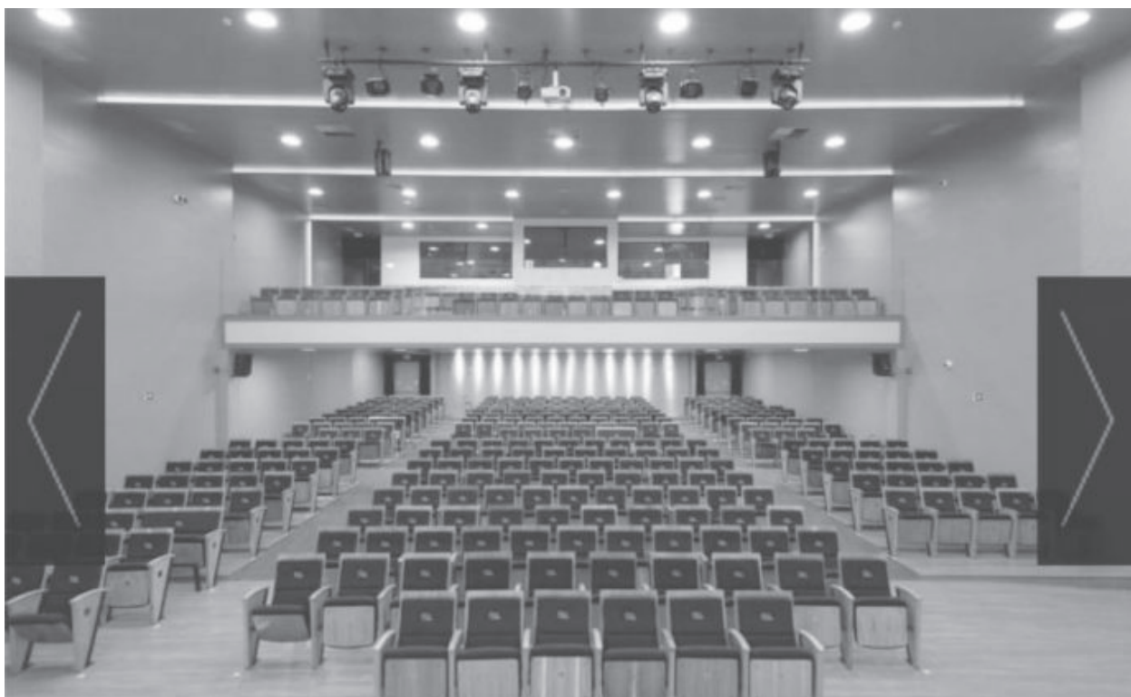
Prefeitura construirá o Centro Municipal de Educação para o desenvolvimento de atividades como cinema, teatro e apresentações artísticas e culturais diversas - Imagem do projeto

A Prefeitura garantirá todos os materiais escolares, alimentação e uniforme para os alunos, sendo que as refeições serão elaboradas com orientação de nutricionistas.