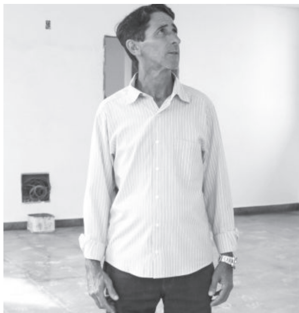
Prefeito Ronaldo Sá: “oferecer um ensino de qualidade, com foco na base, é uma das principais e mais importantes metas da nossa administração”