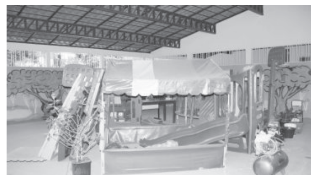
Área de recreação da Creche Municipal