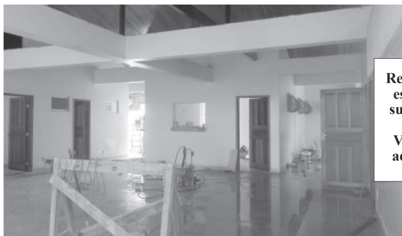
Reforma na escola do subdistrito de Boa Vista está adiantada