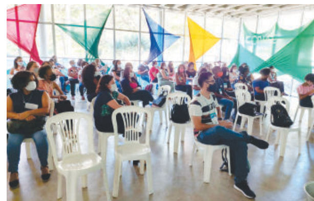
A plenária final foi realizada em novembro

Oito educadoras da rede de ensino de Passabém, Santa Maria de Itabira, São Sebastião do Rio Preto e Santo Antônio do Abaixo, juntas, vão representar a região na Conferência Regional de Educação, a ser realizada em Belo Horizonte.