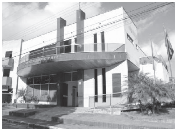
Reuniões estão abertas ao público, a partir das 18h