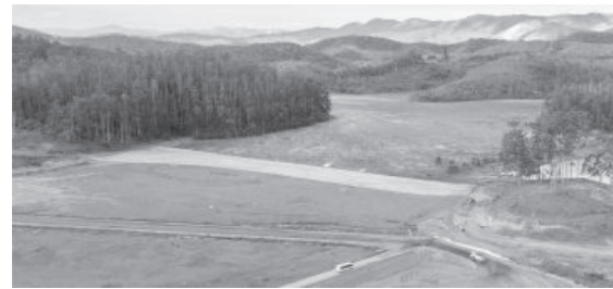
Dique 5 da barragem Pontal, em Itabira perdeu suas características a montante

A Vale informou na manhã de segunda-feira (29) que as obras de descaracterização do dique 5 da barragem Pontal, em Itabira, estão concluídas. A estrutura perdeu suas características de barragem a montante e não exerce mais a função de armazenar rejeitos. O trabalho foi executado com a adoção dos protocolos de prevenção à Covid-19.