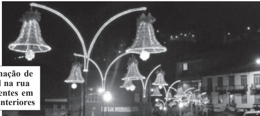
Iluminação de Natal na rua Tiradentes em anos anteriores

onado em fibra de vidro complementa os enfeites no local. O elemento tridimensional deve ilustrar o Noel com um dos pés sobre uma caixa de presentes, uma das mãos erguidas e um saco de presentes nas costas.