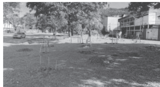
Iniciativa visa arborizar a cidade com espécies atípicas

Árvores frutíferas como atemoia, uvaia, cambucá, pequi, rambotã, cambuci, cacau e araticum estão sendo plantadas em João Monlevade, no bairro Baú, numa área verde em frente à Associação dos Trabalhadores da Limpeza e Reciclagem de Materiais Recicláveis. As espécies não existiam na cidade.