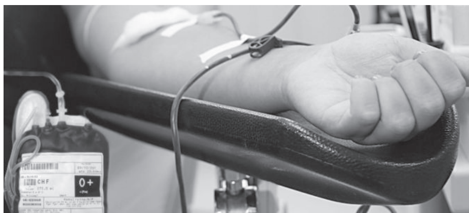
O posto de coleta deverá ser no Hospital Municipal Carlos Chagas

“Vamos fazer algo de alto nível, de acordo com