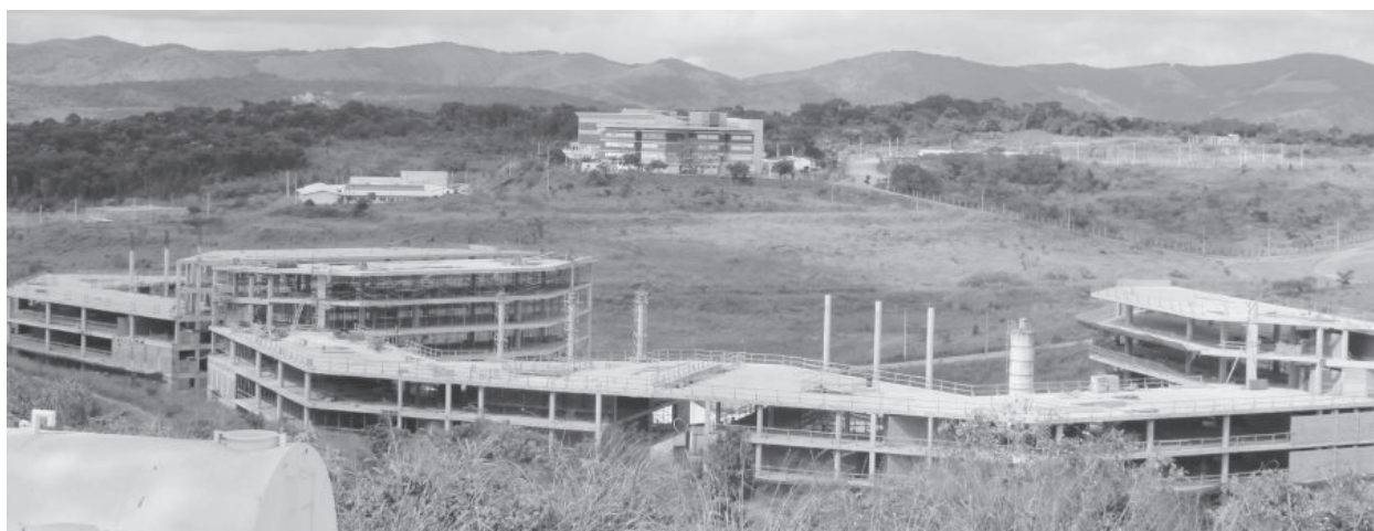
Ao fundo, laboratório e prédios e concluídos; reinício das obras dos três novos, só após aditivo

Procurada pelo Folha Popular , a assessoria da Prefeitura informou por meio de nota que o problema estava sendo resolvido, embora o prefeito Marco Antônio Lage (PSB) não