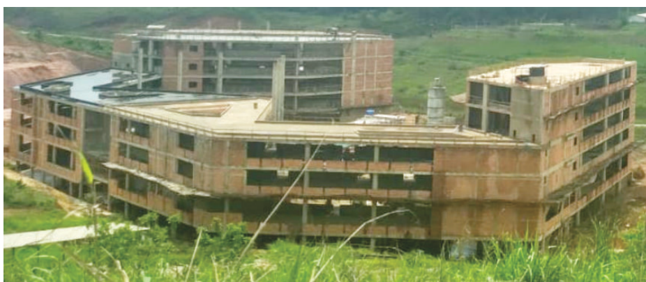
Reinício das obras dos três novos prédios, só após assinatura de aditivo

As obras de ampliação do campus da Unifei em Itabira foram suspensas ainda no primeiro semestre, com as empreiteiras apontando divergência entre os serviços e os contratos. Além de exigir a inclusão de dispositivos para regularizar a obra aos contratos, as contratadas queriam repectuação dos valores.