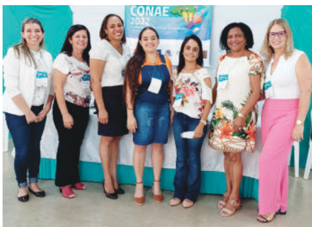
Educadoras de Passabém, Santa Maria, São Sebastião e Santo Antônio envolvidas no processo

realizada em novembro na Fundação Francisco de Assis, em Santa Maria de Itabira. Com o objetivo de discutir ações para o desenvolvimento da educação desde o ensino infantil ao superior. O evento é realizado a cada quatro anos.