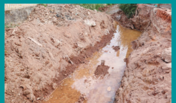
Serviço termina no fim deste mês - pág 5

Muro evitará desmoronamento de encosta em Passabém