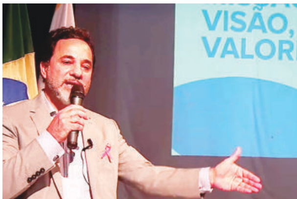
Prefeito apresentou Plano de Metas Itabira Agora, com as principais ações entre 2021-2024

Conforme a apresentação, o plano é produto do planejamento municipal, com previsão no artigo 99-A da Lei Orgânica Municipal. Para elaborar o documento, foram feitas discussões com todos os órgãos da Prefeitura a fim de definir os indicadores e as metas que permitirão o monitoramento da evolução dos resultados durante os quatro anos. Ao todo, o plano lista 36 programas, 97 projetos e 169 metas associadas.