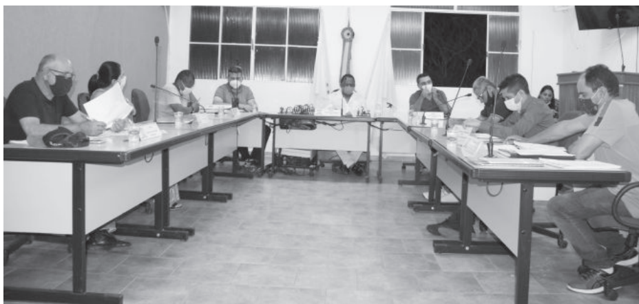
Todas as indicações foram aprovadas por unanimidade

Outro vereador que apresentou indicações foi Jair Lino de Carvalho Lage (PPS) que pede ao prefeito o calçamento dos morros que fazem o aces-