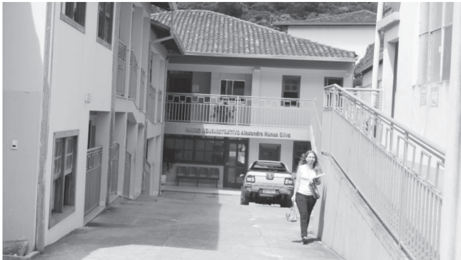
Anexo administrativo: a obrigatoriedade se tornou uma prática comum pelas prefeituras em várias partes do país

também estão obrigados a se vacinar empregados públicos municipais e prestadores de serviço.