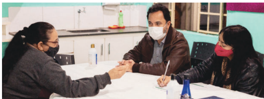
Vários pedidos foram levantados, como sugestões de ações na saúde, educação, esporte e lazer e obras, dentre outras