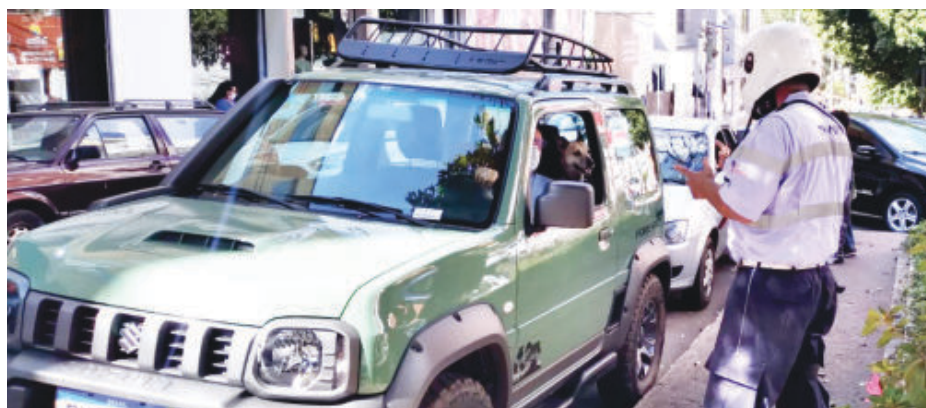
Agente da Transita cobra rotativo na região central de Itabira