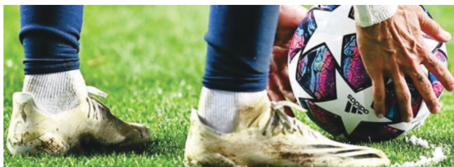
Campeonato ficou para 2022 por falta de tempo hábil; por sugestão, foi sinalizada uma espécie de aquecimento com a realização de uma “copinha”

O Campeonato Amador reúne normalmente cerca de 26 clubes, incluindo os times dos distritos de Senhora do Carmo e Ipoema filiados, além de um time de Santa Maria de Itabira e outro de