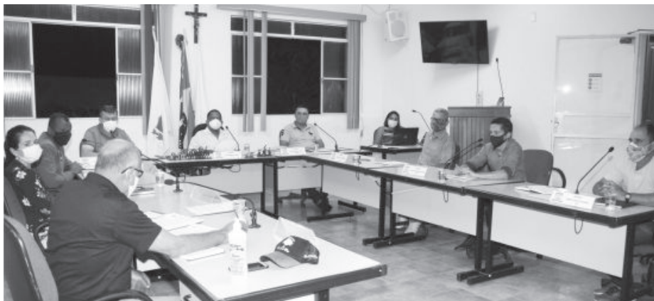
Nos sete primeiros meses de 2021, a Câmara produziu mais de 40 proposições, entre projetos de lei, de resolução e indicações