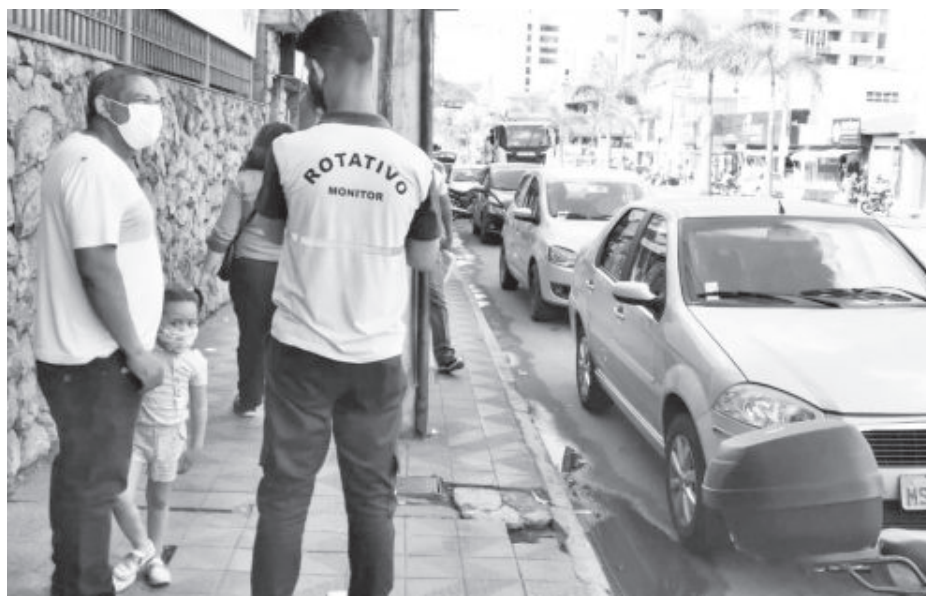
Monitor do rotativo explica para motorista sistema de cobrança

“Antigamente, tinha o tempo bônus, com a mudança que vigora desde a aplicação do aplicativo, infelizmente, alguns usuários hoje podem estar pagando por um tempo indevido. Vamos supor que você paga R$ 2,50 por 90 minutos, uma hora meia. Se você fica por 20 minutos e vai em-