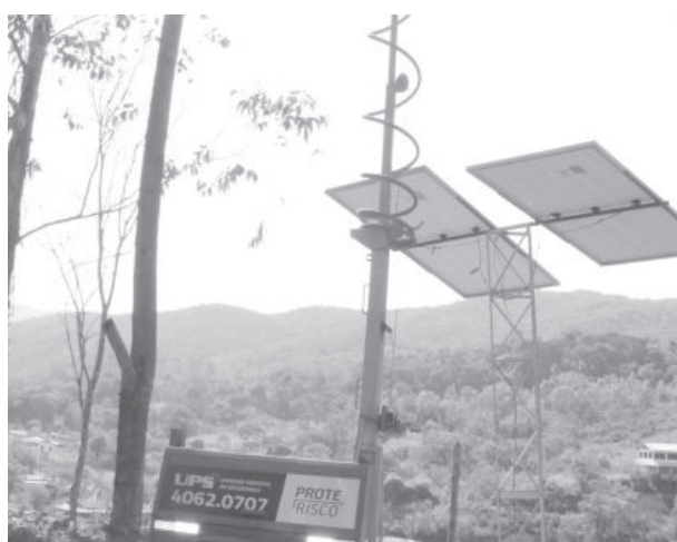
Aparelho de monitoramento e sirene na comunidade evacuada de Socorro

A redução do nível de emergência foi protocolada junto aos órgãos competentes, conforme diretrizes estabelecidas no Plano de Ação de Emergência de Barragens de Mineração (PA-EBM) e na legislação brasileira, e reportada à Agência Nacional de Mineração (ANM) e à assessoria técnica do Ministério Público de Minas Gerais (MPMG).