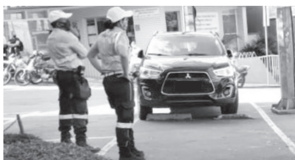
Agentes da Transita observam carros e estacionamentos na região central

Já o estacionamento pago na região central da