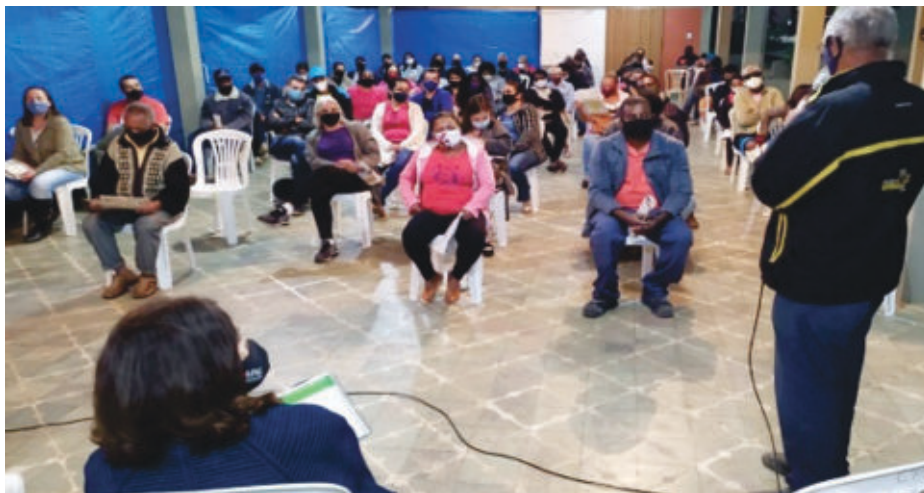
O objetivo do encontro foi promover a participação e informação da população

Os lotes de imunizantes contra a Covid-19, números 23 e 24, distribuídos pela Secretaria de Estado de Saúde (SES-MG), entre os dias 14 e 16 de junho, ampliaram na microrregião de Itabira a média da população imunizada contra a doença, atingindo de 26% a 61% dos moradores com a primeira dose, seguindo cronograma de prioritários e público em geral.