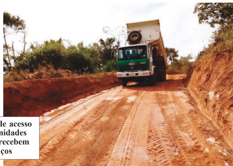
Estradas de acesso às comunidades também recebem serviços