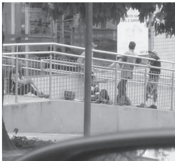
Pedintes foram flagrados na tarde de domingo (6) a espera de clientes

“Tomei um susto com a abordagem em grupo, na porta do banco. Respondi que iria ver se tinha dinheiro. Confesso que desisti de fazer saque, pois estava só dentro da agência e não vi segurança. Tirei apenas um extrato e saí, sem dinheiro, e fui novamente abordada pelo grupo, que não gostou quando disse que meu pagamento não havia sido depositado. Eles continuaram a insistir, parando logo