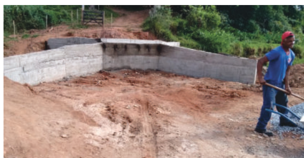
Obras seguem em vários pontos