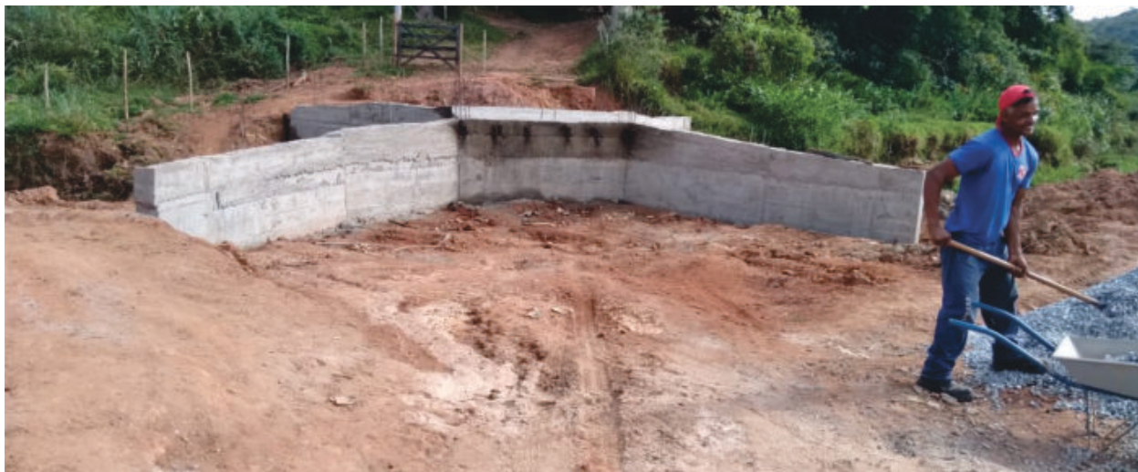
Pontes de acesso a várias comunidades, destruídas pelas chuvas, estão sendo recuperadas

Na próxima semana, a Secretaria de Obras inicia também intervenções na ponte de acesso à comunidade de Malacacheta.