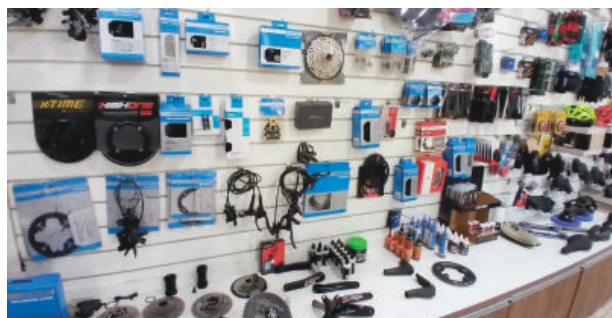
Peças de reposição são outro problema

Atualmente, a linha de frente em relação às vendas são as bicicletas mistas, usadas no asfalto ou estrada de terra, conhecidas como mountain bike, aro 29, com 24 velocidades. O preço inicial desse equipamento é de R$ 1.890, mas pode chegar a R$ 3 mil, R$ 6 mil, conforme a opção de montagem definida pelo cliente. Se o ciclista for mais exigente, encontrará modelos que podem chegar R$ 50 mil, R$ 60 mil facilmente.