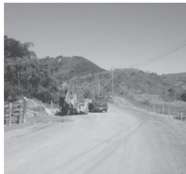
Obra foi interrompida pelo MP, mas deve receber novo projeto de execução