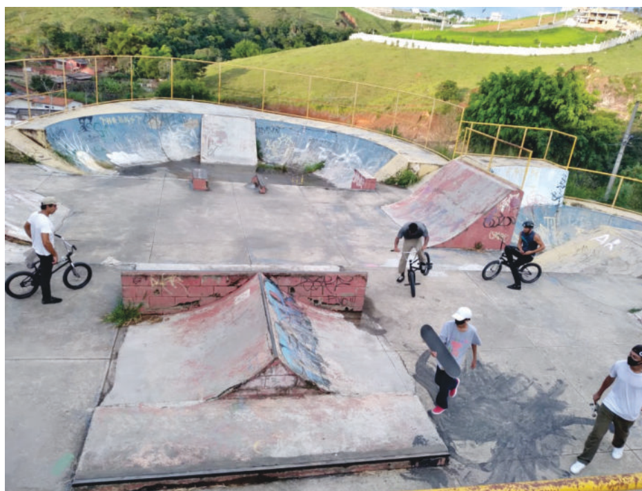
Além de abandonada, pista recebe ciclistas do estilo livre, que carecem de pista para o esporte

"Assim que a atual administração assumiu, foi realizado um minucioso levantamento de todos os equipamentos públicos de esporte e lazer