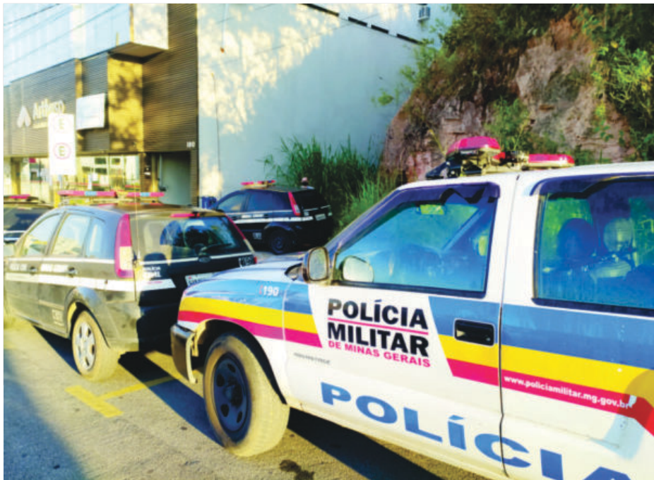
Para a Polícia Civil de Monlevade a prisão dos investigados representa uma grande ação no combate aos crimes violentos na região