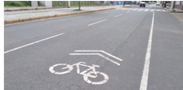
Faixa ajuda, mas ideal é a ciclovia

Em 2019, a Prefeitura pintou em um lado das principais avenidas da cidade sinalizador de ciclista. A proposta serve mais como indicador para evitar acidentes. Para os praticantes do esporte, o si-