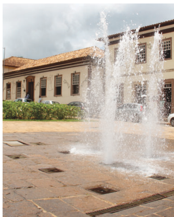
Prefeitura de Santa Bárbara, no Centro histórico da cidade

Outra ação é a parceria público-privada, de