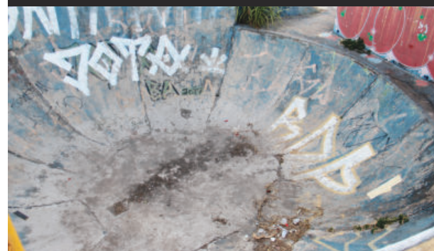
ANOS DE ABANDONO