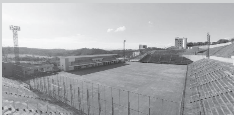
De acordo com relatório elaborado pelo Corpo de Bombeiros são várias as necessidades de intervenções para a liberação do estádio