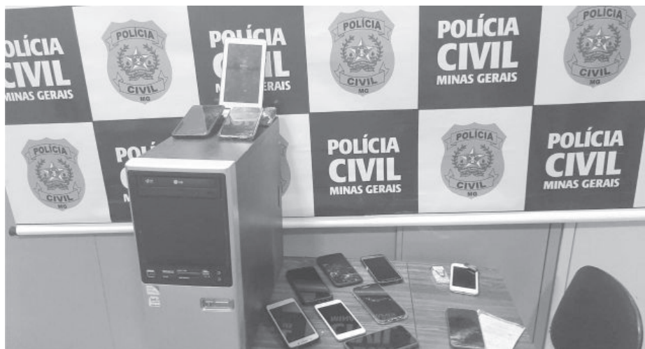
Em poder dos investigados foram apreendidos aparelhos celulares e mídias eletrônicas

Os envolvidos são investigados pelo crime de roubo, corrupção passiva e ativa, além de crimes previstos na lei