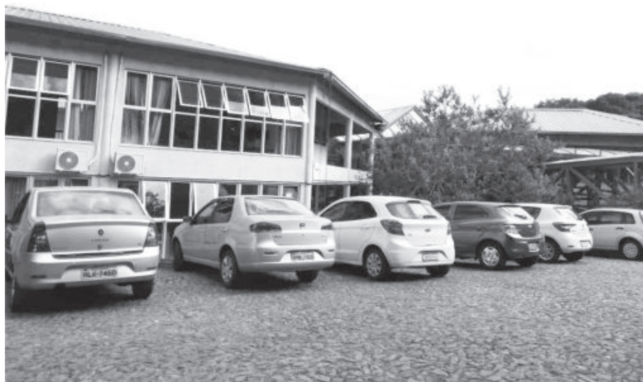
As instalações da Mata do Intelecto, ao lado do Hospital Municipal Carlos Chagas, foram escolhidas para abrigar o hospital de campanha

O município conta hoje com 22 leitos UTI/SUS Covid no Hospital Municipal Carlos Chagas (HMCC) e seis leitos UTI/SUS Covid no