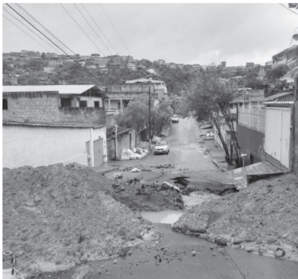
Uma das ruas recuperadas é dos Fazendeiros, no bairro Gabiroba, a qual apresentou rompimento de adutora

A Prefeitura de Itabira realiza, desde o mês de janeiro, operação tapa-buracos em diversos bairros do município. A execução da atividade é permanente, para dar manutenção em vias pavimentadas que necessitam de manutenção. A atividade é responsabilidade da Secretaria Municipal de Obras, Transporte e Trânsito (SMOTT).