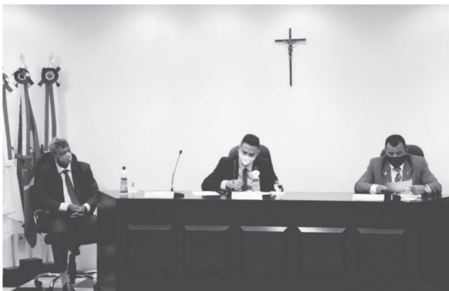
Vereadores aprovaram também correção salarial e reajuste do cartão-alimentação dos servidores

Além disso, foi apresentado o projeto que busca adequar o quadro de pessoal da administração para atender à nova realidade de demanda dos serviços públicos prestados ao Município de São Gonçalo do Rio Abaixo, alterando os dispositivos da lei comple-