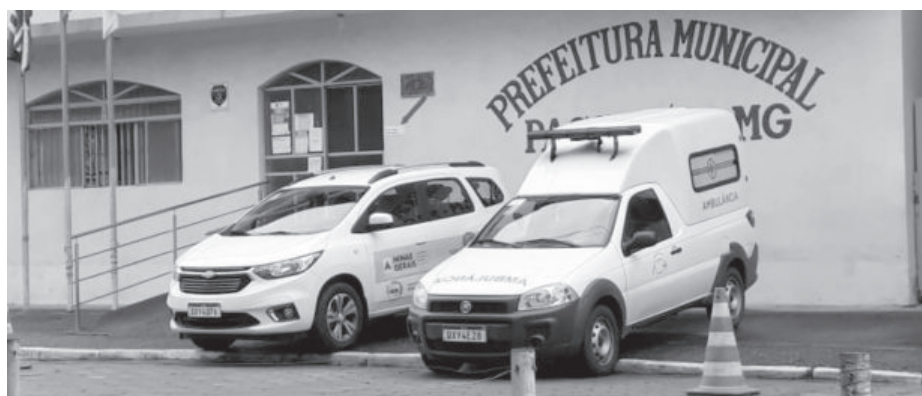
Município tem se esforçado para manter bom serviço de saúde pública

procedimentos na Unidade de Saúde da Família (USF) e, quando necessário, no domicílio, realizar busca ativa das doenças infectocontagiosas, garantir acesso à continuidade do tratamento dentro de um sistema de referência e contra-referência para os casos de maior complexidade ou que necessitem de internação hospitalar, realizar pequenas cirurgias ambulatoriais, verificar e atestar óbito, emitir laudos, pareceres e atestados sob assuntos de sua competência, supervisionar os eventuais componentes da família em tratamento domiciliar e dos pacientes com tuberculose, hanseníase, hipertensão, diabetes e