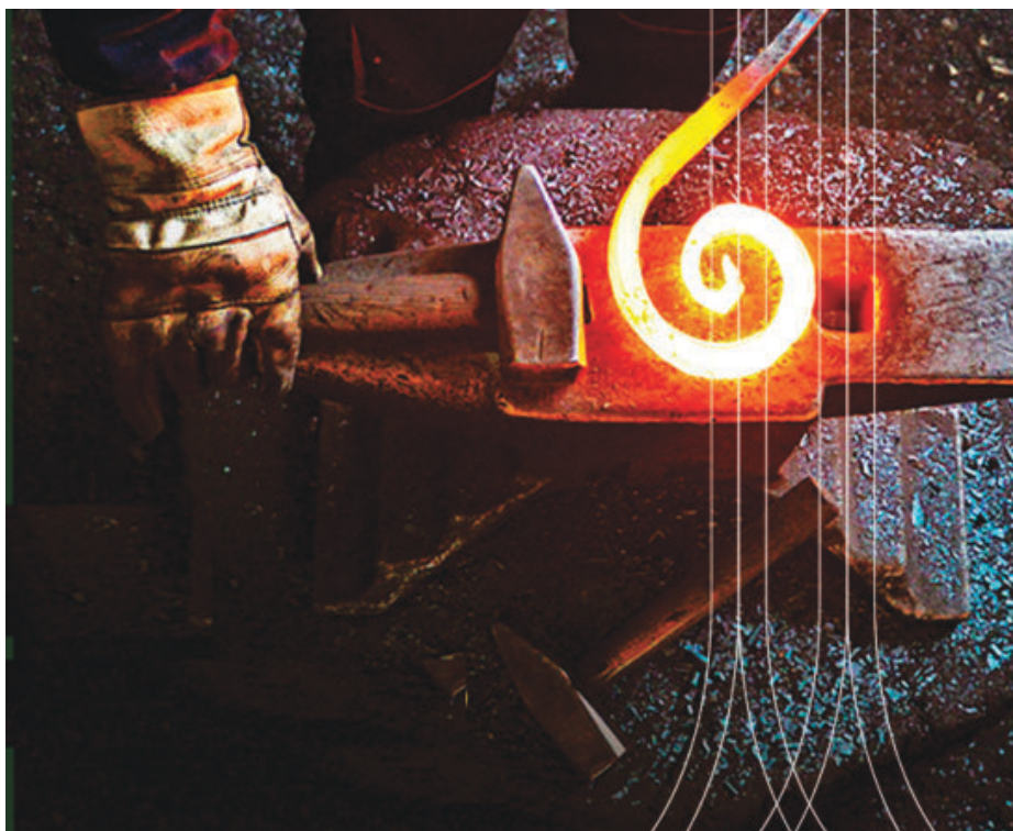
Os interessados têm até às 18h do dia 16 de abril para se cadastrarem

“Minas Gerais tem grande protagonismo na história de 120 anos da Gerdau. Por isso, este edital chega como uma forma de reconhecer e incentivar manifestações artísticas que reforcem a riqueza cultural construída em 300 anos de história do estado. A ideia de presentear as cidades com essas esculturas tem o intuito de ampliar o contato da população com a história de Minas Gerais por meio da arte”, expli-