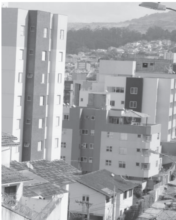
Itabira tem 54.524 imóveis cadastrados

O documento poderá ser pago em até seis parcelas em bancos e casas lotéricas credenciadas. No entanto, o contribuinte que optar por pagar em cota única – até a data de vencimento – terá desconto de 10% sobre o valor. Há ainda a opção de pagamento em até nove vezes. Para isso, o interessado deverá retirar as guias de arrecadação no guichê de atendimento da Secretaria Municipal de Fazenda (SMF). As guias poderão ser obtidas ainda na página oficial da Pre-