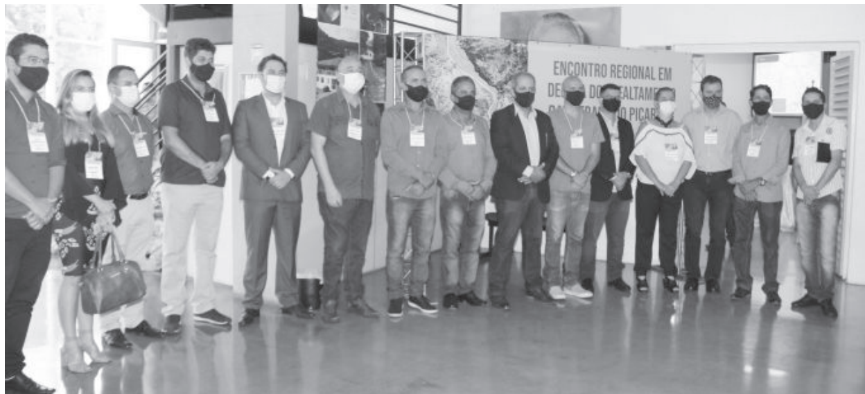
Lideranças e representantes assinaram documento com registros sobre LMG-790, o qual foi encaminhado ao governador Romeu Zema

pografia excelente, que une Santa Maria e todas as cidades adjacentes ao Vale do Aço, em um trecho curto. Por isso, acreditamos que é uma obra executável e essencial em níveis econômicos e sociais. Por este motivo, reunimos aqui lideranças e assinamos um documento público para sensibilizar o governador Romeu Zema para que a