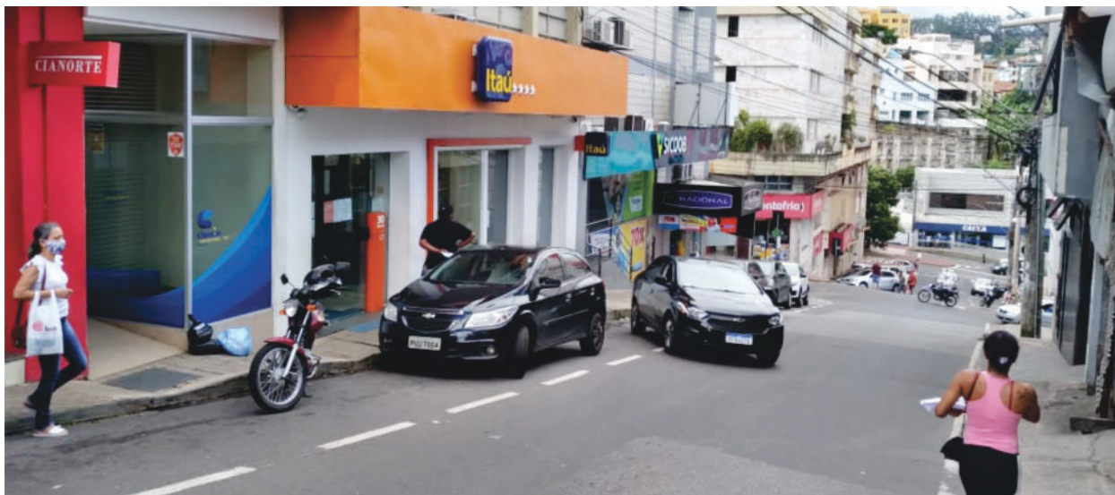
Bancos, lojas e Judiciário não seguiram a ideia da Prefeitura de Itabira, que voltou atrás

INVESTIMENTO Parque Mata do Limoeiro receberá R$ 10 milhões