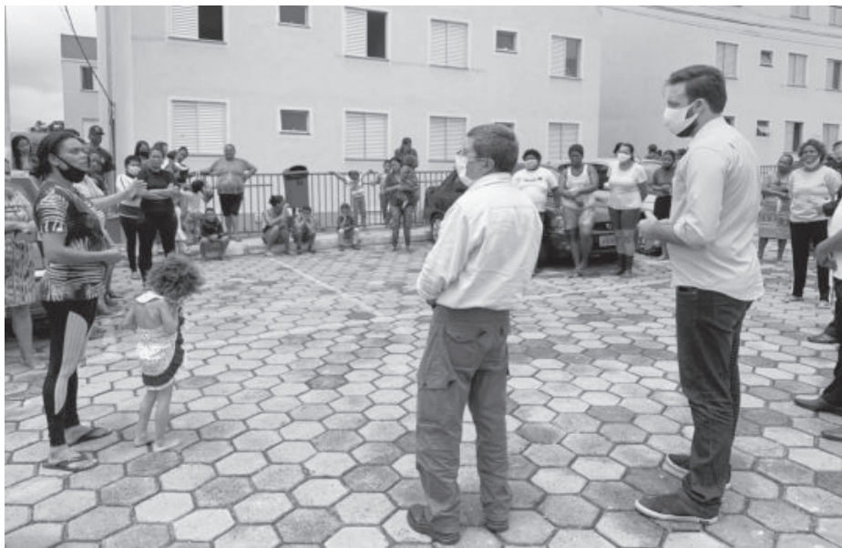
Encontro com moradores aconteceu na terça-feira (9), no residencial Barreiro

O diretor técnico explicou aos moradores que a construção da rede de distribuição não acontece de maneira rápida. No entanto, para agilizar o processo, a autarquia já está adquirindo os tubos e materiais necessários para a obra. “A alternativa que temos neste momento é a de abastecer a caixa d’água com o auxílio de um caminhão-pipa. Enquanto isso, já estamos