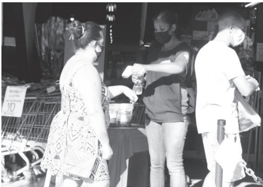
Comércio deve seguir as regras de ocupação interna, 70% da capacidade, aferição de temperatura dos clientes e aplicação de álcool em gel

“Eu concordo, porque se a pessoa estiver com o vírus, mas estiver com a máscara, tem grandes possibilidades de não transmitir o coronavírus, e da mesma forma eu, que não passo a doença se circular com a máscara e claro, higienizar as mãos com frequência para frear os registros de contaminados”.