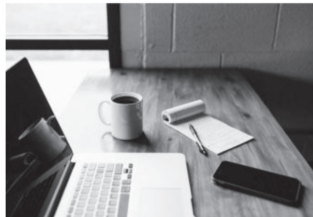
“Faz falta a socialização, calor humano”

De acordo com um funcionário da Vale, que pediu para não ser identificado, o trabalho em casa tem suas vantagens e desvantagens. “É uma novidade para mim, que tenho 16 anos de Vale, ter que ir para casa e estar em frente ao computador às 7h da manhã, até o final da tarde, claro, com intervalos para refeições e questões fisiológicas. As vantagens são o conforto da casa, a comodidade, maior liberdade, maior aproximação com a fami-