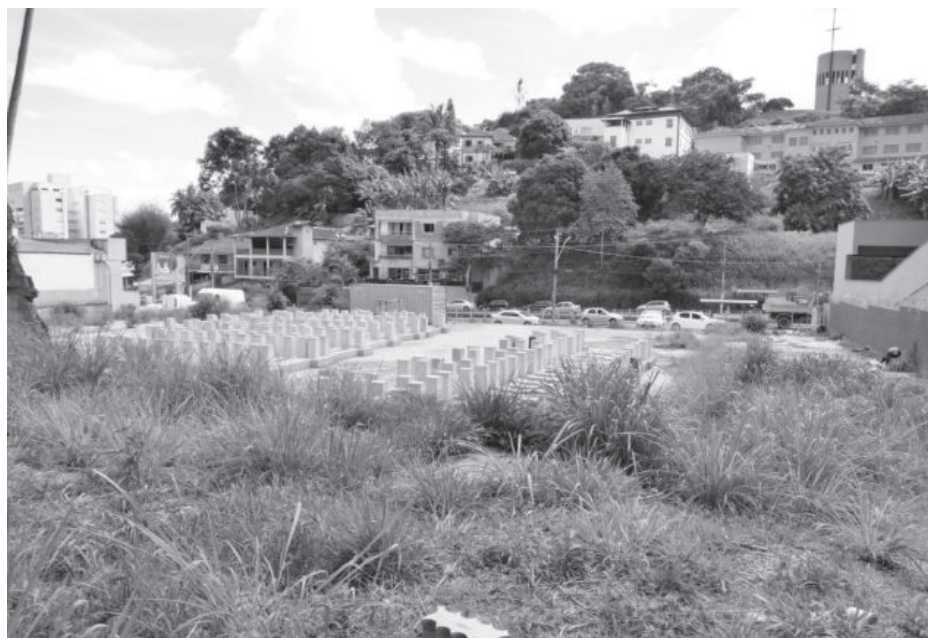
Lotes leiloados pela Prefeitura, na avenida Carlos Drummond de Andrade, um dos locais cogitados para receber o espaço de convivência