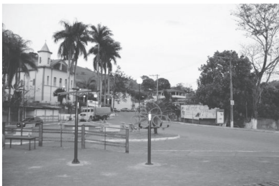
Região central de Itambé - Cidade completa no dia 30 de dezembro 58 anos de emancipação e fato é histórico

Conforme as gravações e conclusão do processo do MP, a Justiça