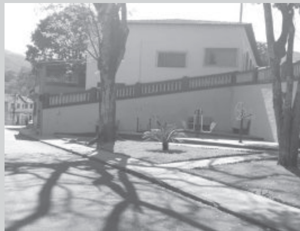
Academia na pracinha da rua Ipoema, no Pará

Além disso, nos últimos anos, os serviços de capina, roçada, pintura de guias, poda de árvores e recolhimento de entulhos foram intensificados em toda a cidade, especialmente, no Jardim Belvedere, Boa Esperança, Chapada,