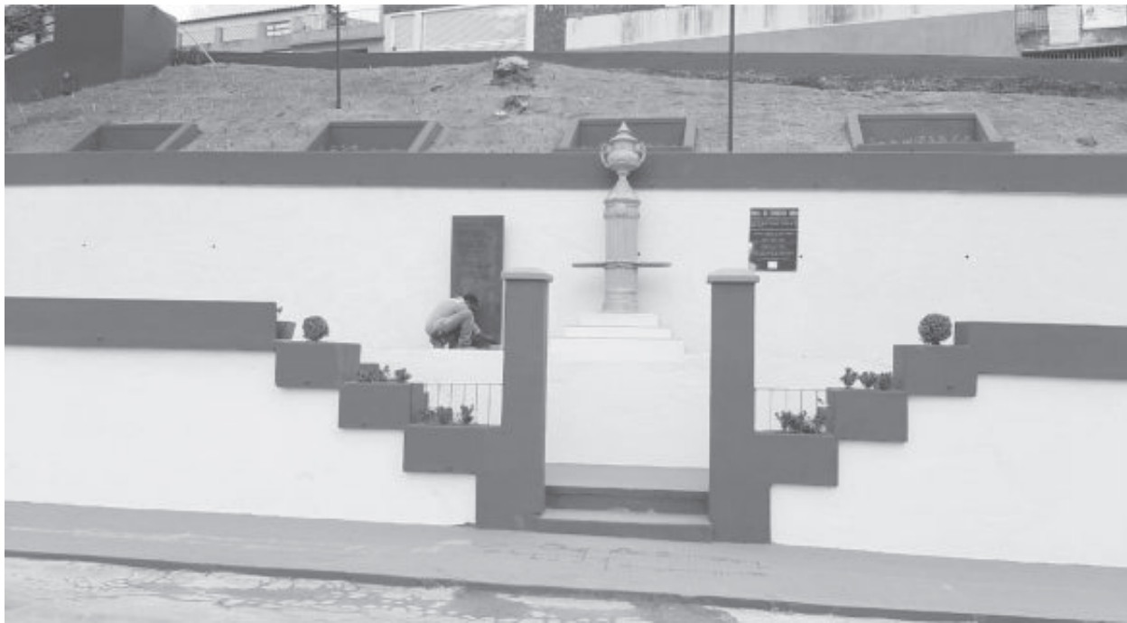
A antiga “pracinha do Zoológico” – conhecida assim por, em outras décadas, ter abrigado vários bichos –, foi toda revitalizada

Já os espaços públicos que tiveram melhorias foram as pracinhas dos bairros Pedreira e Nova Vista, com construção de quadra de esportes; a via de acesso entre as avenidas Mauro Ribeiro e Duque de Caxias, com construção de acesso a pedestres, avenida Osório Sampaio, com a troca da guia do canteiro central e confecção de acesso para portadores de necessidades