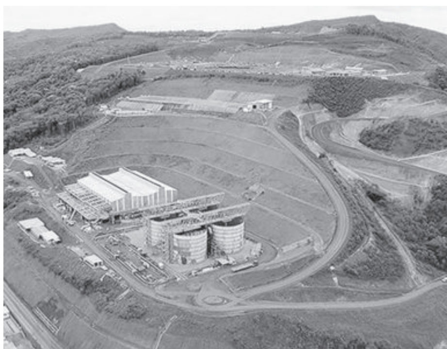
Atividades da mineradora em risco com pedido de suspensão das atividades

Em síntese, o promotor de Justiça argumenta que “há risco de colapso do sistema de saúde em nível municipal e regional, diante do aumento de casos ligados à atividade da empresa, que representa a grande maioria dos casos, sem que tenhamos