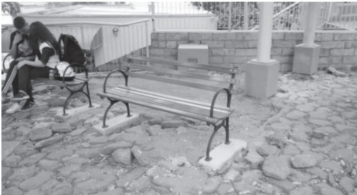
No Largo do Batistinha os bancos foram substituídos e o piso da calçada portuguesa foi recomposto

especiais; na entrada do bairro foi colocada grama nos taludes, além da limpeza e pintura das guias em todo o bairro, no Paredão da rua Tiradentes (Centro) houve a substituição de bancos, colocação de grama e troca das luminárias, recuperação dos passeios do centro histórico (com início na rua Água Santa até a Igrejinha do Rosário e ruas adjacentes).