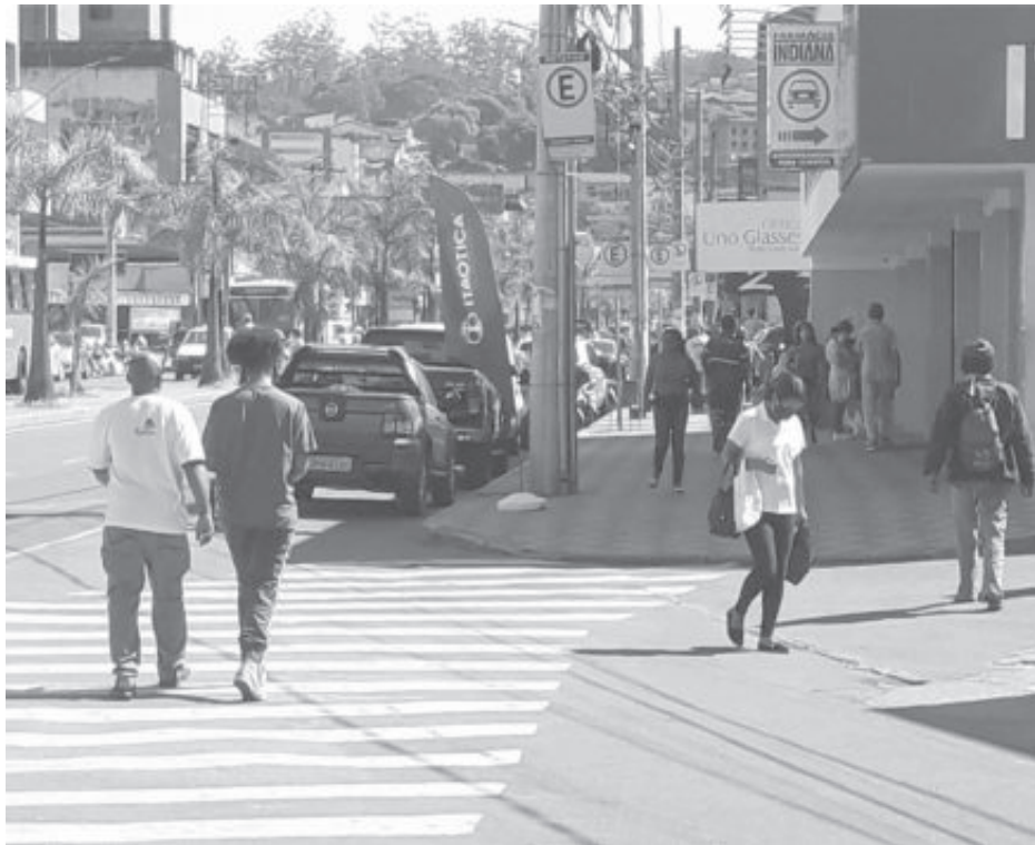
Em Itabira, estimativa do IBGE aponta população de 120.904 até agosto

Na microrregião de Itabira, em relação a 2019, cidades menores tiveram redução populacional