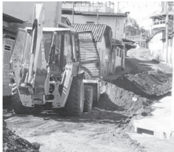
Serviços serão concluídos em janeiro de 2021

Os serviços de drenagem e pavimentação das ruas José Simão Gonçalves, Geraldo Cleofas, Sabará e entorno da praça Governador Rondon Pacheco, na vila Regina completam um mês e seguem dentro do cronograma.