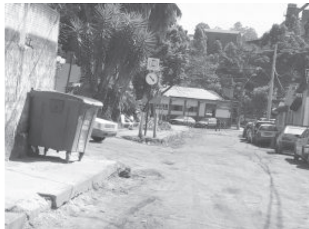
Região recebe nova pavimentação e drenagem

do executados por meio de convênio com o Ministério das Cidades e contrapartida da Prefeitura, no valor global de R$ 377.063,10. Cerca de 10 empregos estão sendo gerados e a previsão de conclusão dos serviços é para janeiro de 2021.