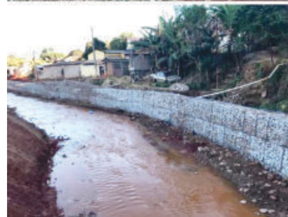
Serviços chegam à metade do prazo e já têm resultados visíveis

Reivindicação anti-ga da população de Barão de Cocais, as obras de dragagem do rio São João e dos córregos São Miguel e Corta Goela chegam à metade do prazo e já têm resultados visíveis. Após três meses de obra, já é possível ver a encosta do rio e dos córregos mais limpas. Até o momento, a dragagem já foi executada em quase 6km de todo o trecho, o que corresponde a quase 60% desta etapa.