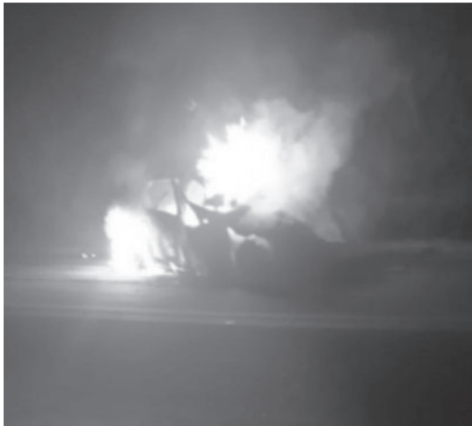
Carro em que a família de Barão estava foi consumido pelas chamas

De acordo com o Corpo de Bombeiros, o moto-