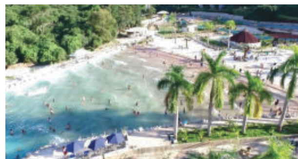
Vista aérea do local conforme panfleto

Polícia investiga lavagem de dinheiro em parque aquático de Santa Bárbara