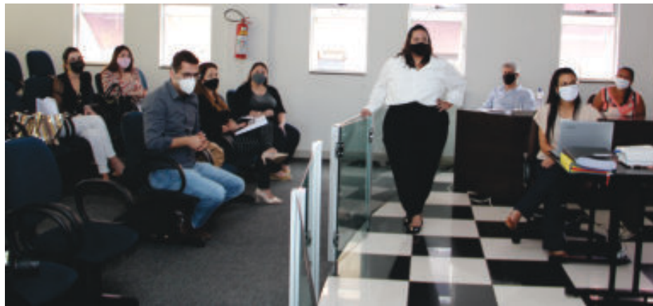
Profissionais de saúde apresentaram números e ações aos vereadores

Conforme a Prefeitura, foram destinados cerca de R$ 7,5 milhões para ações de enfrentamento à Covid-19