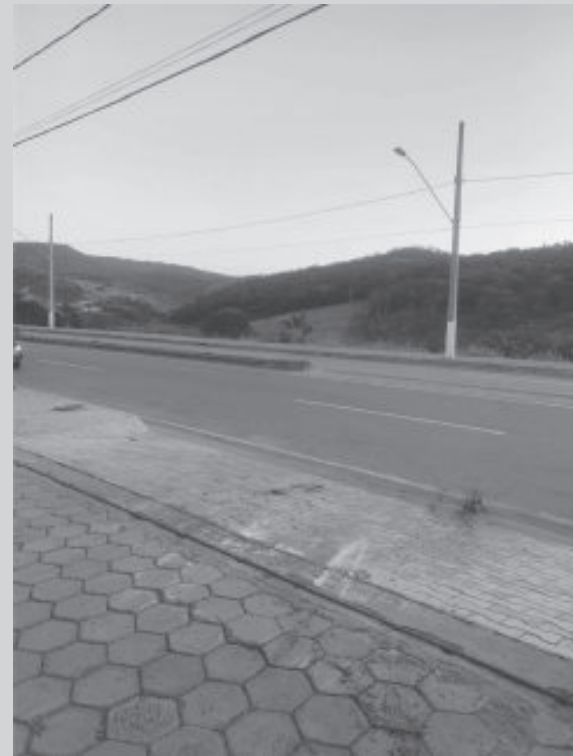
Empresa alega dificuldade de diálogo em relação a mudanças em canteiro central

A MCM Transporte, empresa do grupo Automade, informou que está transferindo a unidade de São Gonçalo do Rio Abaixo para Barão de Cocais.