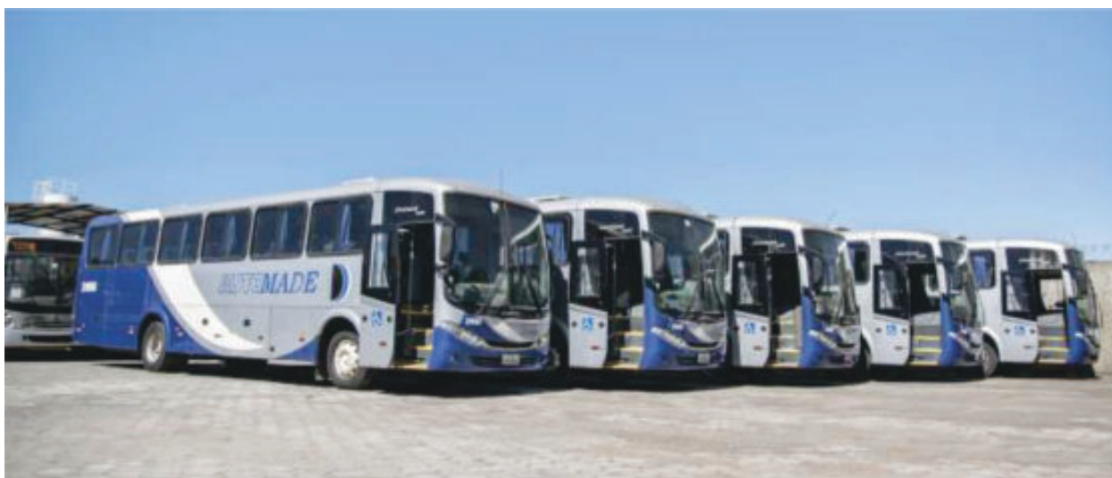
Frota da Automade na garagem em Itabira. Empresa já presta serviços de transporte de passageiros na região

A decisão da Caraça aconteceu após reunião entre os diretores da em-