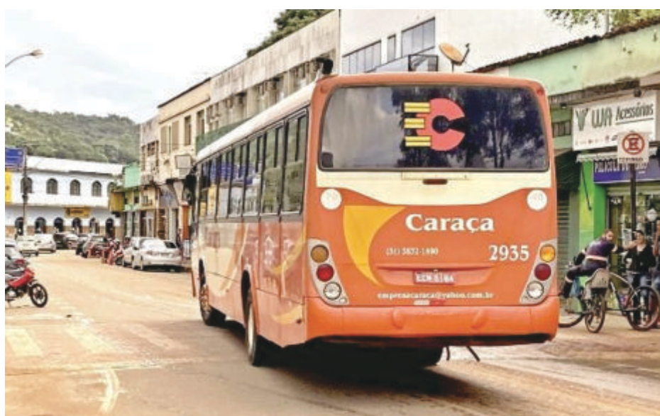
Empresa alega que valor da passagem inviabiliza o serviço

A Automade, empresa itabirana que atua no ramo de locação de ônibus, equipamentos e transporte de passageiros desde 2005, demonstrou interesse em disputar a licitação para atender Barão de Cocais.