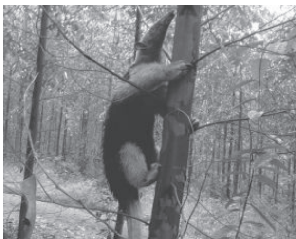
Tamanduá-mirim escala pé de eucalipto nas terras da Cenibra

O tamanduá-mirim pode ser encontrado nas áreas da Cenibra, em todas as regiões de sua atuação. Essa presença é favorecida pelas técnicas de manejo praticadas