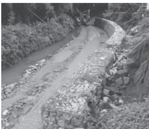
Construção de gabião na rua 19 de Março, atrás do Centro de Saúde