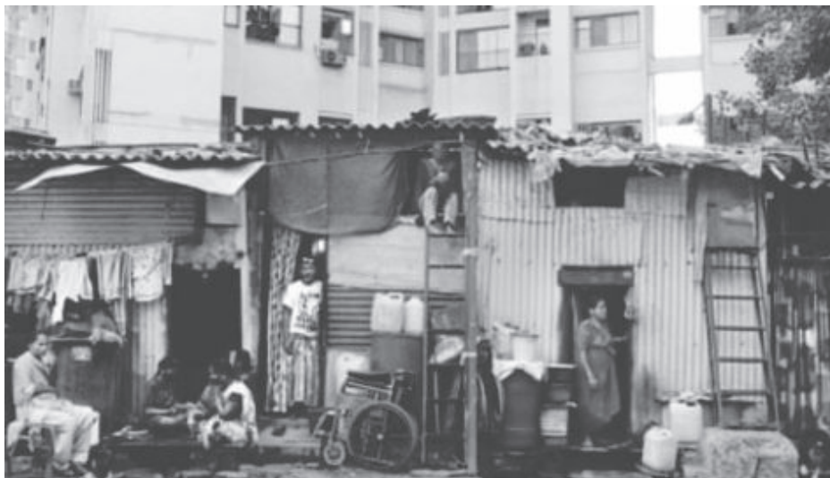
Pobreza extrema seria o resultado dos impactos sociais e econômicos causados pela pandemia de coronavírus

“A Covid-19 é a última gota para milhões de pessoas que já lutam dia após dia com vários impactos em suas vidas. São conflitos armados, mudança climática, desigualdades e um sistema viciado de produção de alimentos”, afirma Katia