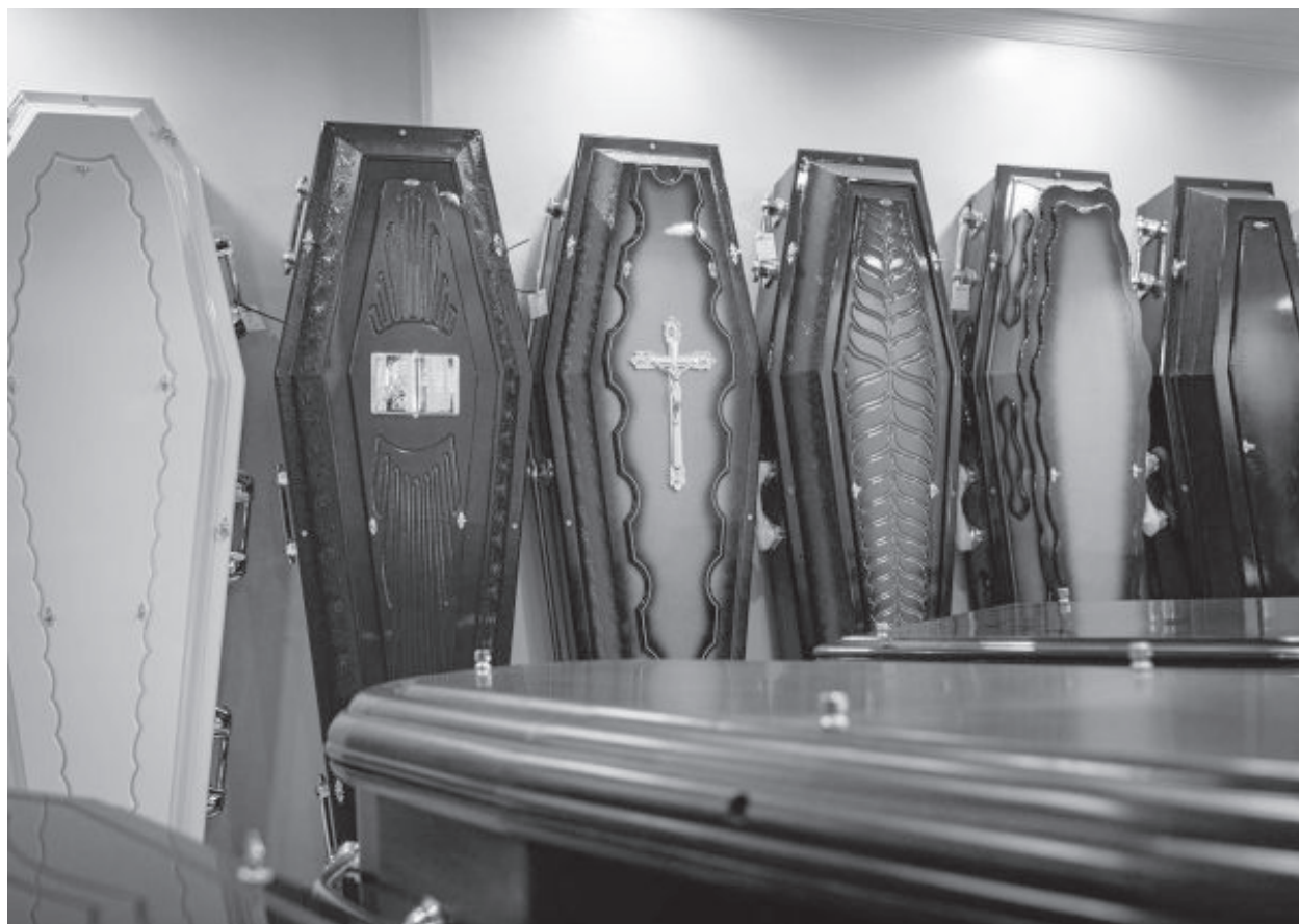
Estão sobrando caixões em funerárias de Itabira devido à queda nos serviços

Outros países também viveram situações complicadas em relação ao sistema funerário, como o Equador, em que corpos ficaram dias dentro de casa ou abandonados nas calçadas. Na Itália, no início da pandemia, os jornais mostraram cenas im-