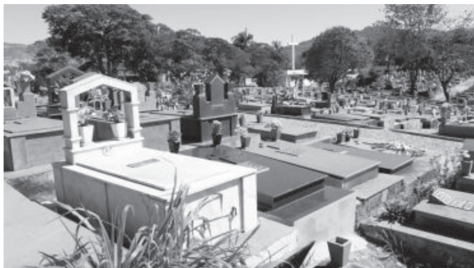
No cemitério, número de sepultamentos segue baixo na pandemia

A notícia de que em Itabira as funerárias estão tendo queda de receita não deixa de ser curiosa e, ao mesmo tempo, acalentadora. Segundo dados divulgados diariamente pela Prefeitura, o município tem atualmente pouco mais de 1.260 casos de Covid-19 e apenas cinco óbitos confirmados. É um sinal de que a cidade está conseguindo passar por esse período complicado com a situação razoavelmente sob controle.