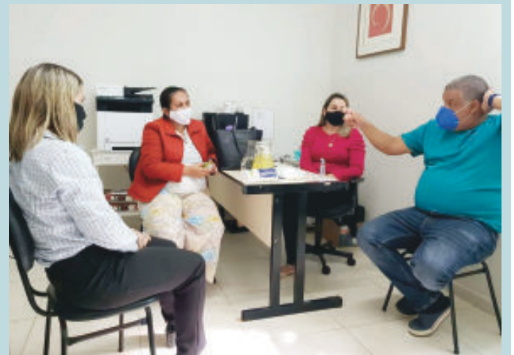
Além de apresentar a estrutura da Unidade, também foram discutidos os avanços promovidos na saúde municipal