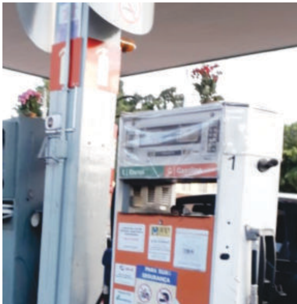
Postos devem passar a fornecer a nova gasolina na próxima segunda-feira (3)

A segunda especificação diz respeito à temperatura de destilação no ponto 50% evaporado (T50), com benefícios diretos para a dirigibilidade, desempenho e aque-