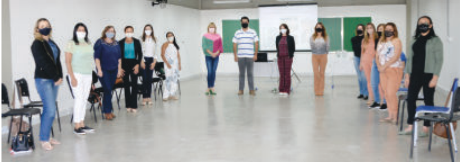
Diretores de escolas e CEIs compartilham informações sobre novidades de práticas pedagógicas implantadas durante a pandemia

Inovação tem sido palavra de ordem entre as diversas ações pedagógicas adotadas pela Secretaria de Educação em São Gonçalo do Rio Abaixo. Em tempos de pandemia, uma união de esforços entre a equipe pedagógica junto aos professores da rede municipal segue levando à residência dos estudantes uma série de atividades criativas tais como yoga em casa, atendimento psicológico online, atividades lúdicas, ações voltadas para crianças com necessidades especiais e dificuldades de aprendizagem e muito mais.