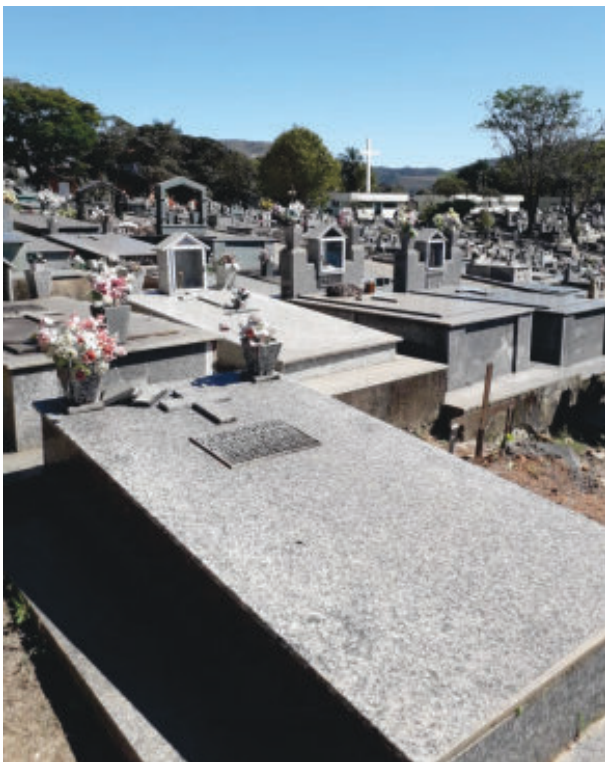
Cemitério da Paz, em Itabira: Sepultamentos não aumentaram na pandemia

Com apenas 57 anos, Passabém avança com obras e ações