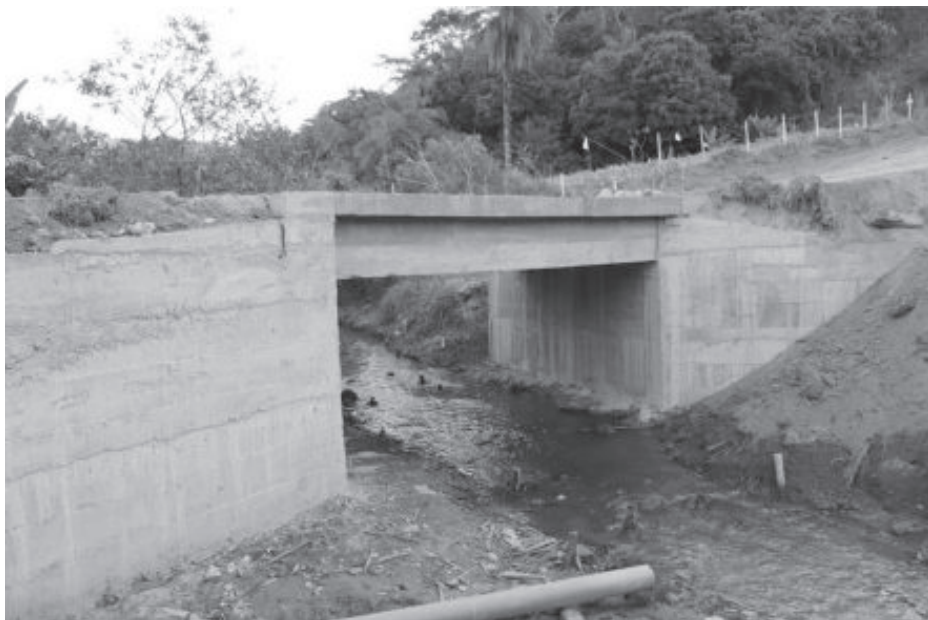
Entrega de ponte sobre o córrego dos Monjolos, seguência da rua Antônio Linhares, de acesso a novo bairro

A jovem Passabém, emancipada em 19 de março de 1963, hoje com 57 anos, deu um salto em desenvolvimento nos últimos anos. Os números são visíveis com o surgimento de bairros, ruas e novas casas.