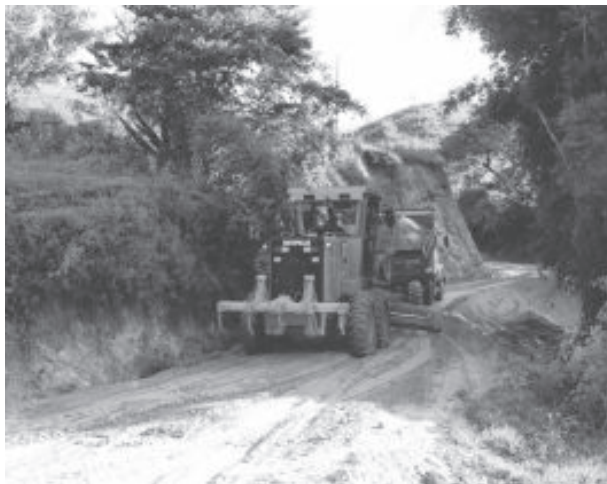
Abertura e recuperação da estrada de acesso ao Córrego das Rosas

Em se tratando de recuperação dos estragos provocados pela enchente, foi informado que grande parte das ações já está concluída e foram realizadas sem prejudicar investimentos em outros setores da administração, principalmente na saúde.