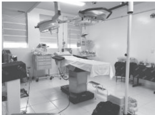
A unidade foi ampliada, ganhou novos aparelhos e pintura