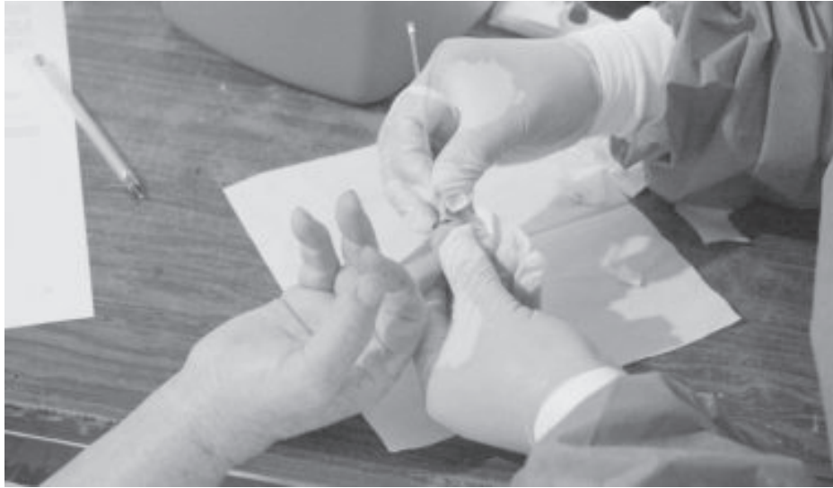
Estão sendo chamadas 2.352 pessoas escolhidas por sorteio eletrônico