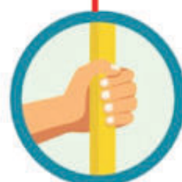
CONTATO COM SUPERFÍCIES CONTAMINADAS Seguido de contato com boca, nariz e olhos