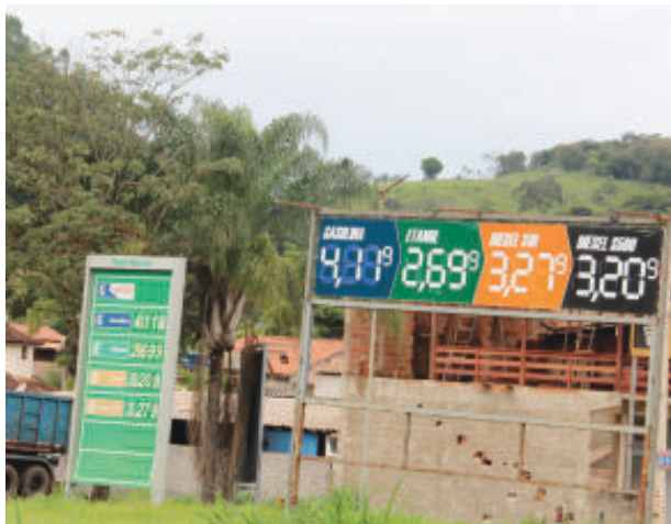
A gasolina saltou de R$ 4,12 para R$ 4,49

Dos nove grupos de produtos e serviços pesquisados, sete apresentaram alta no mês. Transportes foi a segunda maior contribui-