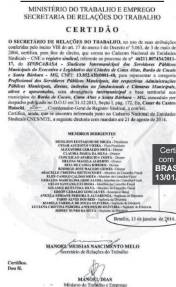
Certidão apresentada pelo sindicato de Barão de Cocais, com data de 2014