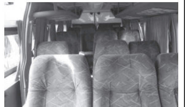
Van está em processo de licitação

Neste período de pandemia devido à Covid-19, Passabém recebe a confirmação da liberação de R$ 215 mil para a compra de uma van zero quilômetro com 15 lugares. O veículo, em fase de licitação, irá fortalecer a frota da Secretaria de Saúde.