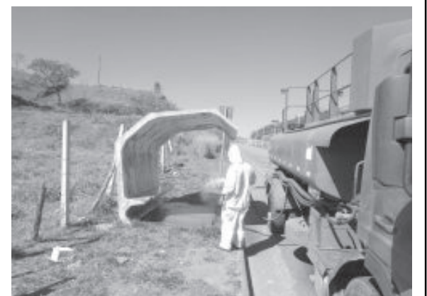
Trabalho de desinfecção segue em vários pontos da cidade

Processo de limpeza é contínuo para minimizar a pandemia da Covid-19