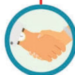
AGLOMERAÇÃO OU CONTATO FÍSICO COM PESSOA INFECTADA