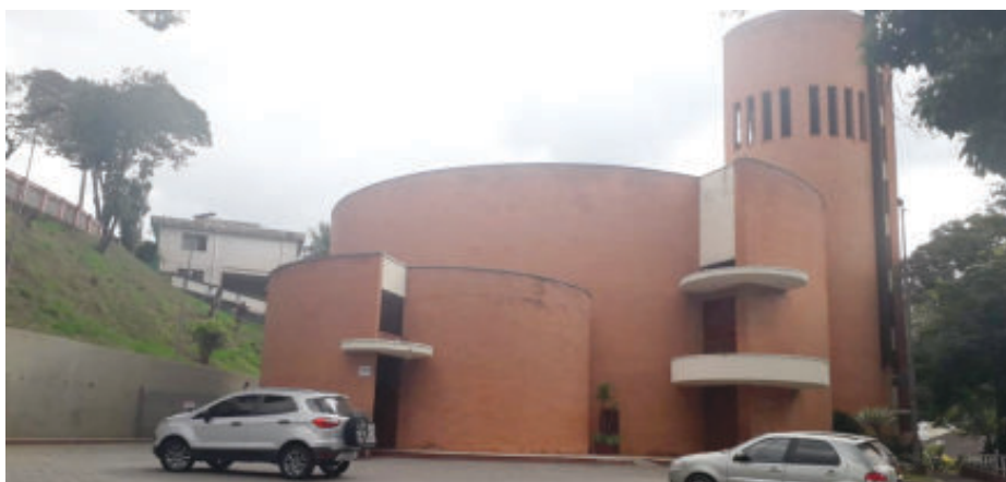
A Catedral Nossa Senhora do Rosário estuda aplicação do decreto