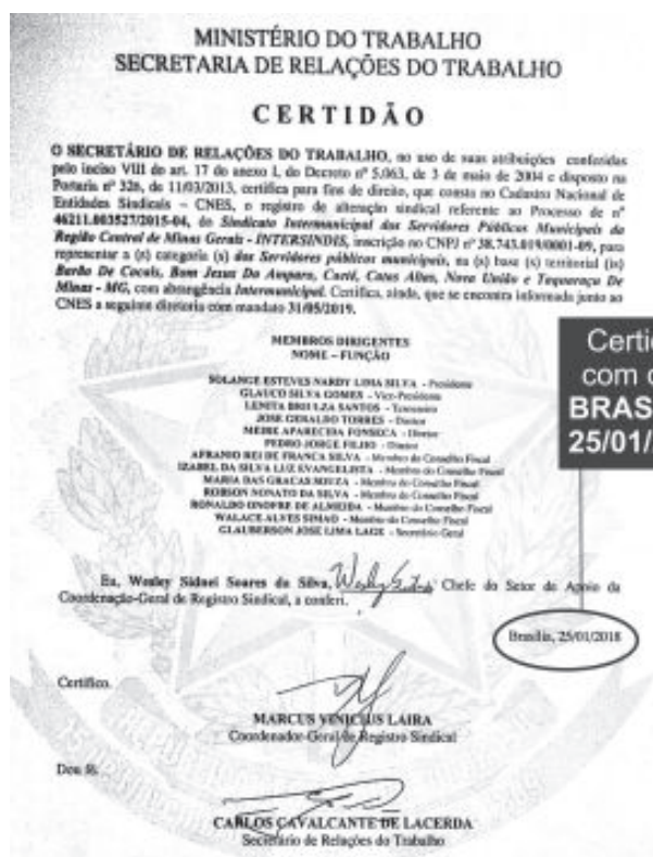
Certidão conferindo ao Intersindis direito a assistir servidores públicos municipais de Barão de Cocais