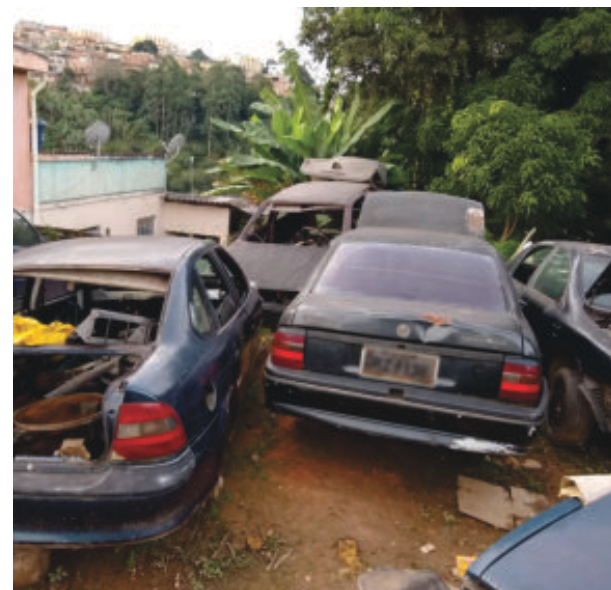
Vários veículos foram registrados em lotes vagos

do novos criadouros do Aedes aegypti e a proliferação de animais peçonhentos –, atua em prol da mobilidade urbana, pois prioriza a livre circulação de veículos e pedestres, diminuindo os riscos à acessibilidade. O programa visa também a segurança pública, já que impede o uso desses automóveis para esconderijo de cri-