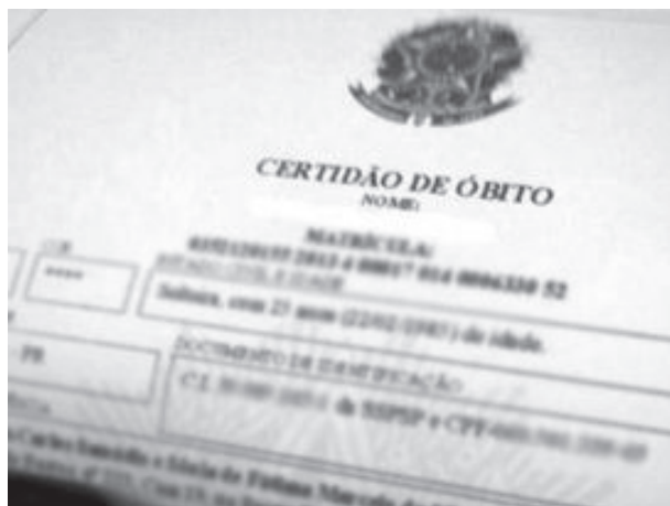
Registros despencaram nos primeiros cinco meses de 2020