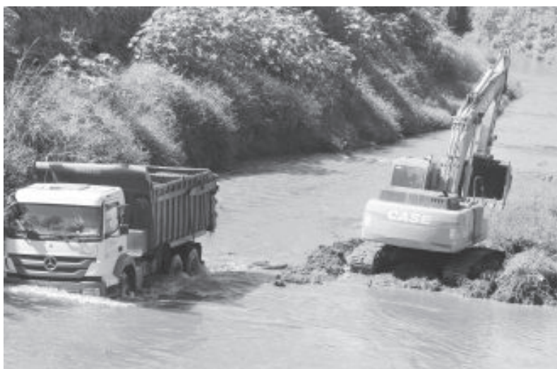
Serviço teve início na última semana de maio e segue por 90 dias

Outras intervenções ainda serão incluídas no projeto, como recomposição de mata ciliar e construção de taludes (gabião).