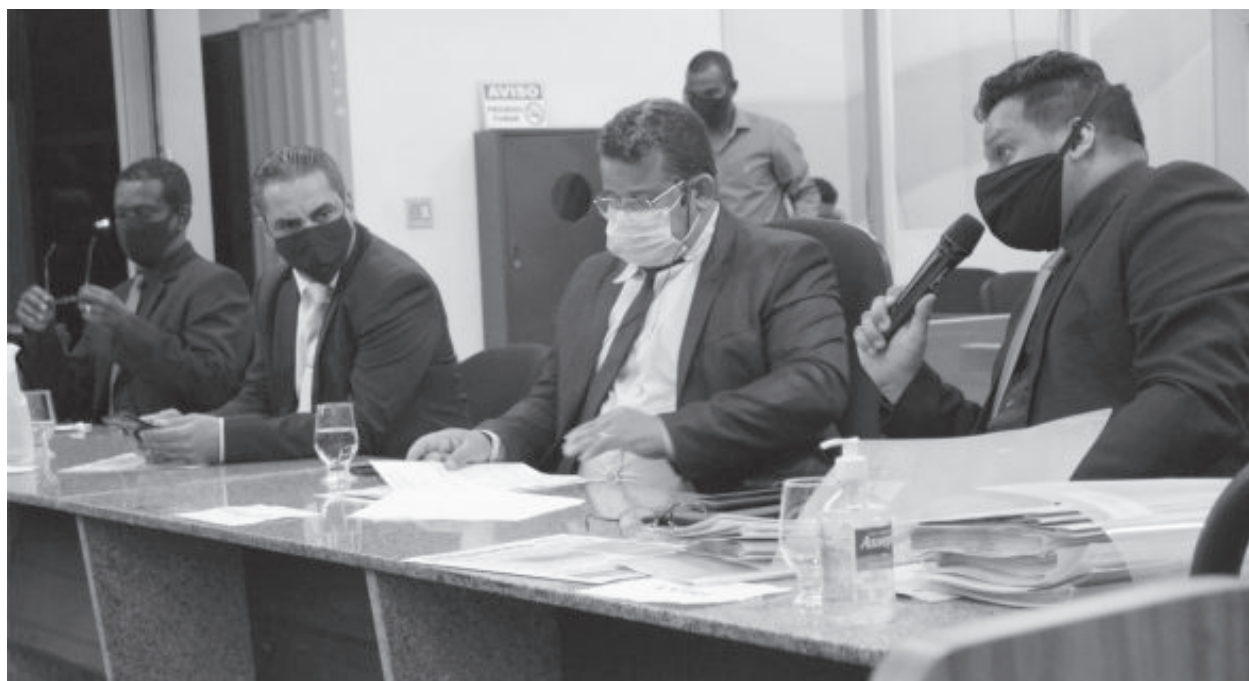
Sessão começou com atraso devido às duas reuniões, com donos de academias e professores

A secretária e sua equipe apresentaram os casos confirmados de Covid-19, os níveis de enfrentamento da pande-