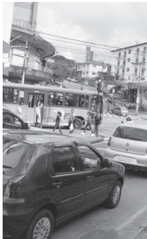
Dos 56.370 veículos registrados em Itabira, 77,88% estão em dia com o IPVA

lo automotor, atuais e vencidos, com juros de mercado, variando conforme o número de parcelas. Outras formas de simulação/contratação de parcelamento podem ser conferidas no site "fazenda.mg.gov.br".