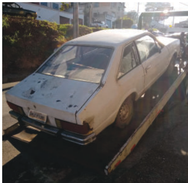
Nesta etapa, quatro veículos foram rebocados

“Além disso, os carros que estão nos lotes vagos não podem ser notificados apenas pela Transita e pelos policiais, é necessário o acompanhamento dos fiscais de posturas. Então, nós constatamos e registramos em fotos a situação de abandono desses veículos para fiscalizarmos. Inclusive, isso será a próxima etapa dos trabalhos”, explicou Van-