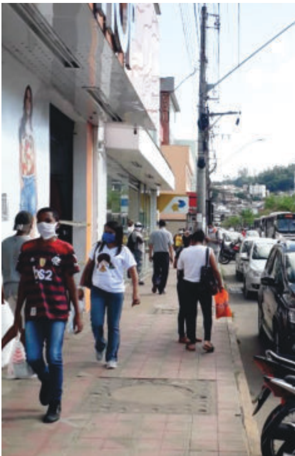
Queda de receita se deve à paralisação das atividades comerciais, que voltam ao normal de forma ainda tímida

Prefeitura vai assumir projeto para duplicação de acesso do trevo a Itabira