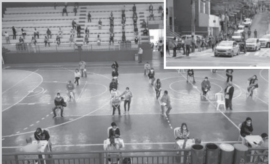
Atendimento no poliesportivo na terça-feira (5) e no detalhe, aglomeração no dia 29 de abril para acessar a Caixa para receber os R$ 600

Os atendimentos para quem busca o auxílio de R$ 600 do Governo Federal estão sendo feitos também no Ginásio Poliesportivo Maestro Silvério Faustino, no Centro (rua Irmãos D’Caux), das 8h às 14h. A Prefeitura de Itabira montou uma estrutura para acomodar até 170 pessoas no interior do ginásio.