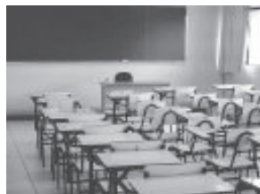
Salas de aula continuam vazias

A determinação está no decreto municipal 3.250/20. Segundo a SME, cada