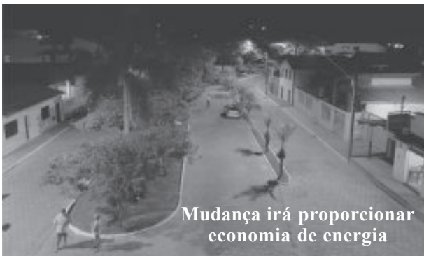
Mudança irá proporcionar economia de energia

A próxima etapa, mais robusta e abrangente, será na Vila Marília Costa, com a troca integral das luminárias, conforme projeto aprovado pela Câmara Municipal no dia 3 de maio.