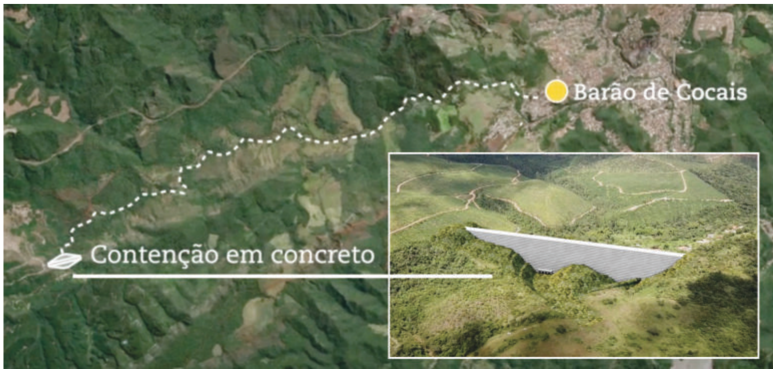
Conforme a Vale, obra foi concluída em fevereiro deste ano. Estrutura dará condições para a descaracterização da barragem

Conforme a Vale, a estrutura seguiu critérios técnicos internacionais e tem o objetivo de reter 100% dos volumes das barragens Sul Superior e Sul Inferior em um cenário hipotético extremo de ruptura, evitan-