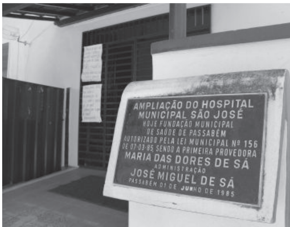
Última grande reforma do Hospital São José ocorreu em 1985, há 35 anos