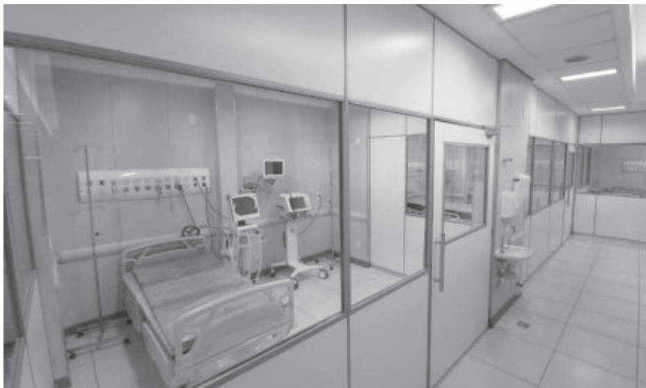
Atualmente, há 127 leitos disponíveis na rede pública de Itabira, incluindo enfermaria e Unidade de Terapia Intensiva (UTI)

A Prefeitura ampliou a assistência hospitalar no enfrentamento ao novo coronavírus com a instalação de novos leitos nos hospitais Carlos Chagas e