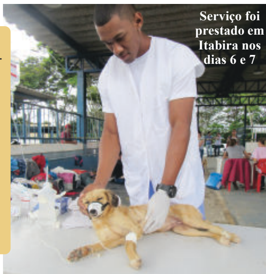
Serviço foi prestado em Itabira nos dias 6 e 7