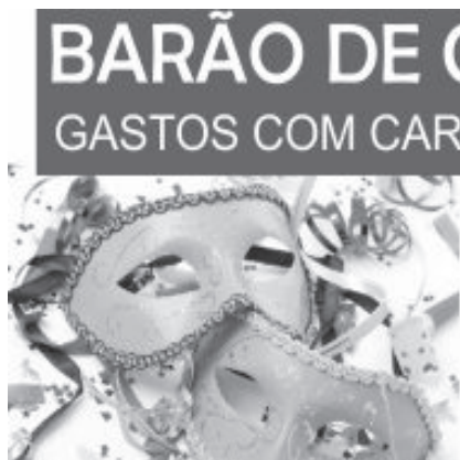
Valores corrigidos pela inflação

Em Itabira, o aquecimento para a festa teve início com a saída do bloco Madalena não gosta de poema, nos últimos sábados (1º e 8 de fevereiro) arrastado multidão pelas ruas centrais da cidade. No dia 8, por exemplo, a concentração foi na praça Nico Rosa e paredão da rua Tiradentes. A programação oficial será realizada entre sábado (22) e terça (25), na pracinha do Campestre, por meio da associação de moradores, com apoio da Prefeitura. Outra cidade que deve promover a folia 2020 é Santa Maria de Itabira, também por meio de vereadores, comerciantes e associações. Em João Monelvade a festa acontecerá de 22 a 25, com