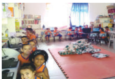
Aula de introdução à informática, com a aquisição de 20 notebooks

Para o início do ano letivo 2020, a Secretaria de Educação entregou na quarta-feira (12) o kit escolar aos alunos do 1º ano do ensino fundamental. O kit é composto de uniforme, mochila e material escolar e beneficiará dezenas de crianças.