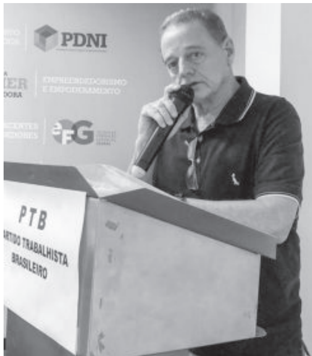
Ronaldo durante o anúncio de sua pré-candidatura

O santa-mariense, pai de quatro filhos e avô de três netos, conduz uma administração pública com resultados interessantes em meio à recuperação de uma profunda crise. Hoje, a cidade pas-