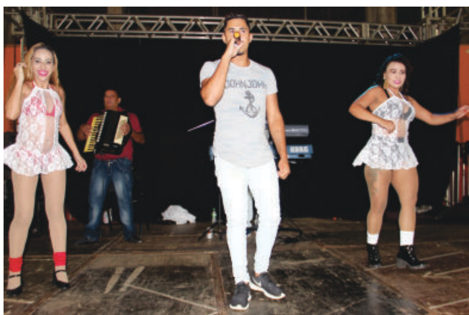
Banda Malícia do Forró garantiu o arrasta-pé com muito entusiasmo