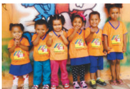
Alunos de um a três anos da escola de tempo integral