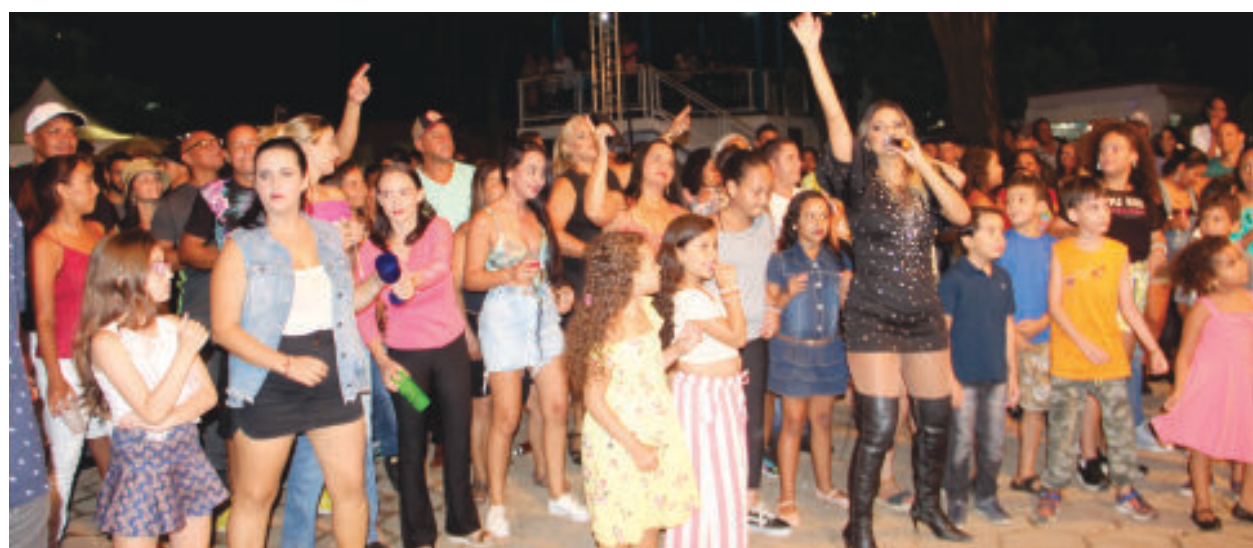
Do palco, para a rua, a cantora Lú Bahia arrastou o povo com os ritmos do axé