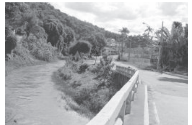
Ponte na região central ficou comprometida