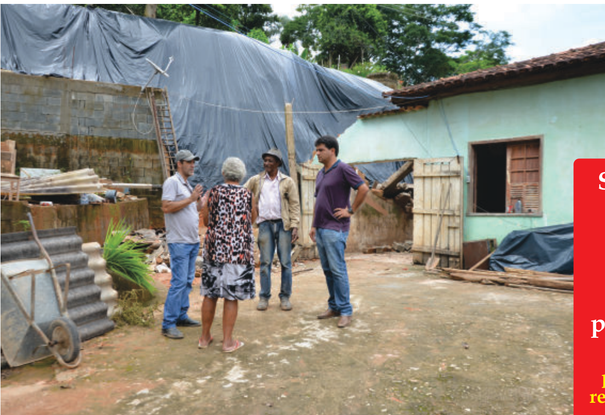
O prefeito Antônio Carlos visitou várias localidades impactadas em São Gonçalo