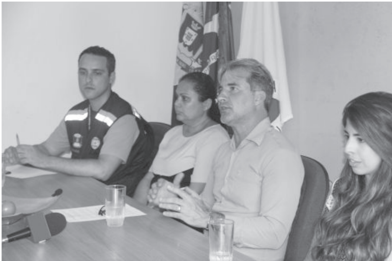
O prefeito Décio Santos ao lado de secretários durante coletiva na tarde de terça-feira (28)

Em números, foram atendidas de forma emergencial 163 pessoas, que até o dia 28 estavam em um abrigo montado na Escola Municipal Nossa Senhora do Rosário, no bairro Viúva. No local, elas