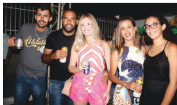
Moradores de São Sebastião e visitantes