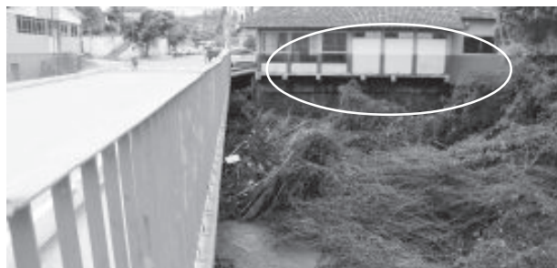
Rio subiu cerca de cinco metros (veja marca)

A Defesa Civil de São Gonçalo reconhece sua parcela de culpa em relação a ineficácia em relação ao alerta aos moradores, dizendo que irá investir medidas mais dinâmicas de comunicação, mesmo nas madrugadas.