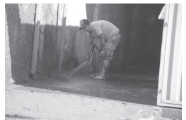
Jovem lava entrada da casa após retizar a lama