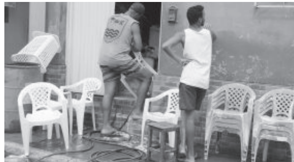
Moradores limpam móveis na manhã de quarta

Prefeito anuncia projeto para doar recursos financeiros às famílias e comerciantes