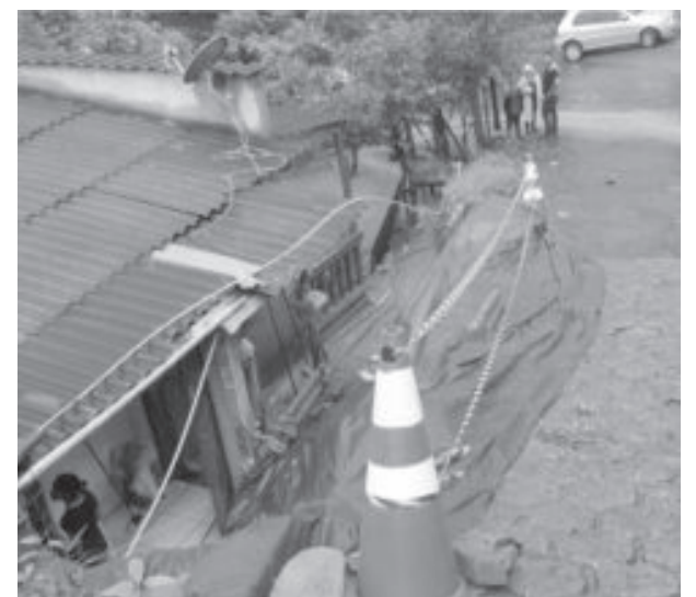
Casa em situação de risco após as chuvas. Cidade segue com alerta amarelo

No fim de semana, a Coordenadoria Municipal de Proteção e Defesa Civil (Compdec) registrou 73 ocorrências, das quais: