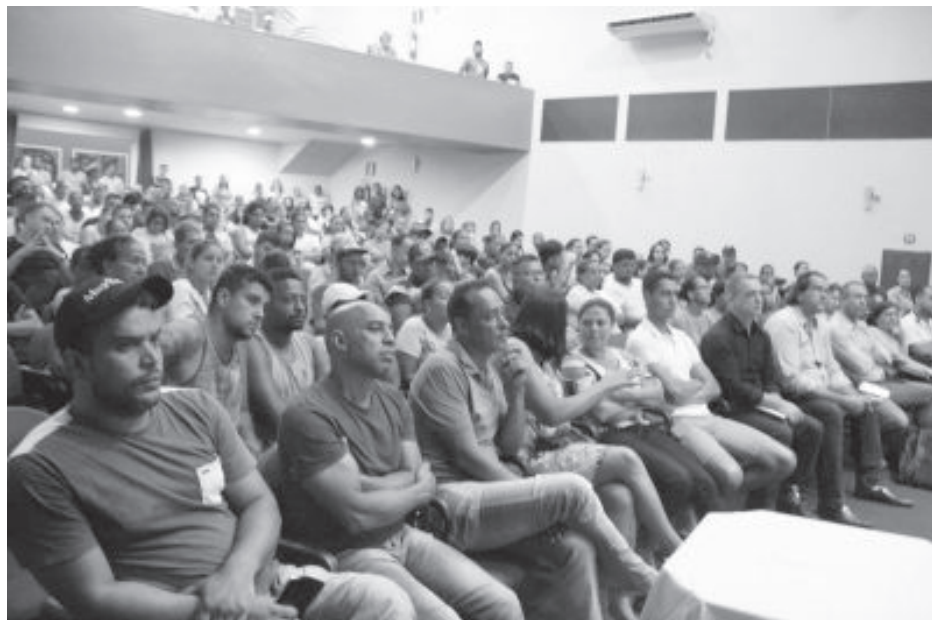
Moradores lotaram o Centro Cultural para reunião convocada pela Câmara

Passada a cheia do rio Santa Bárbara, que subiu pelo menos cinco metros em São Gonçalo do Rio Abaixo, entre os dias 23 e 25 de janeiro, invadindo casas e comércios, a população exige respostas da Defesa Civil Municipal e, principalmente, da Companhia Energética de Minas Gerais (Cemig) apontada como a responsável pelo caos e prejuízos que ultrapassam milhões de reais.