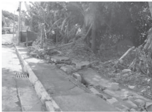
Força da correnteza derrubou vários muros

Um levantamento mais detalhado ainda estava sendo feito com visitas em todas as casas por agentes da Defesa Civil Municipal e das secretarias de Saúde e Ação Social.