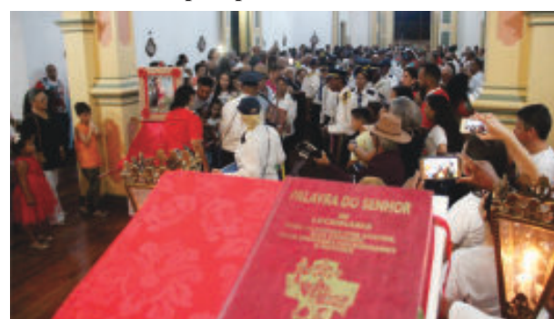
Apresentação da Guada de Marujos da Bolívia