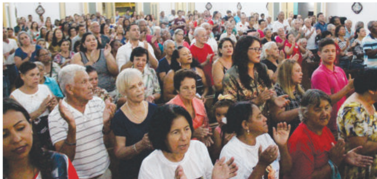
Igreja Matriz durante missa em louvor ao padroeiro São Sebastião