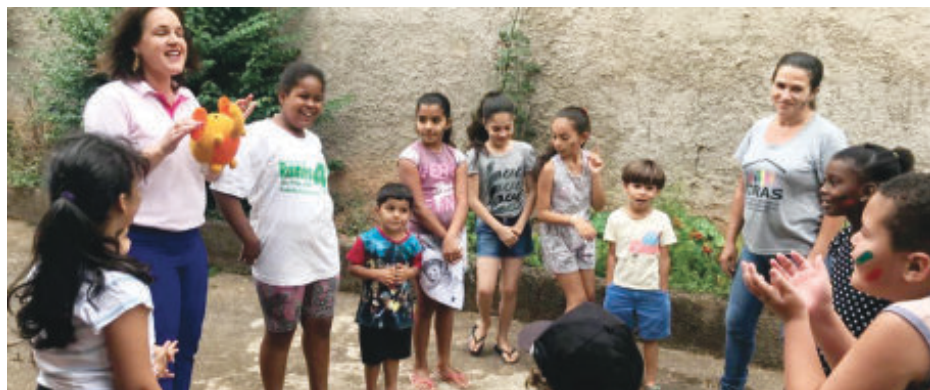
Dinâmicas em grupo com crianças para fortalecer vínculos familiares

■ Intervenção na sede do Cras e nas comunidades Cachoeirinha, Bolívia, Limoeiro, Gamagô, Botas e Córrego do Macaco. Mediante participação nas atividades do grupo de convivência através de dinâmicas, experiências e vivência cultural, sem perder de vista as ocasiões para reflexões sobre as práticas cotidianas. Na oportunidade foram abordados temas como: resgatar a convivência entre as comunidades; relações familiares, higiene pessoal, corporal e ambiental, parceria com Emater, que doou mudas de árvores frutíferas, confecção de amaciante, desinfetante e aromatizador de ambien-