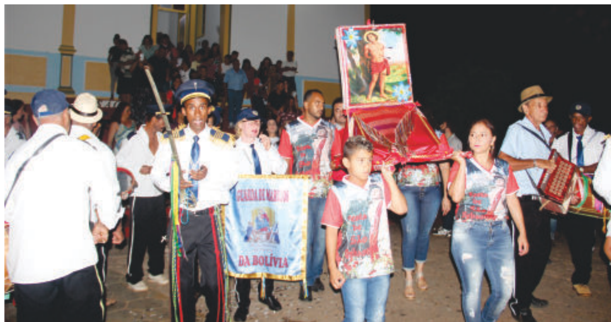
Devotos, festeiros do ano e guarda de marujos com bandeira de São Sebastião em direção ao hasteamento