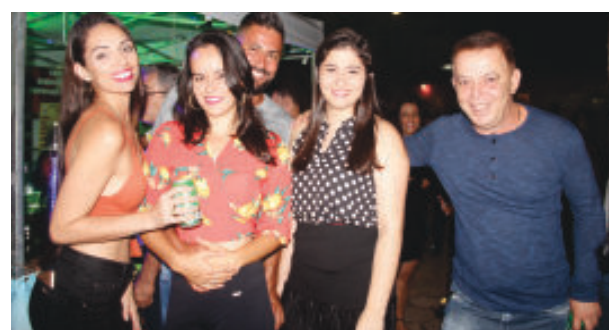
Prefeito Assis Viana ao lado de amigos