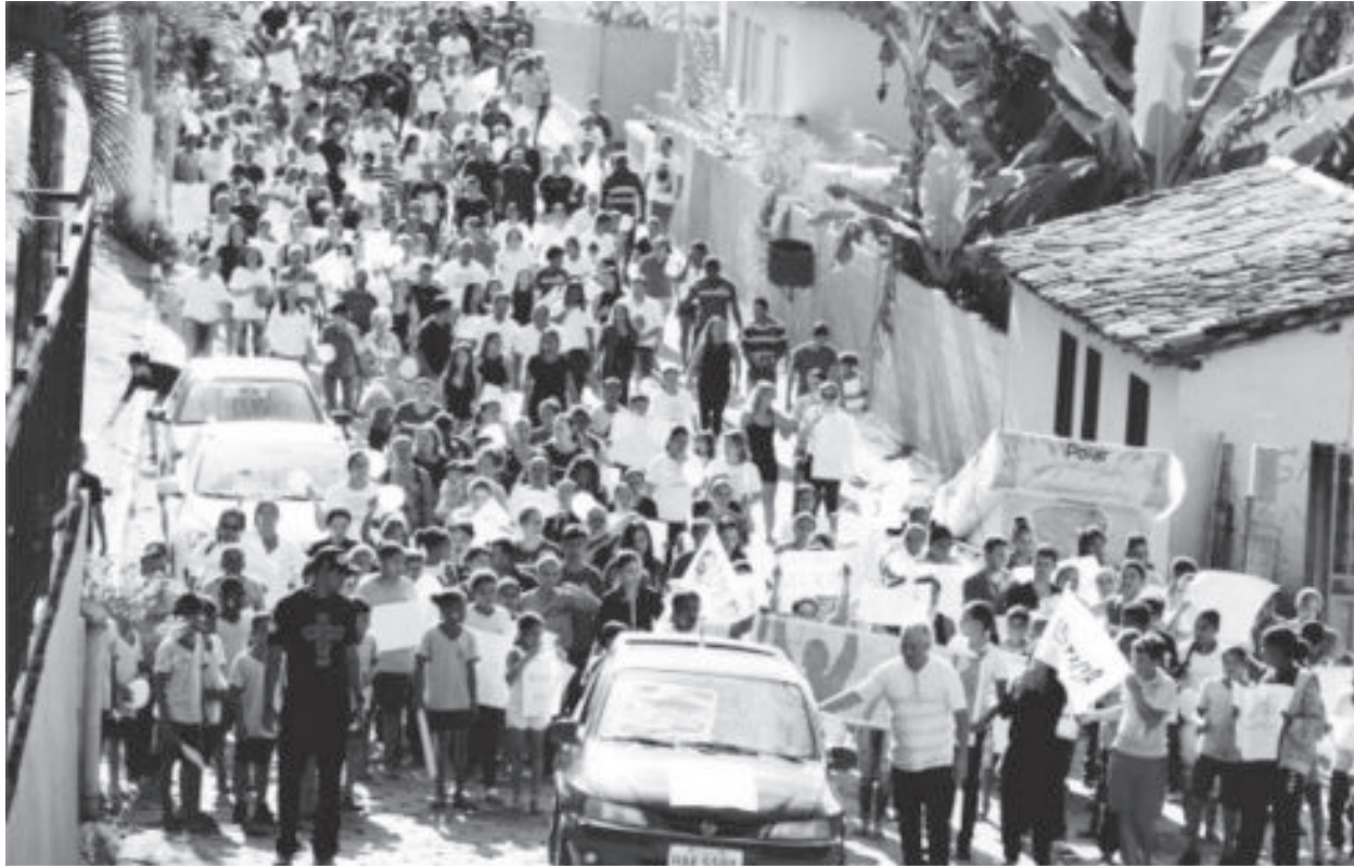
Crime bárbaro motivou protesto pelas ruas da cidade pedindo mais segurança e identificação dos autores