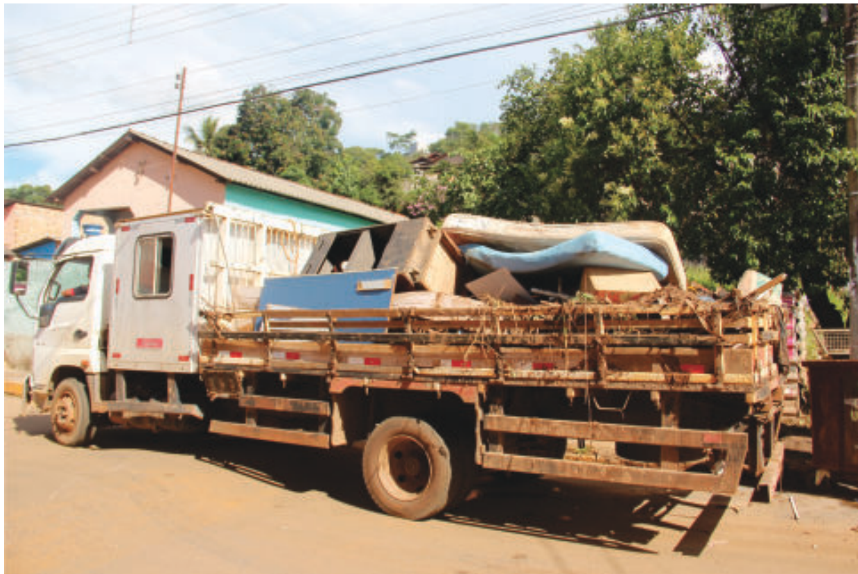
Caminhões retiram das casas móveis consumidos pela enchente; algumas famílias perderam tudo em Barão