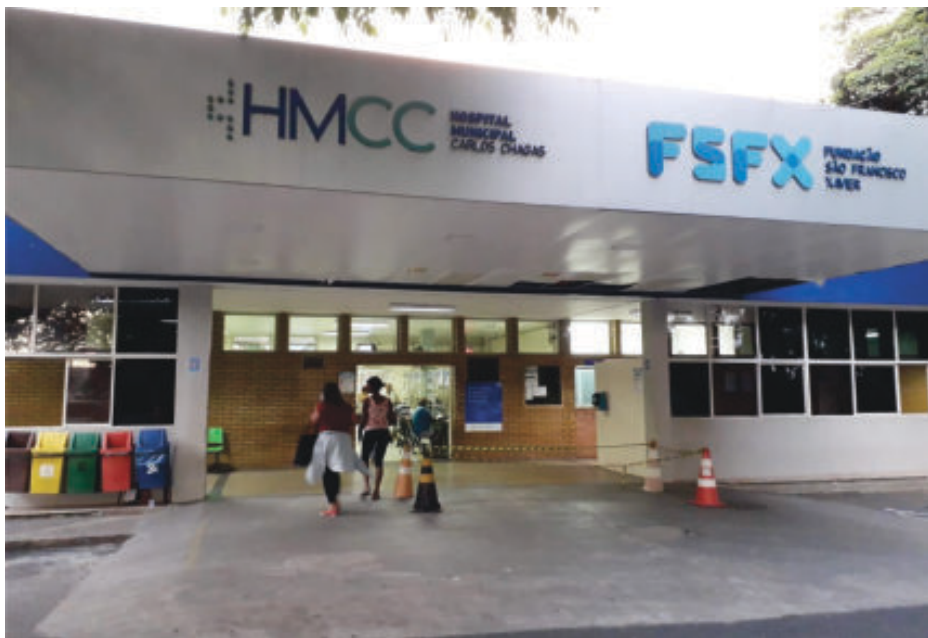
Os estudantes selecionados atuarão, a partir do mês de março deste ano

alizado pela Associação de Apoio à Residência Médica de Minas Gerais (Aremg) e as inscrições acontecerão no site "www.arem.org.br". O programa, com duração de dois a três anos, é credenciado pela Comissão Nacional de Residência Médica do Ministério da Educação (CNRM/MEC).