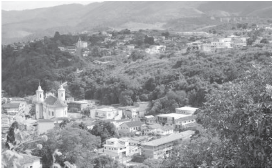
Vista panorâmica de Barão de Cocais; cidade tem crescido nos últimos anos