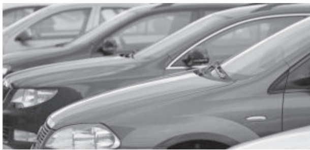
Autorização para tal uso foi publicada no dia 7