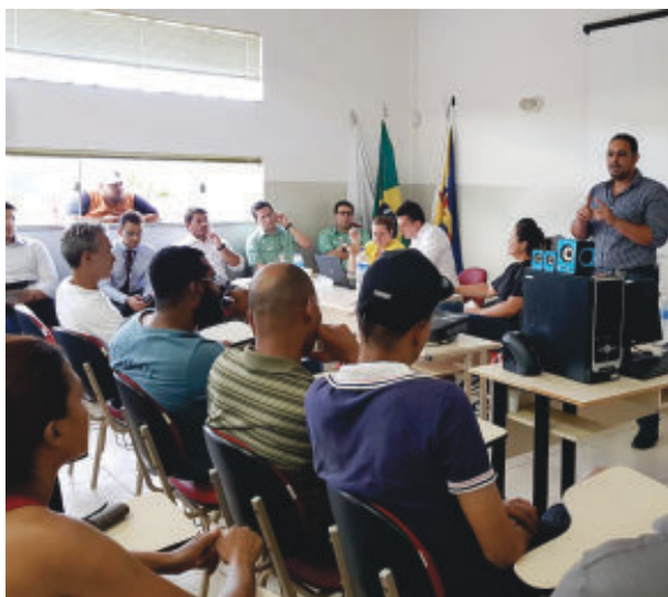
Durante encontro, Município informou aplicação dos repasses feitos pela Vale

A secretária de Saúde ofereceu detalhes sobre os processos seletivos realizados ou em andamento para a contratação de médicos e demais profissionais, ressaltando ainda a aquisição de equipamentos para a Unidade de Pronto Atendimento (UPA) e tornada possível