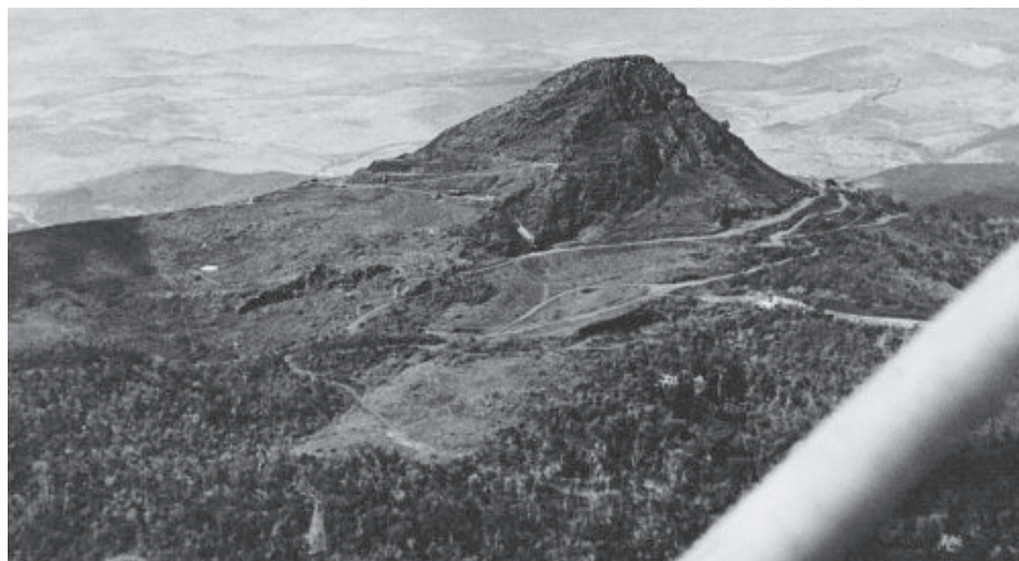
Pico do Cauê, em Itabira, antes da chegada da mineração industrial

Segundo a Wikipedia, um computador quântico é muito mais avançado e potente do que um computador clássico, desses que