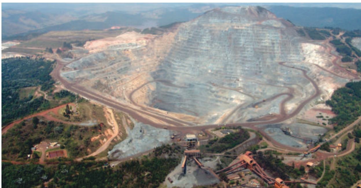
Mineral descoberto em Itabira pode revolucionar o futuro da tecnologia