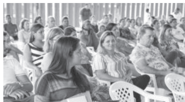
Encontro aconteceu na terça-feira (29) na quadra

“Viemos aqui para mostrar o que é real em relação às finanças públicas municipais e saber o porque da demora da Câmara Municipal em apreciar e votar pedidos de suplementações orçamentárias, fato que poderia com-