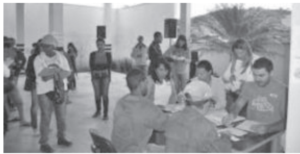
Principal objetivo do programa é emissão de documentos