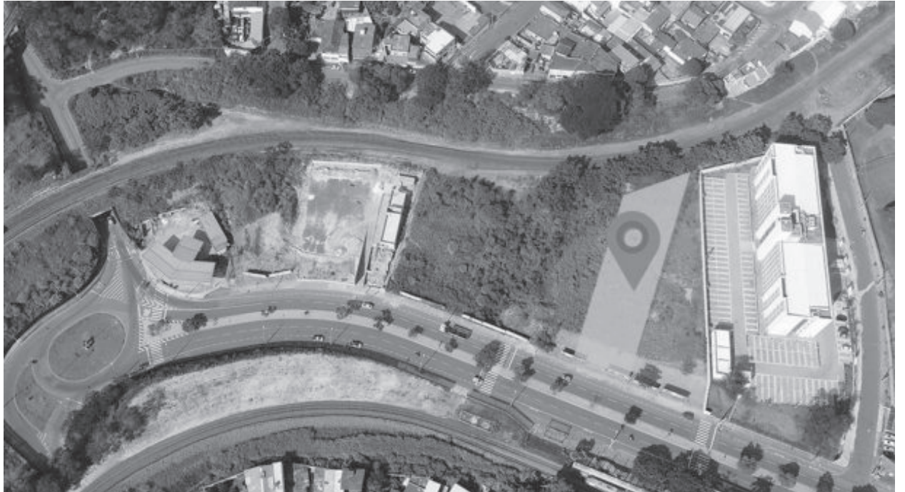
O mais caro - lote 6B, quadra 8, na avenida Mauro Ribeiro (ao lado do Fórum) tem avaliação mínima de R$ 1.199.597 milhão e depósito antecipado para propor oferta de R$ 59.979,85

De acordo com o edital, o maior preço ofertado por cada imóvel deverá ser pago em duas parcelas: 50% até o primeiro dia útil depois da abertura das propostas e, o restante, deduzidos os 5% de sinal, em até três dias após a homologação