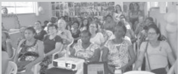
Encontro aconteceu no PSF do Patrimônio

O dia 29 foi marcado por um evento exclusivo para as mulheres são-gonçalenses. Com o tema “Seja sua própria heroína”, as participantes – pacientes do PSF Patrimônio – foram estimuladas a refletirem sobre diversos temas. A ação é alusiva ao movimento Outubro Rosa.