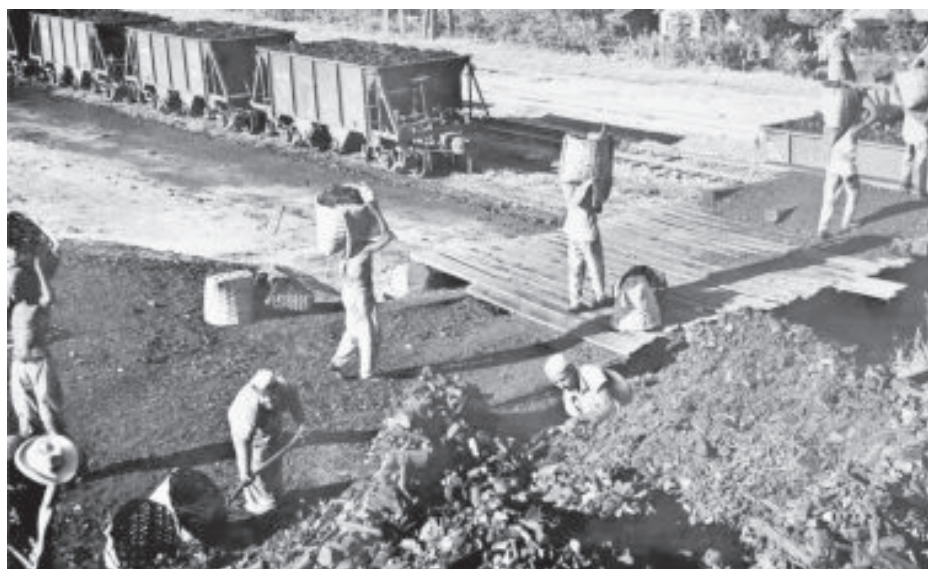
Há mais de meio século trabalhadores da CVRD transportavam minério em cestos de vime

Contudo, não se sabe ao certo o que seria a pós-mineração em Itabira por