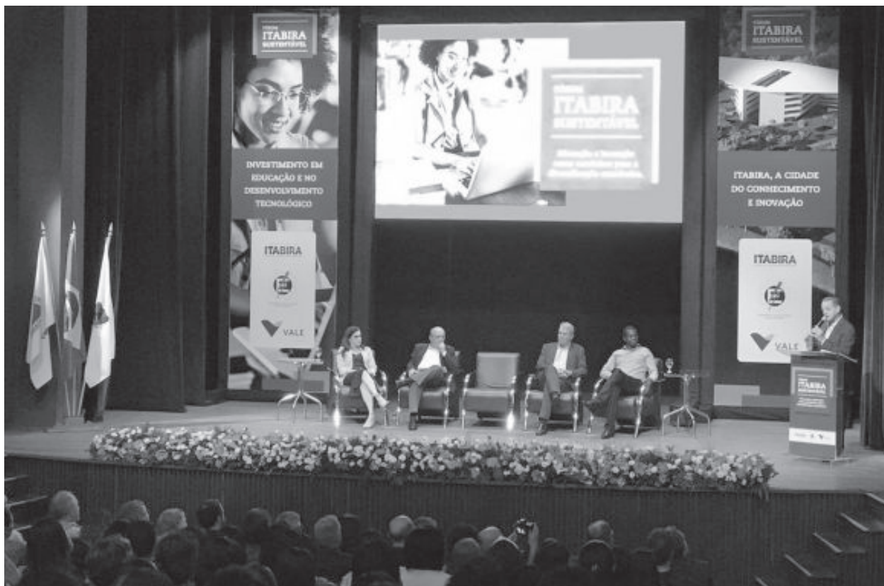
Prefeito Ronaldo Magalhães fala das propostas de inovação no Fórum Itabira Sustentável

Na ocasião, foram apresentados casos de sucesso na introdução de programas de fortalecimento da educação e do desenvolvimento de ecossistema de inovação por meio de palestras. O fórum contou ainda com uma programação de painéis de educação e inovação além da participação de toda a comunidade acadêmica da região.