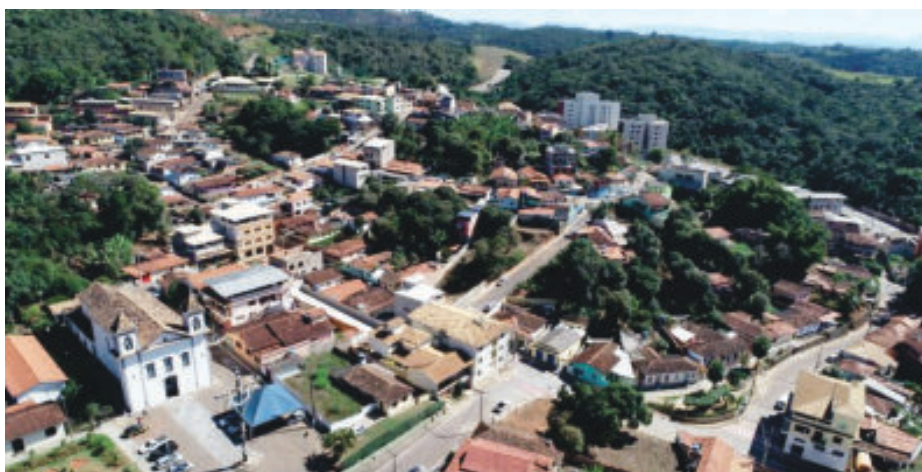
A nova ETA vai triplicar o volume de captação e tratamento no município, aumentando de 18 para 50 litros de água tratada por segundo

Na região central do Município será instalado um grande ponto de distribuição, com capacidade de 650 mil litros de reserva. O projeto contempla ainda mais quatro pontos de armazenamento com capacidade de 200 mil litros cada.