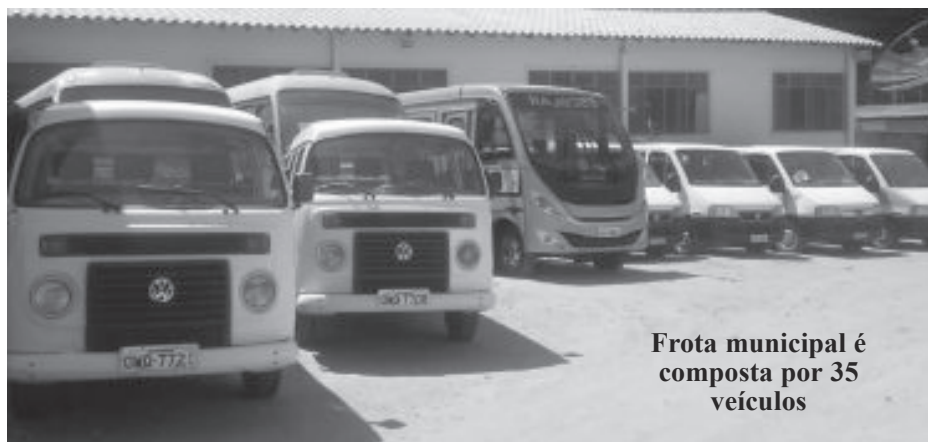
Frota municipal é composta por 35 veículos

Atualmente, a equipe da Secretaria de Transportes é composta por 23 profissionais, entre motoristas e mecânicos, atendendo todas as secretarias e setores da Prefeitura, como transporte escolar local e intermunicipal, Saúde, Obras e Ação Social.