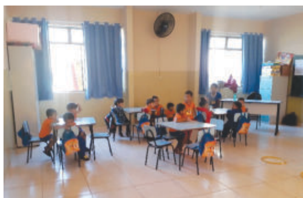
Reforma das salas de aula do Cmei da Mônica e novas mobílias