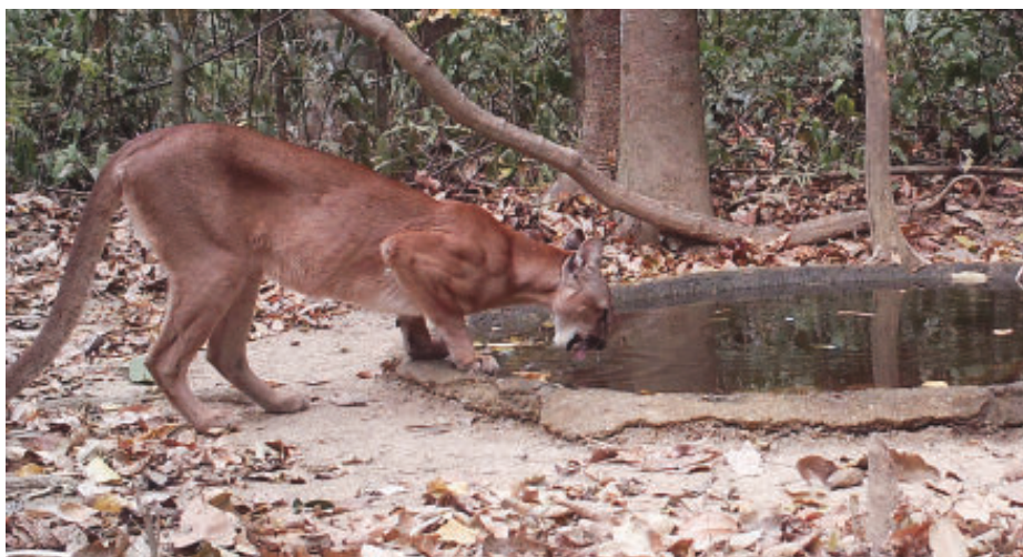
Os estudos e monitoramentos já possibilitaram o registro de 257 espécies de aves e 31 espécies de mamíferos de médio e grande porte

Para a Cenibra, o exemplo da Fazenda Macedônia reflete uma importante contribuição do setor privado aos esforços governamentais para a conservação dos ecossistemas naturais e da biodiversidade.