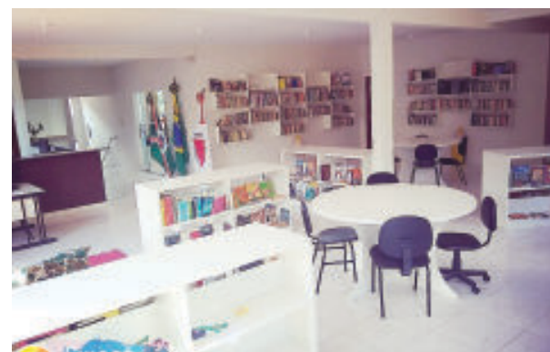
Biblioteca Municipal: novo espaço físico, mobiliário e acervo de livros