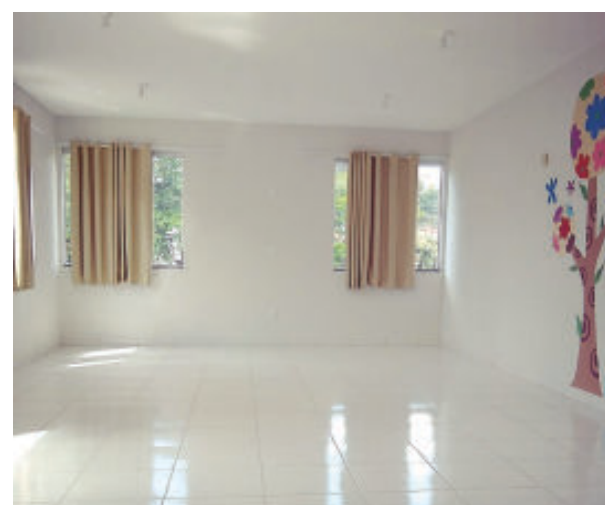
Novas salas de aula para receber em 2020 os alunos da Escola Municipal Euclides Ferreira de Sá