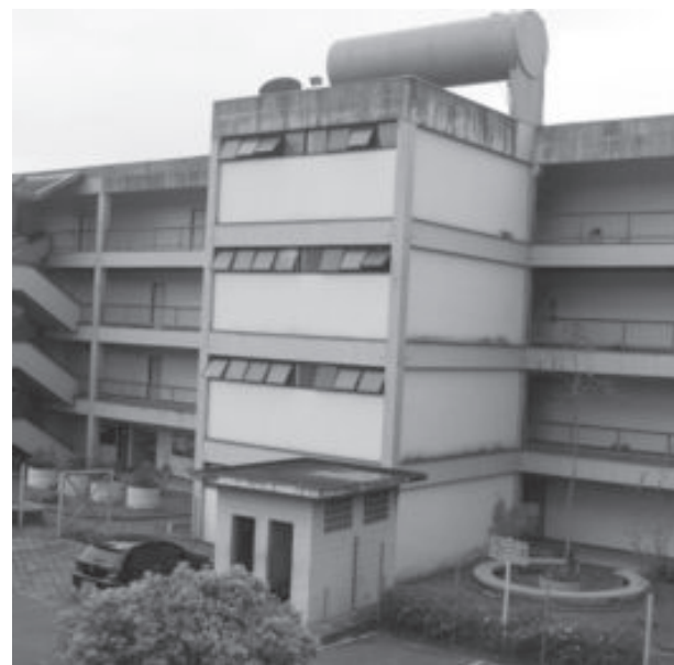
Na região, aparecem na avaliação a Funcesi, (foto), Ufop e Dóctum de João Monlevade

A aprovação no teste da Ordem dos Advogados do Brasil (OAB) é exigida para o exercício