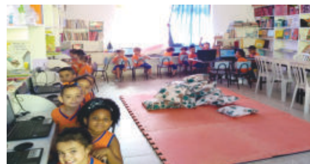
Reforma da biblioteca do Cmei da Mônica e compra de livros literários