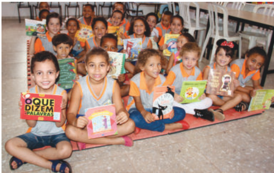
Alunos do 1º ano do ciclo da alfabetização do ensino fundamental da Escola Municipal Euclides Ferreira de Sá