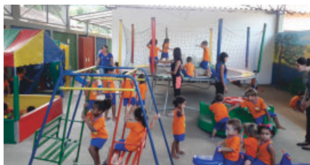
Área de recreação do Cmei da Mônica, com cobertura e vários brinquedos