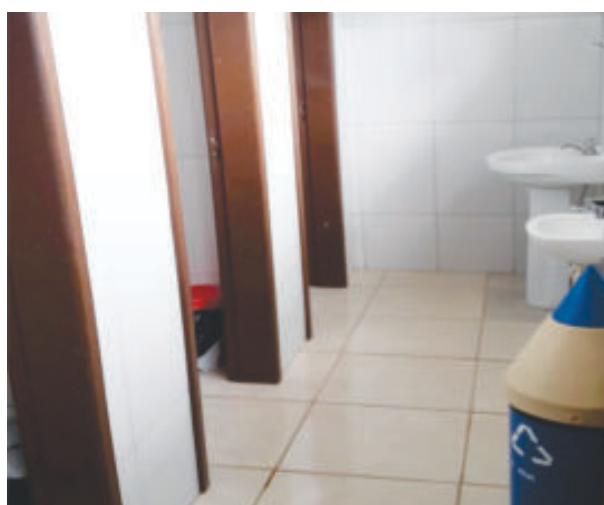
Reforma dos banheiros do Cmei da Mônica, mais dignidade e respeito