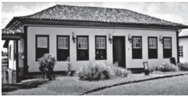
Prefeitura de Catas Altas publicou edital dia 14