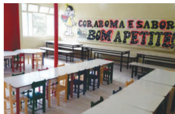
Reforma do refeitório do Cmei da Mônica, mais espaço e novas mobílias