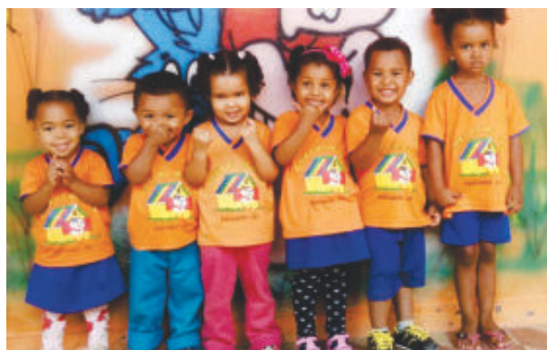
Alunos com até três anos na creche de tempo integral

dobrou com a inclusão do Maternal I e II