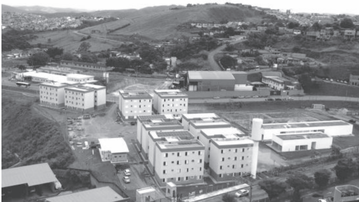
Unidades habitacionais estão nos bairros Fênix, Abóboras e Barreiro