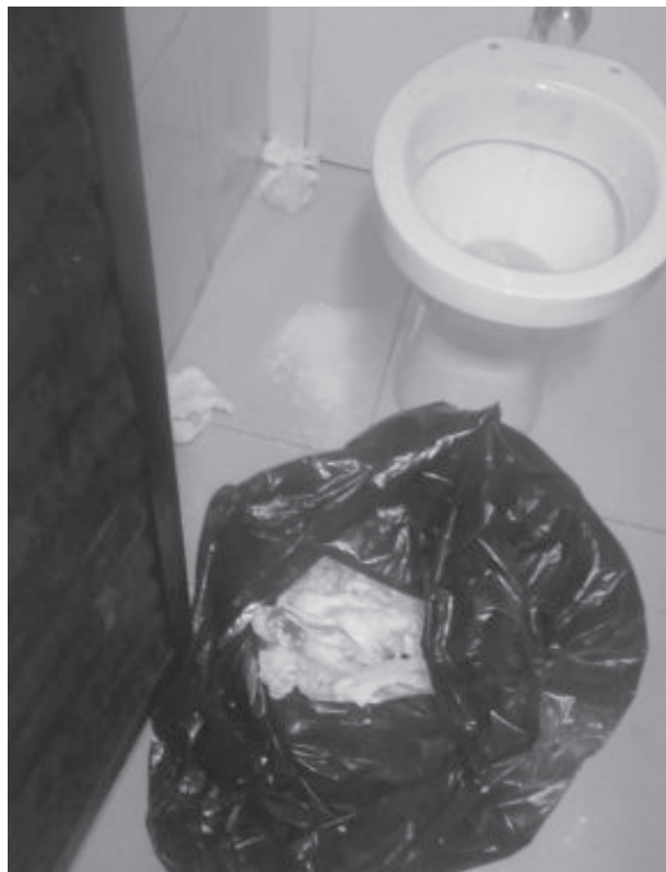
Garas contam que a vereadora pegou um balde para tinta, usado como cesto de lixo, e espalhou papel higiênico pelo local

As garis disseram para a vereadora que seria mais útil se ela estivesse ali para fiscalizar as condições de trabalho das servidoras, sem devidos de equipamentos de proteção individual (EPI), fato que inflamou ainda mais as discussões.