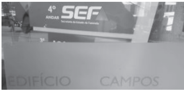
Unidade passa a atender das 13h às 17h