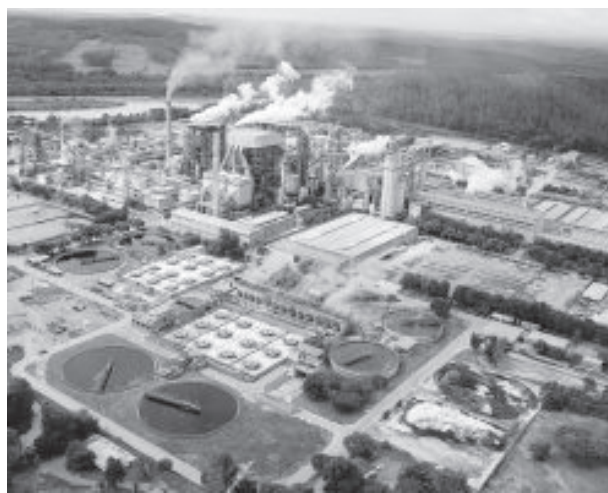
Fábrica da Cenibra em Belo Oriente

São oferecidos os seguintes benefícios para os estagiários: bolsa auxílio-