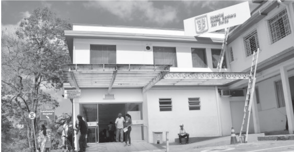
Hospital Nossa Senhora das Dores inaugurou seis leitos de retaguarda para atendimento dos casos advindos do Serviço de Saúde Mental

Serviço de Saúde Mental, o que aumentou a assistência para a comunidade itabirana e toda a região atendida pela instituição.