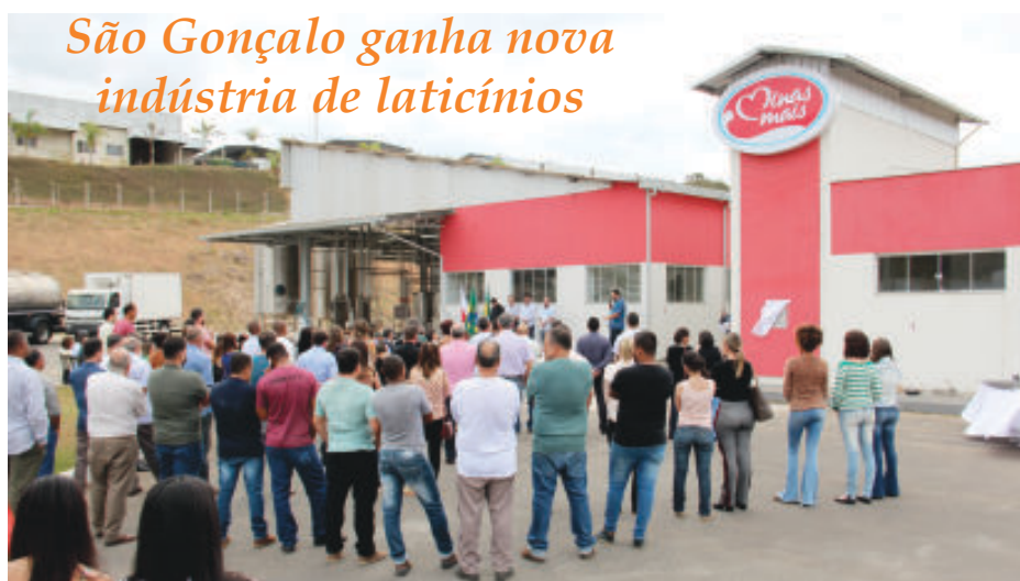
São Gonçalo ganha nova indústria de laticínios