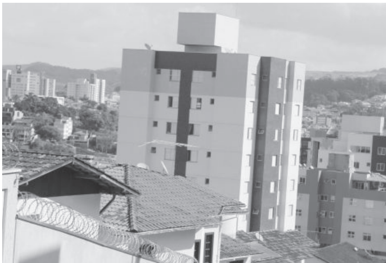
Cidade passou por grandes transformações em 10 anos e serviço para georreferenciamento chegou a ser contratado e pago em 2014, mas não foi executado, conforme CPI da Câmara de Vereadores

“Estamos na fase de contratação deste trabalho, que deverá ser concluído em um ano e meio. Ao final, esperamos ter a cidade toda digitalizada, o que nos dará possibilidade para acompanhar as tendências de crescimento. Temos uma área territorial com mais de 1.250