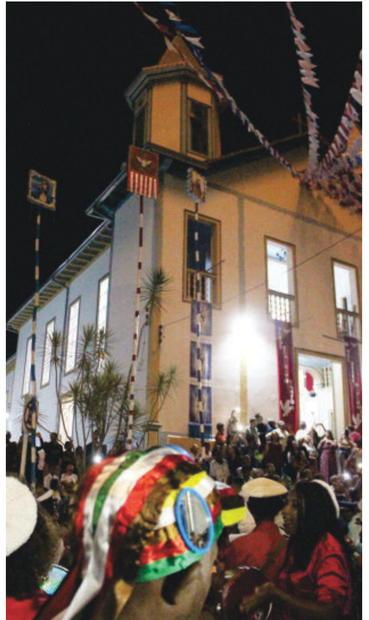
Hasteamento de bandeira e grande queima de fogos